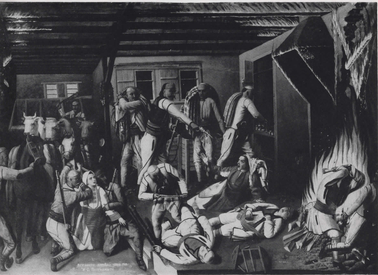
Иллюстрация к роману "Война и мир" Л. Н. Толстого В. С. Вайсманн