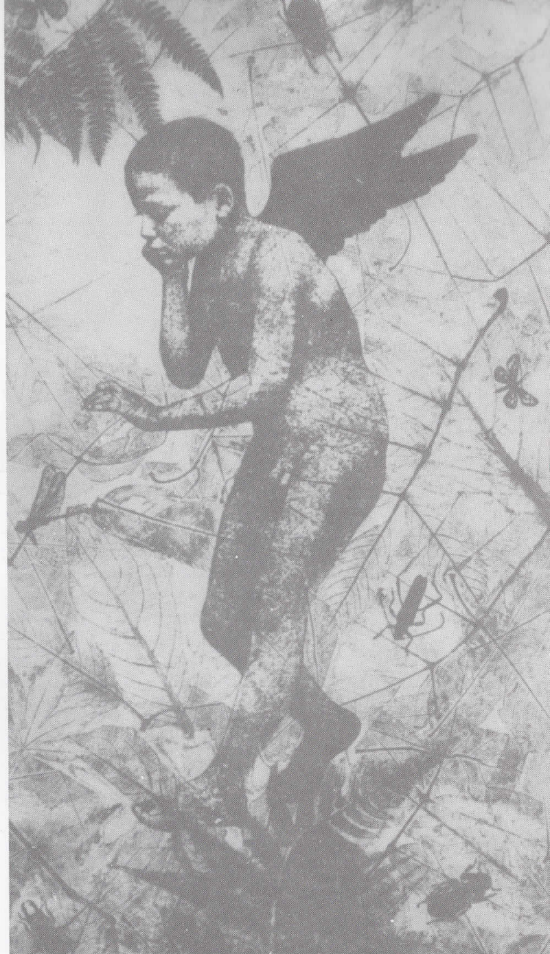
ВО ШУМАТА 1993, ФОТО ЕТКАНИЦА / МЕК ВОСОК

WOMEN SPRINKLING WATER 1984, ETCHING / AQUATINT