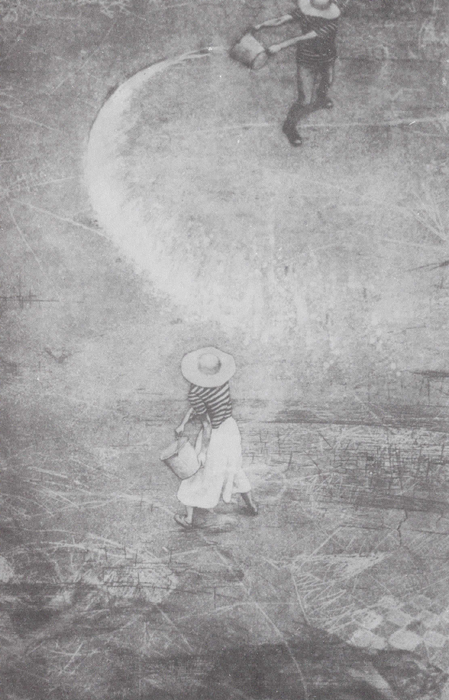
ЖЕНАТА ШТО ПОЛИВА 1984, ЕТКАНИЦА / АКВАТИНТА

WOMEN SPRINKLING WATER 1984, ETCHING / AQUATINT