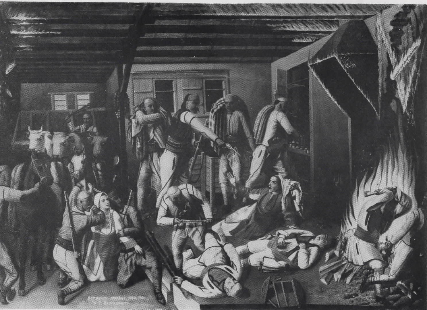
Историческая картина У. С. Барташова