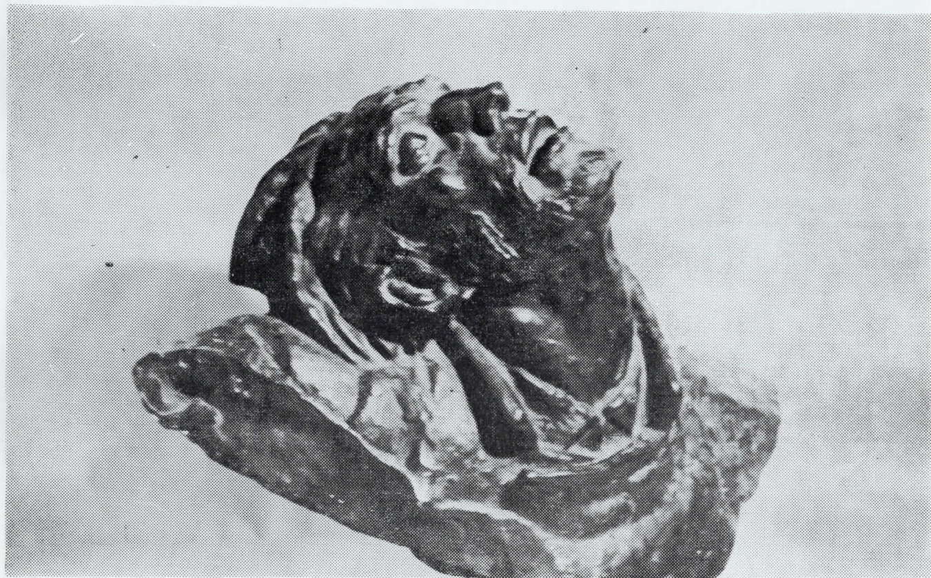
Аугустинчич Антун — РАНЕТ ПАРТИЗАН