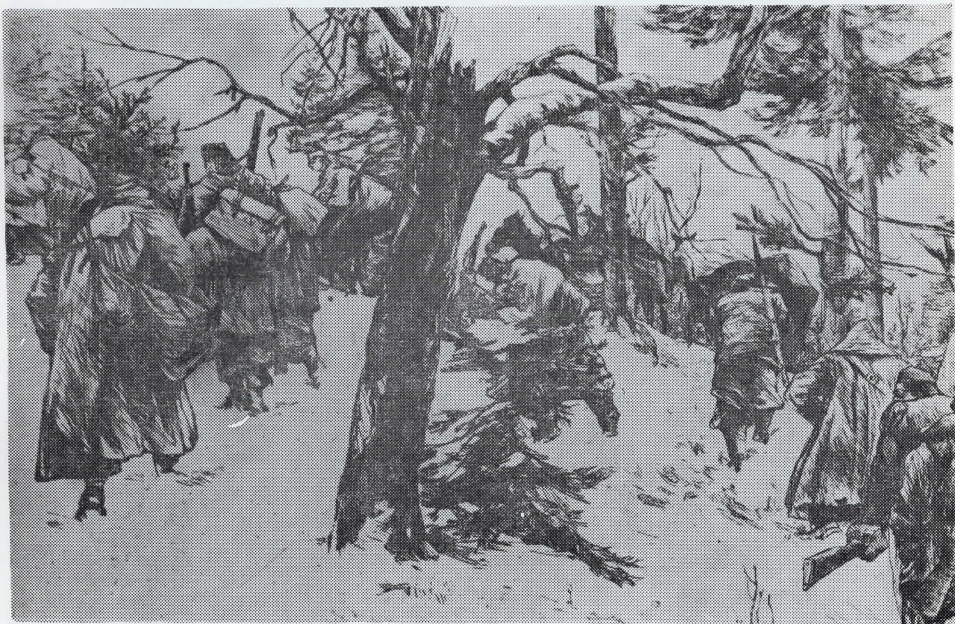
Дебењак Рико — ПОХОД НА XIV ДИВИЗИЈА — Похорје