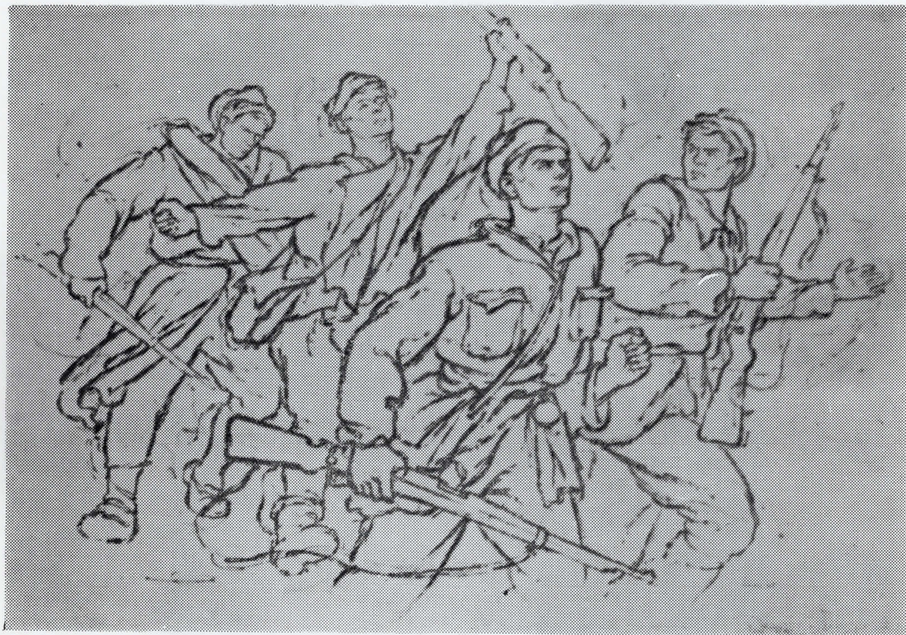
Караматеич Пиво — НАПАД