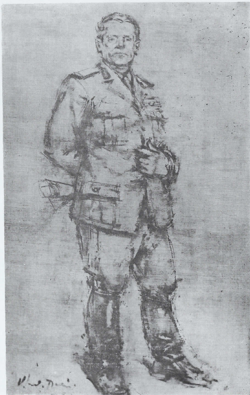
Бечич Владимир — МАРШАЛ ТИТО