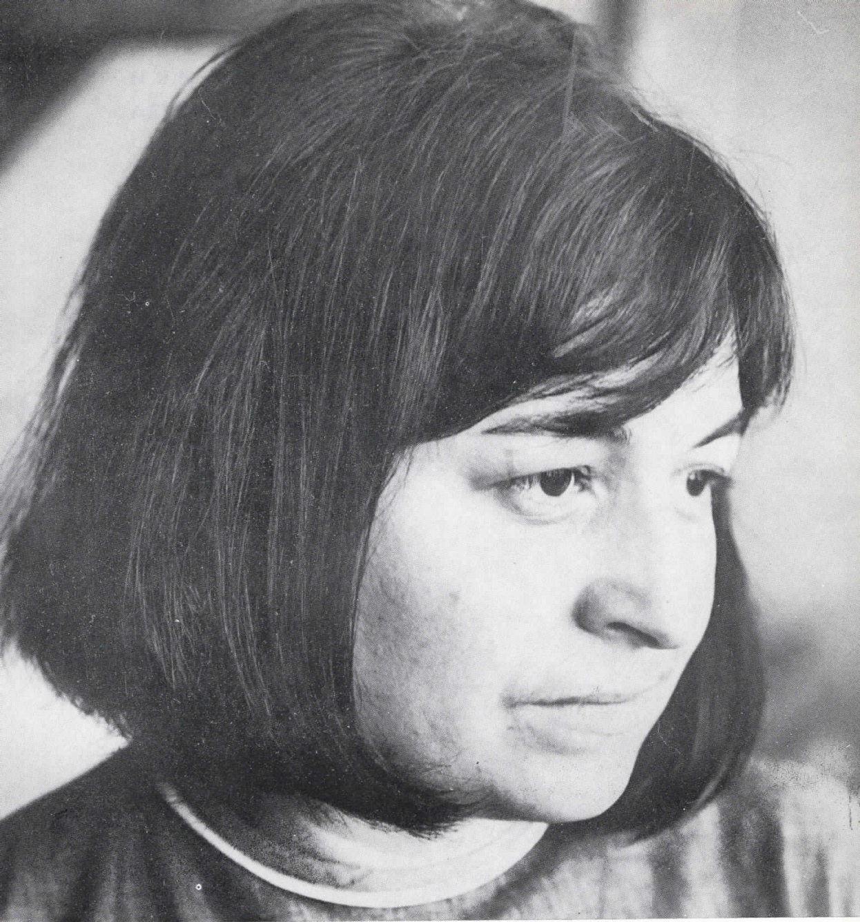
W. D. A. J. W. D. A. J. W. D. A. J.