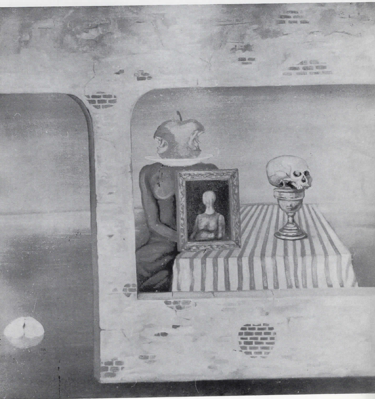
..МЕЛАНХОЛИЧЕН ЕКСТЕРИЕР", насло, 100x100, 197