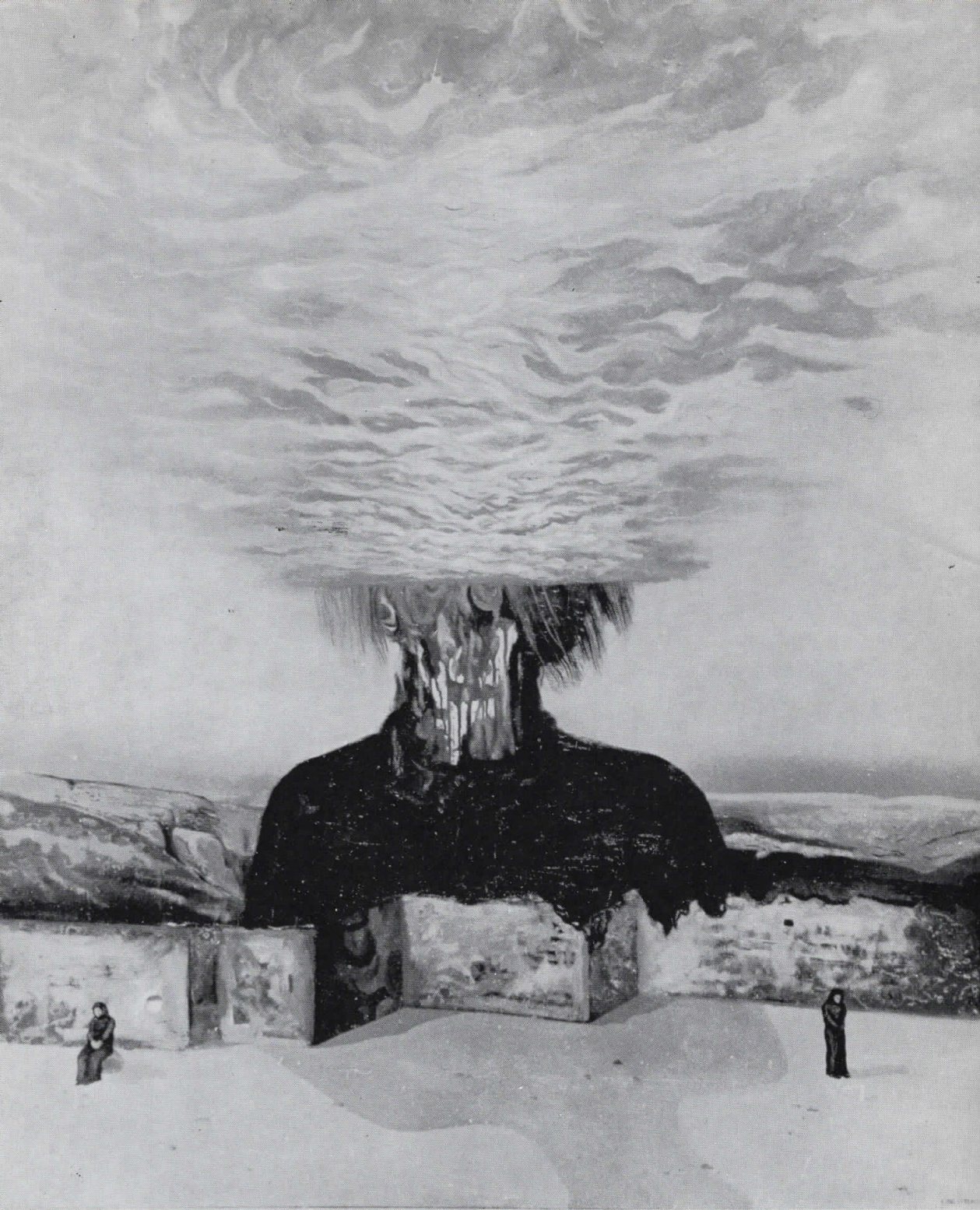
„КРВАВА МАКЕДОНСКА ЕПИФАНИЈА“, масло, 150x140, 1970