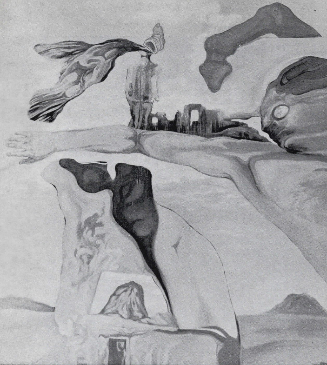
„ОСВОЈУВАЊЕ НА ВРЕМЕТО И ПРОСТОРОТ“ масло, 150x140, 1970