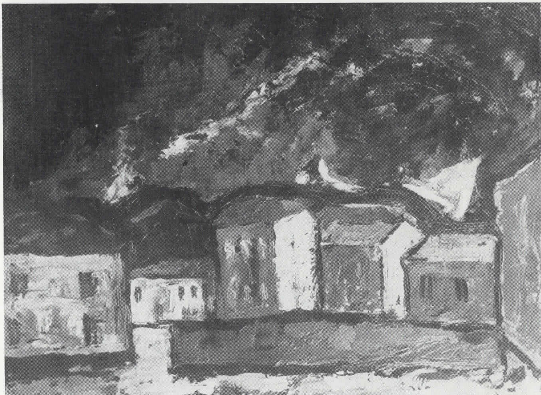
МОТИВ ОД БИТОЛА