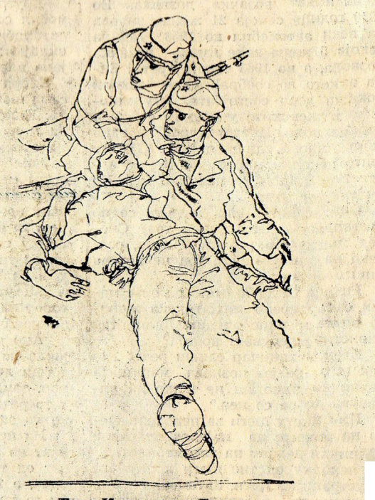
Тодо Ивановски: Борец

ло да се јава коњ како во вестерно. Чест и почитување на „Козара“ и „Три“. Револуцијата само тогаш ќе дојде до одраз на екранот кога ќе се открие (преку него) нејзината длабочина