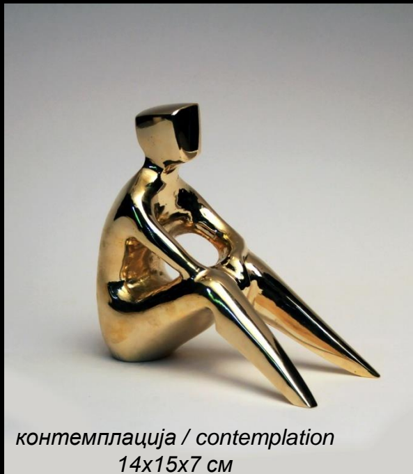
контемплација / contemplation 14x15x7 см

Учесник е на повеќе меѓународни симпозиуми во рамките на кои реализира монументални скулптури и групни изложби во Австрија , Словенија, Босна и Херцеговина, Хрватска, Србија, Турција и Индија, Добитник е на наградата за скулптура „Димо Тодоровски“ од ДЛУМ во 2008г. и 2017г.