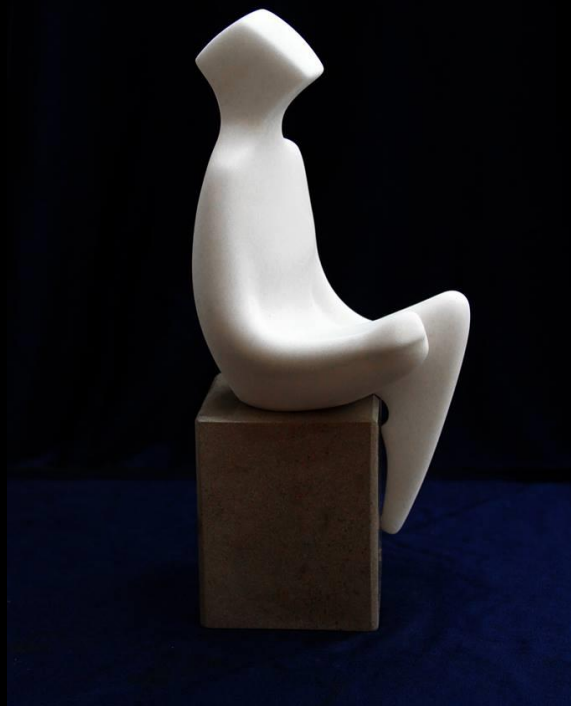
Секавања / memories 22 x 12 x 10 cm