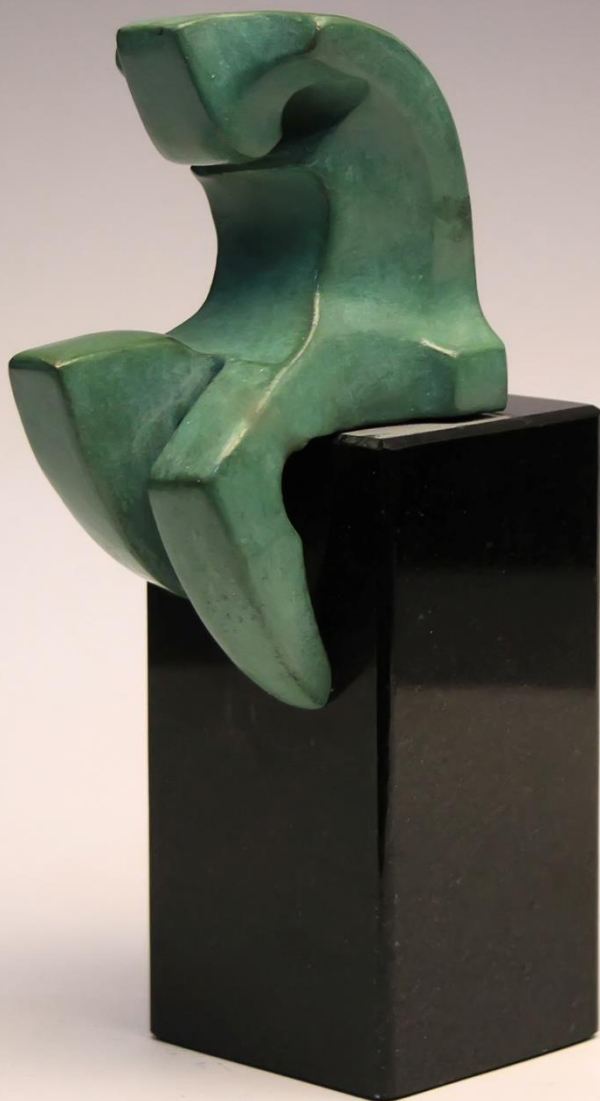
меланхолија / melancholia 13 cm

Издавач НУЦК „МАРКО ЦЕПЕНКОВ“ ПРИЛЕП Фотографии Тоше Ристов печати: