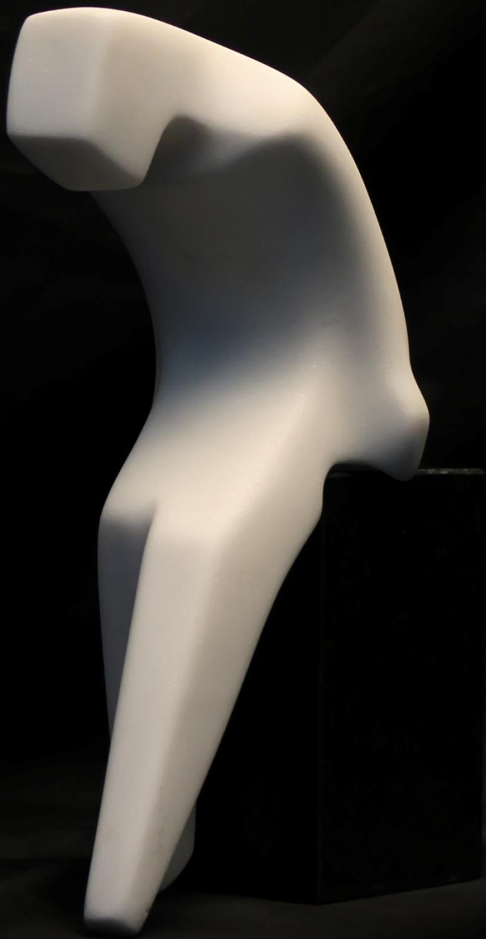
на работ / on the edge 22 x 13 x 9 см