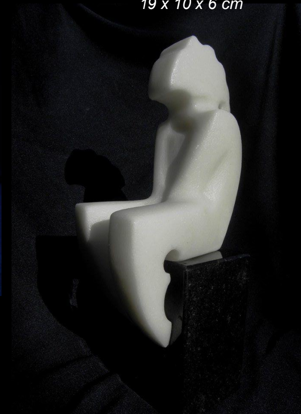
во исчекување / in anticipation 19 x 10 x 6 cm