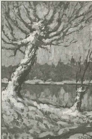
Мотиви од Вардар

е отпечатена сликата на Владимирски "Мотив од Прага".