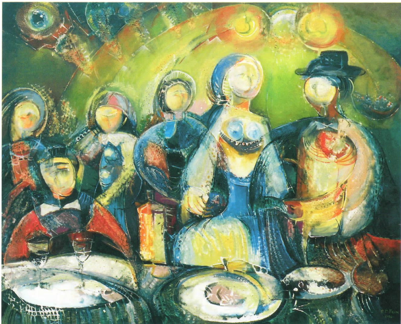
Празнување, 2000 масло на платно, 100 x 120 Celebration, 2000 oil on canvas, 100 x 120