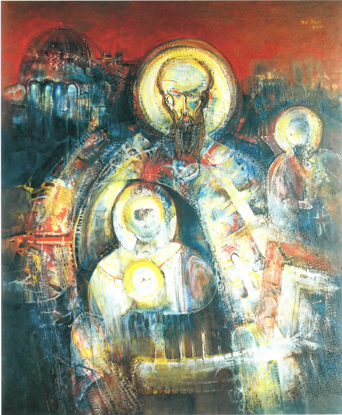
Климентие, 2001 масло на платно, 120 x 100 Klimentie, 2001 oil on canvas, 120 x 100