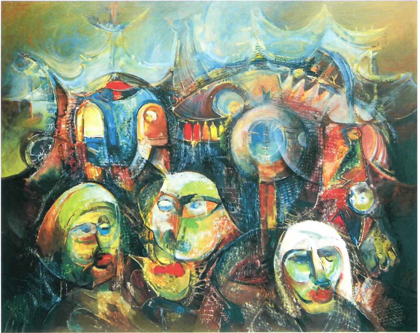
Демонски маски 2, 2001 масло на платно, 100 x 125 Demon Masks II, 2001 oil on canvas, 100 x 125