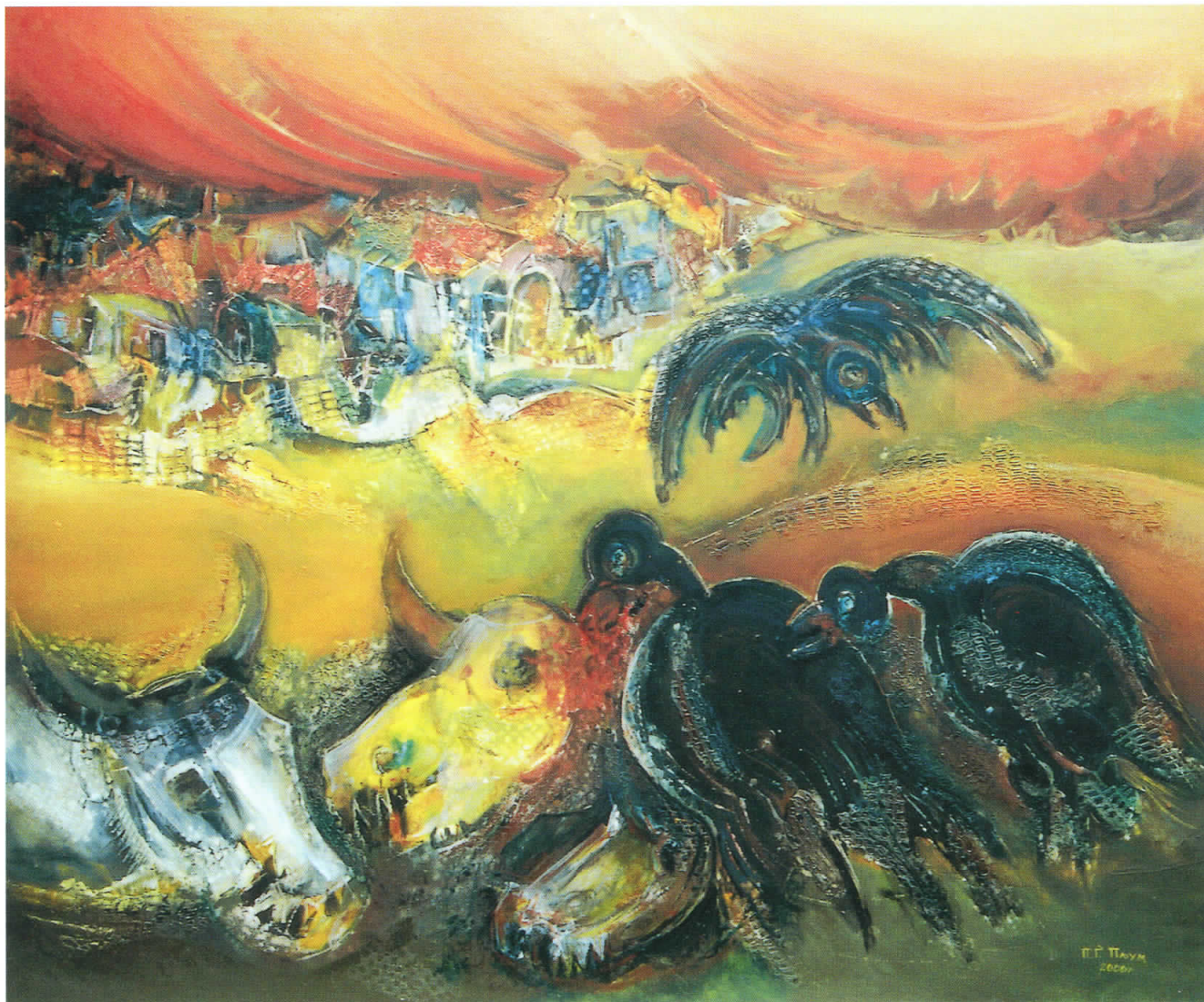
Страданието на Македонија, 2000 масло на платно, 100 x 120 The Suffering of Macedonia, 2000 oil on canvas, 100 x 120