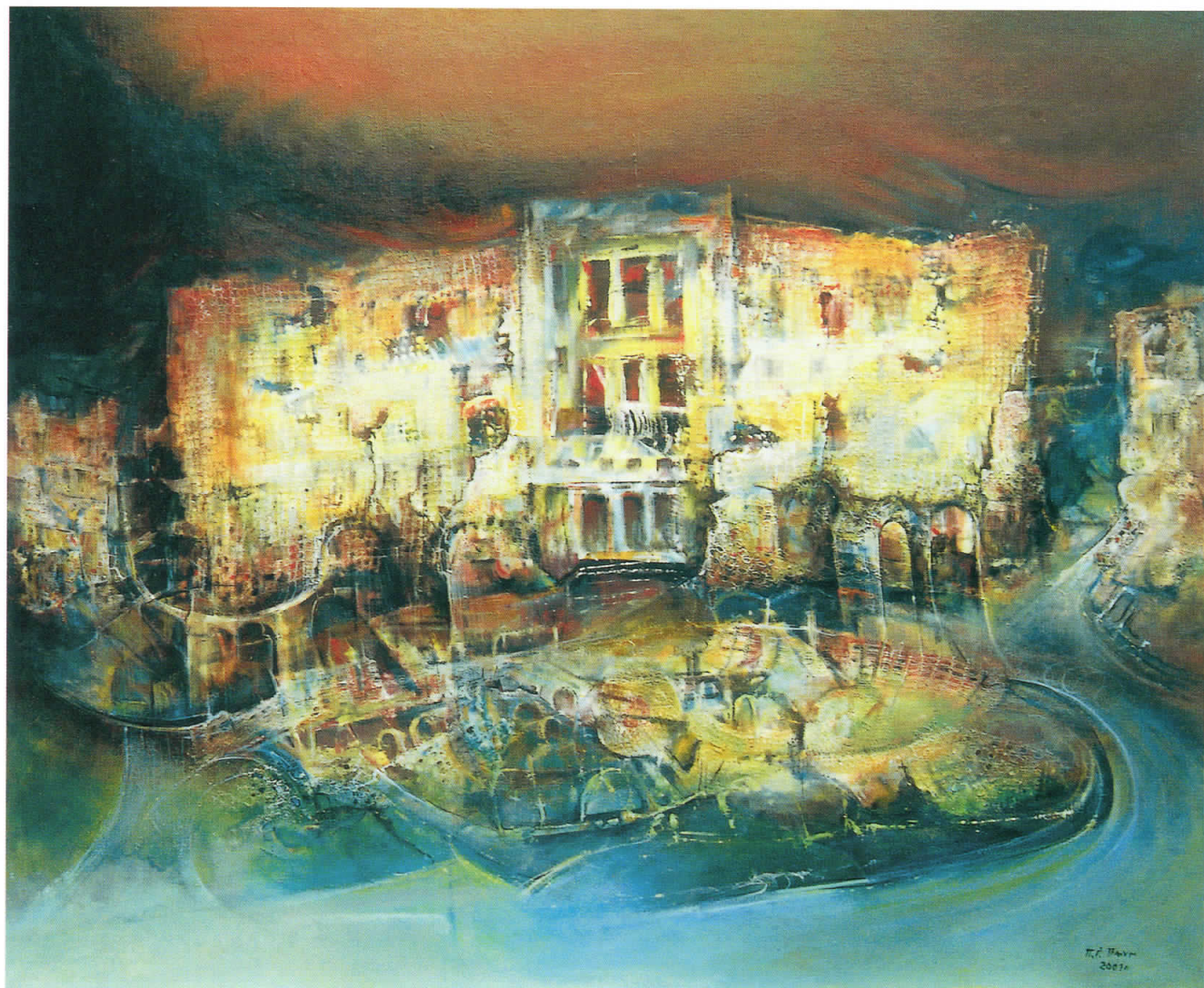
Замокот што тоне, 2001 масло на платно, 100 x 121 The Sinking Castle, 2001 oil on canvas, 100 x 121