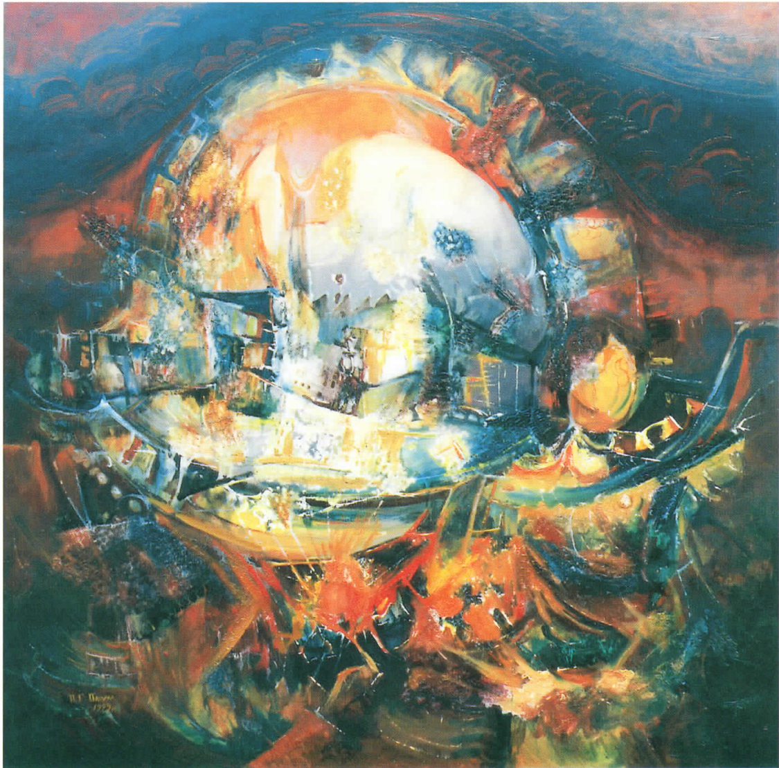
Раѓање на огнот, 1999 масло на платно, 100 x 100 Birth of the Fire, 1999 oil on canvas, 100 x 100