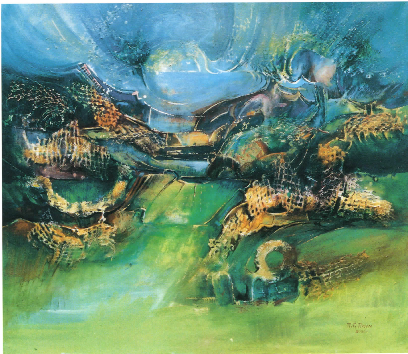
Митски предел, 1998 масло на платно, 100 x 80 Mythical Landscape, 1998 масло на платно, 100 x 80