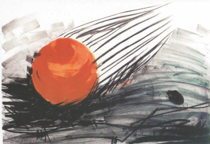
Lithography 48 cm x 65 cm Удар - Impact