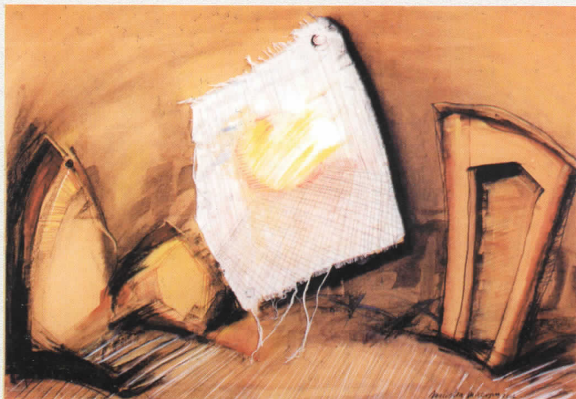
Цртеж - Draw 100 cm x 70 cm Изгрев - Rising