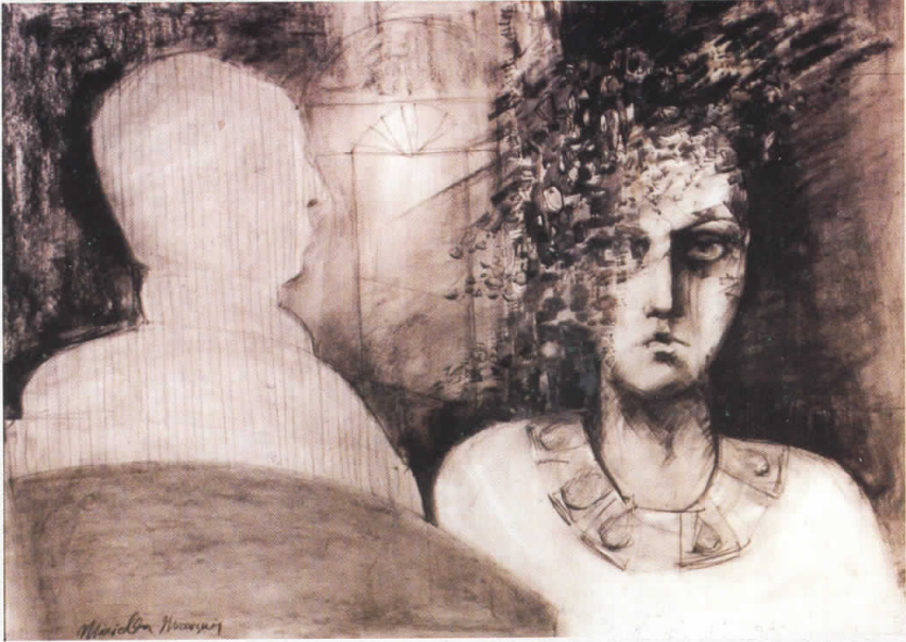
Цртеж - Drow 100 cm x 70 cm Непредвидливо - Unpredictable