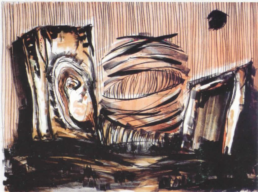
Lithography 48 cm x 65 cm Предел - Landscape