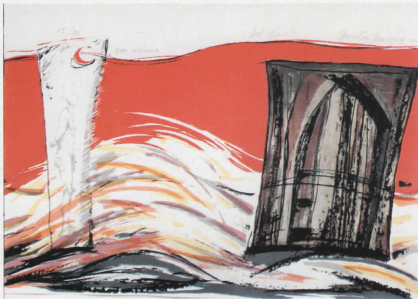
Combined 100 cm x 70 cm Нови видици - New views