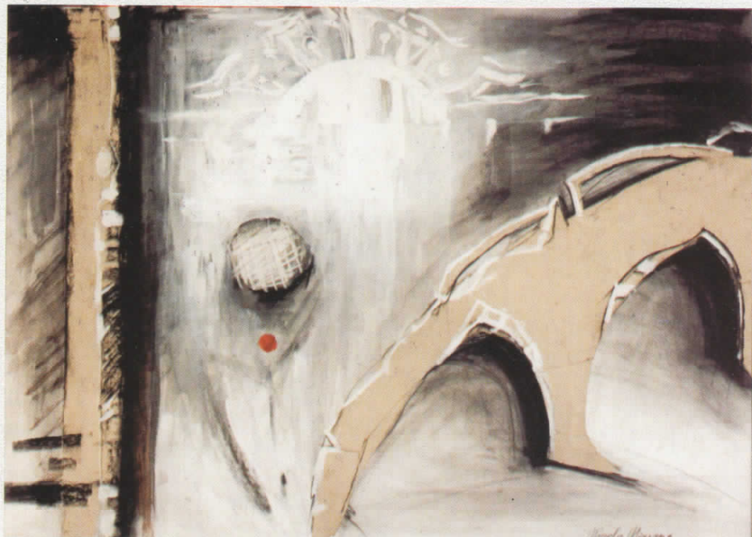
Цртеж - Draw 100 cm x 70 cm Сегменти од градот - City segments