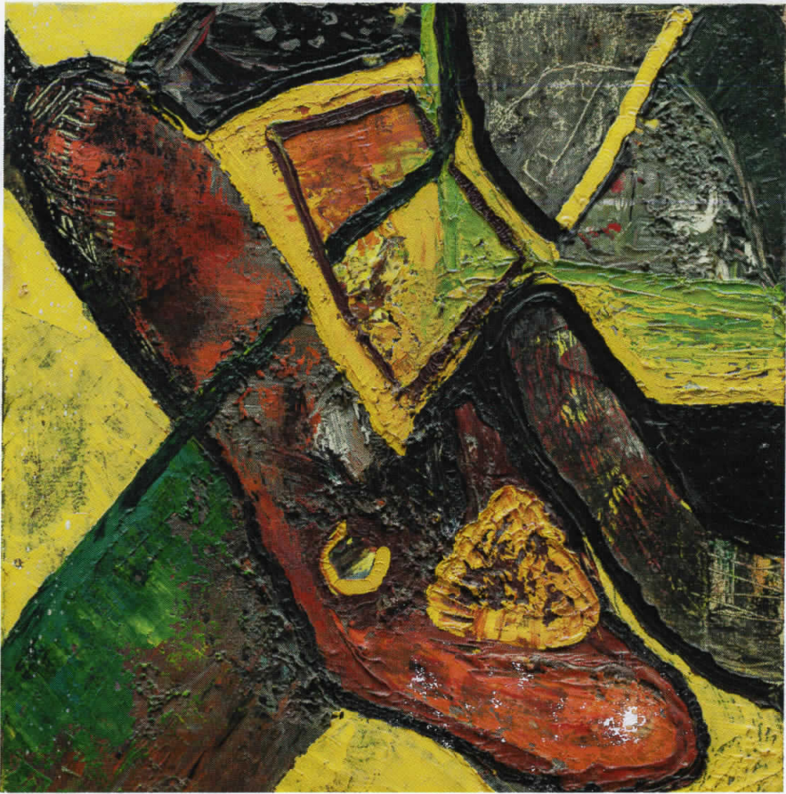
Циклус КАЛЕВАЛА, 35x35, масло/платно, 1998