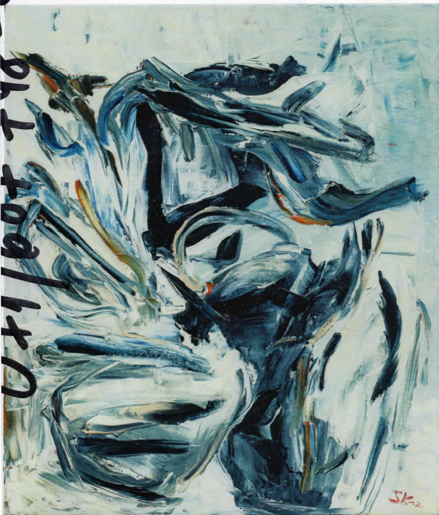
Циклус ЛИЦА, 70x50, акрил/платно, 2014

Циклус ЗЕМЈА, 60x60, ► комбинирана техника/панел, релјеф (детал), 1997