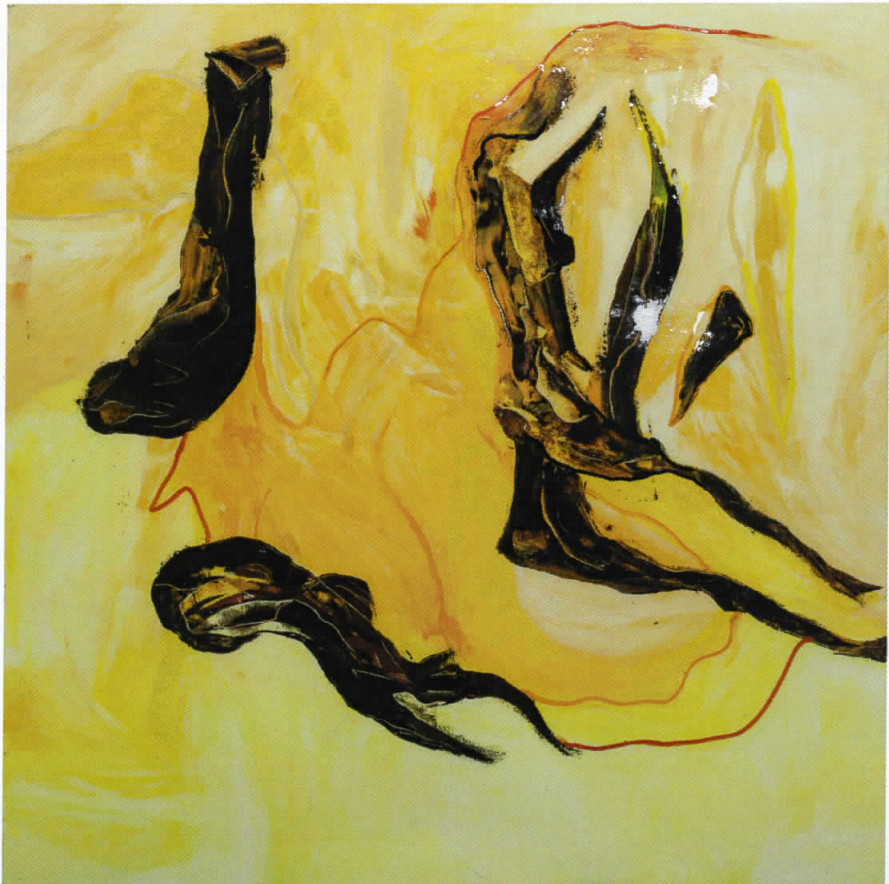
Циклус КРИСТАЛИ, 145X145, акрил/платно, 2003