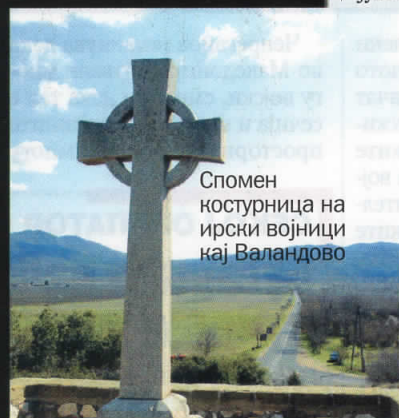
Спомен костурница на ирски војници кај Валандово

Македонски историчари бараат да им се изгради