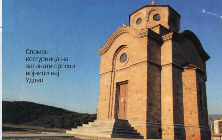
Спомен костурница на загинати српски војници кај Удово