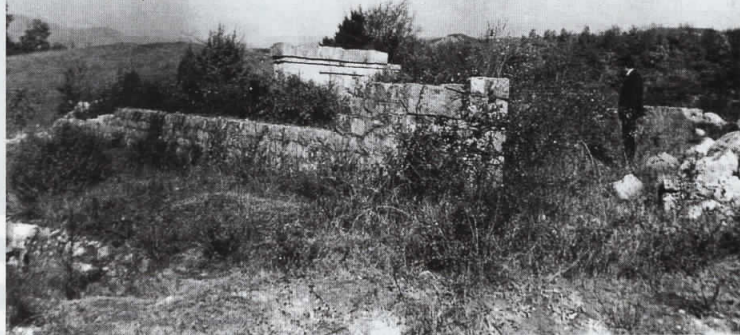
РАЗУРНАТ Споменикот на полковникот Константин Каварналиев снимен во 1970 година, кој денес е целосно разурнат и од него речиси нема никаква трага

ѓу селата Владаја и Ратерици, јужно од Дојран, што се водела на 22 и 23 јуни 1913 година. Тогаш бил тешко ранет по што починал. Прво бил погребан на патот меѓу селата Гопчели и Црничани, а оттаму неговите посмртни останки биле пренесени на Фурски Аништа каде што војници