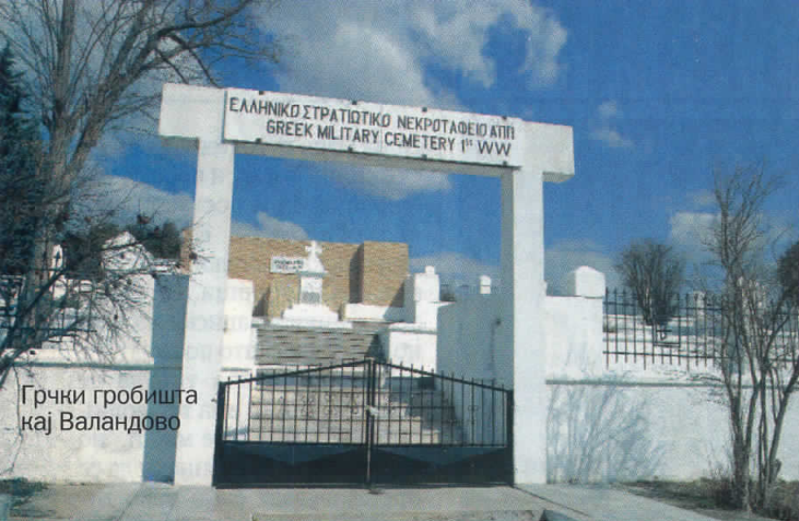
Грчки гробишта кај Валандово