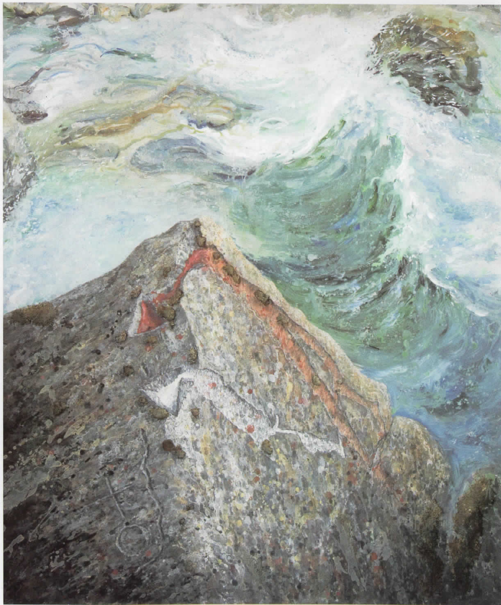
Адам од Пена 1, акрил, 2006, 125 x 150 cm Adam of Pena 1, acryl, 2006 125 x 150 cm