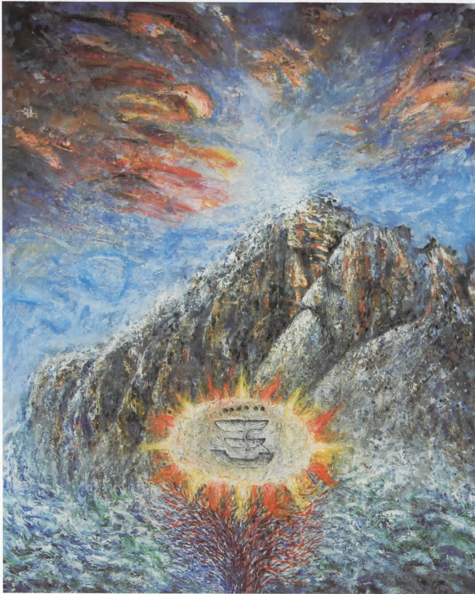
Илјадница, акрил, 2008, 125 x 150 cm Thousand (Iljadnica), acryl, 2008 125 x 150 cm