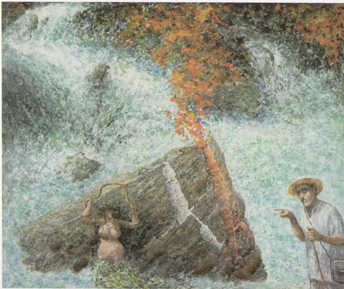
Адам од Пена 3, акрил, 2007, 125 x 150 cm Adam of Pena 3, acryl, 2006, 125 x 150 cm