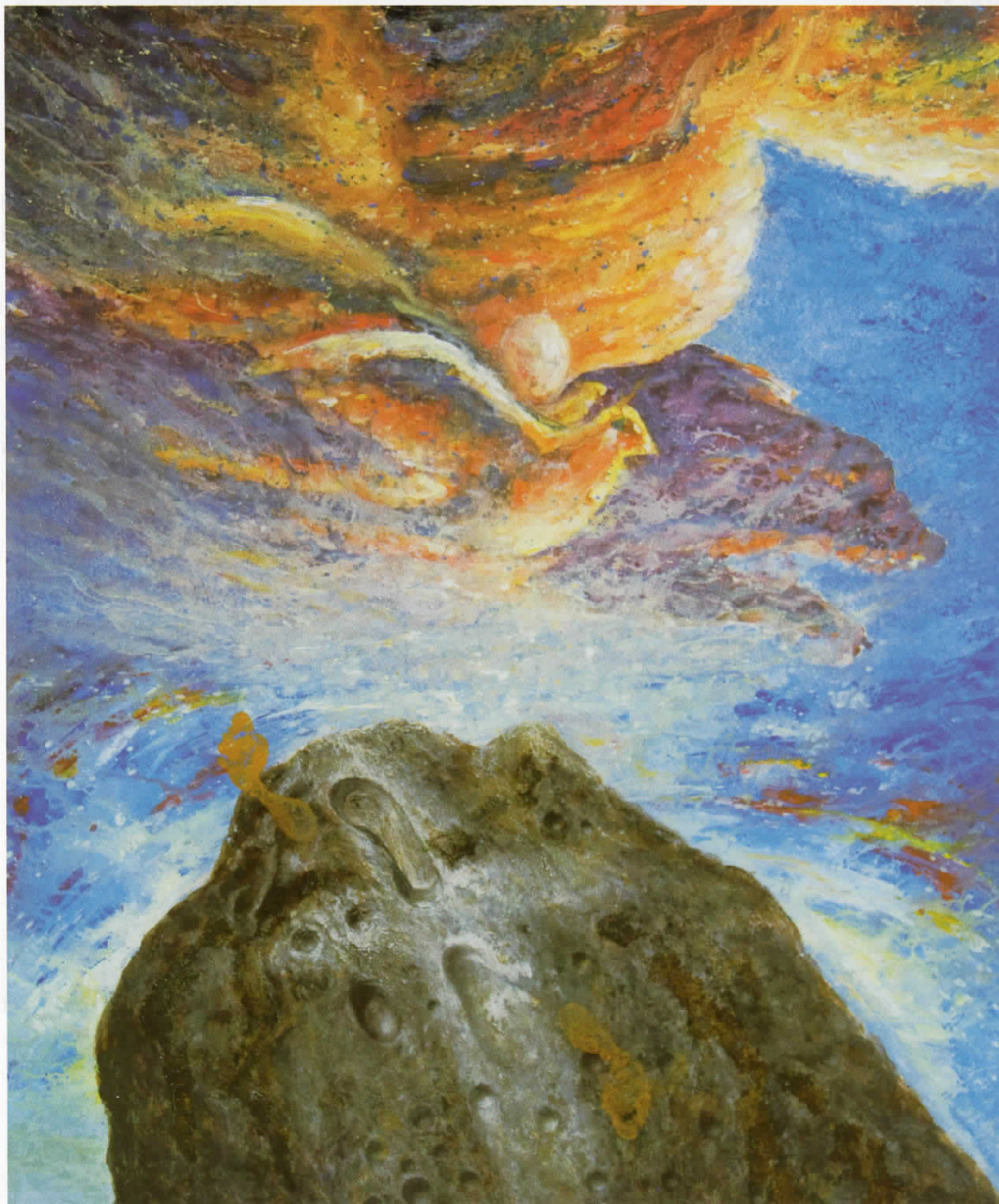
Стапките на животот 2, акрил, 2007, 125 x 150 cm The footsteps of life 2, acryl, 2007 125 x 150 cm