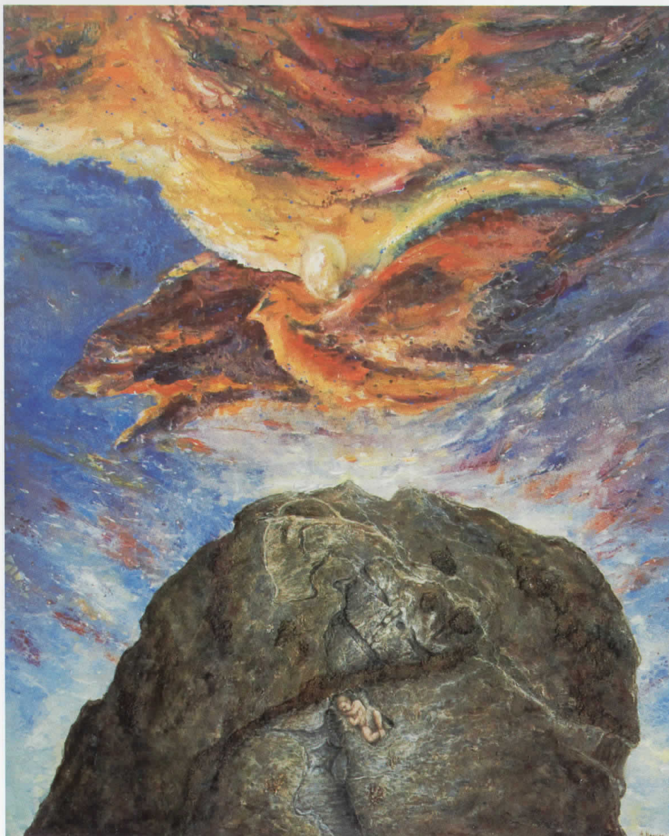
Маркоа карпа 2, акрил, 2008, 125 x 150 cm Marko's rock 2, acryl, 2008 125 x 150 cm