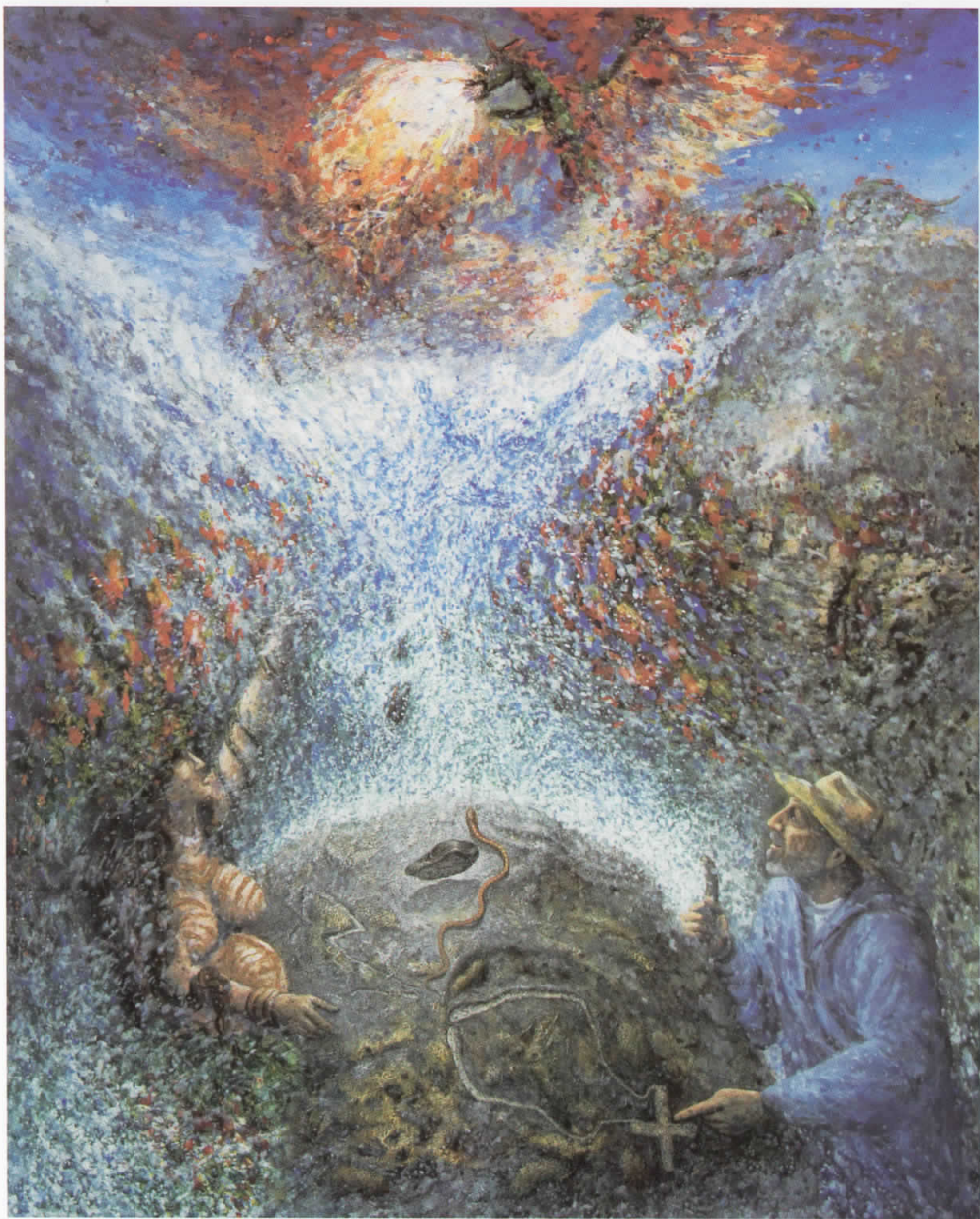
Вечните симболи 2, акрил, 2008/9, 130 x 170 cm Eternal symbols 2, acryl, 2008/9, 130 x 170 cm