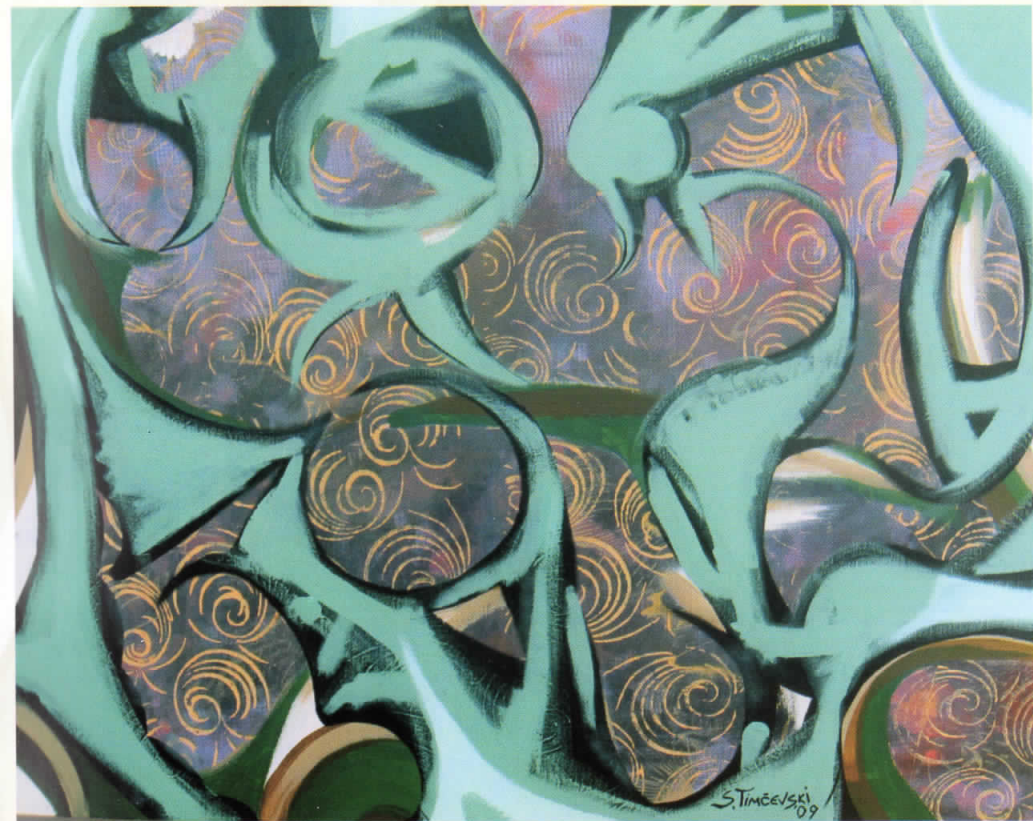
ДИНАМИЧЕН МОМЕНТ комб.тех. DYNAMIC MOMENT mixed media