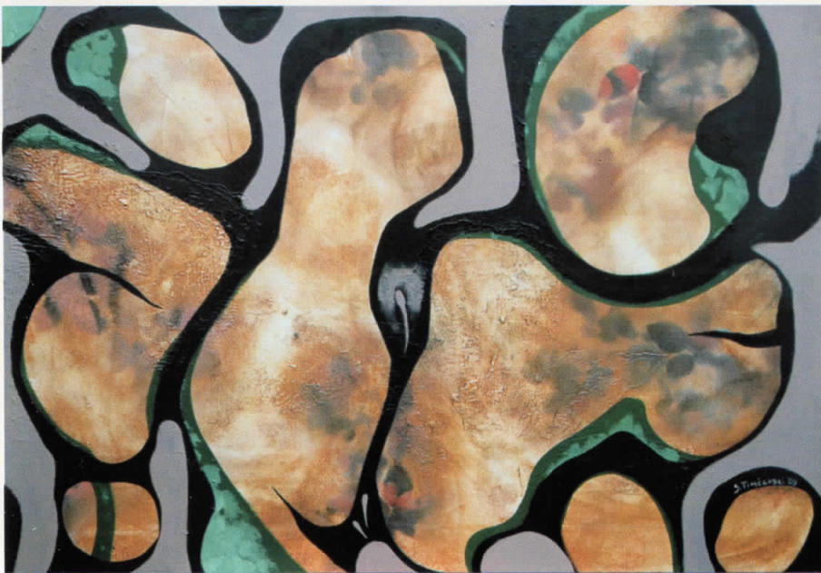
ДВОЕН ОРГАЗАМ комб.тех. 100x70 DOUBLE ORGASM mixed media 100x70