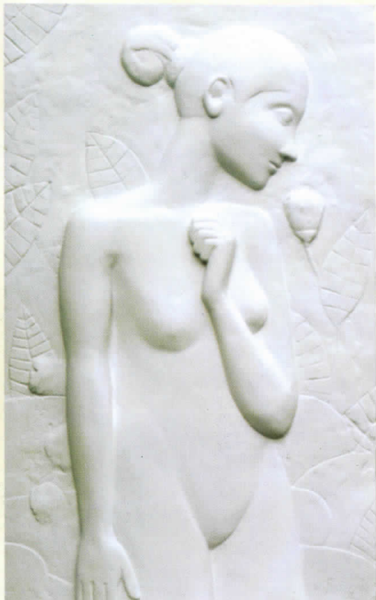
ЖЕНСКИ АКТ комб.тех. 96x60 FEMALE NUDE mixed media 96x60