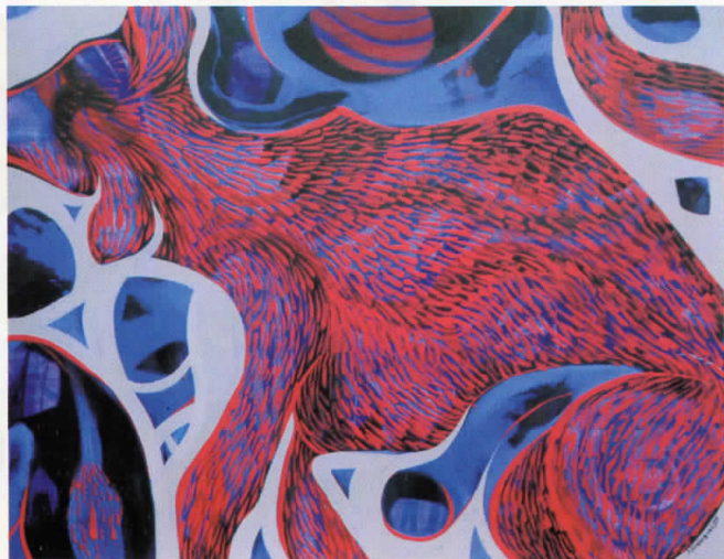
ЖИВОТИНСКИ НАГОН комб.тех. 95x75 ANIMAL INSTINCT mixed media 95x75