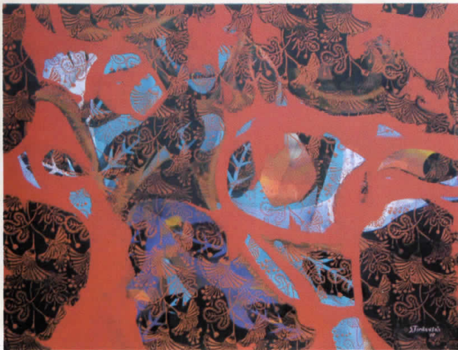
ЖЕНСКО ДРВО комб.тех. 130x100 WOMAN TREE mixed media 130x100