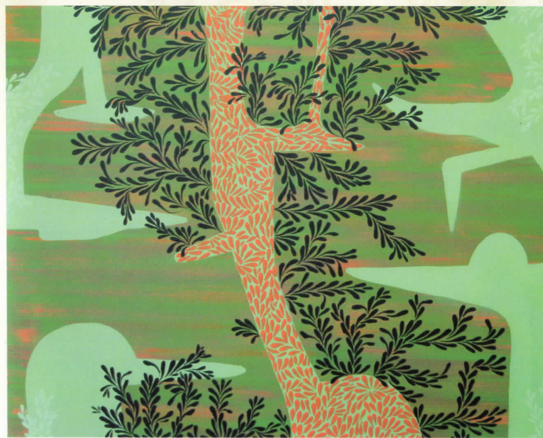
ДРВО комб.тех. 134x108