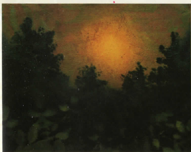
ДОЈДИ, ДОЈДИ, ЈАСНО СОНЦЕ комб.тех. 50x40 RISE, RISE, BRIGHT SUN mixed media 50x40