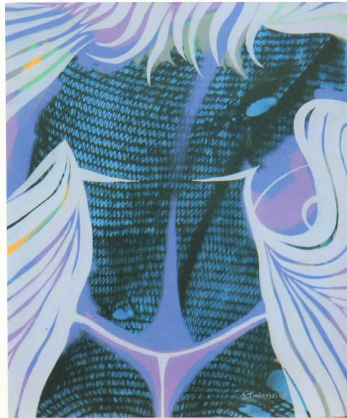
ТАНГА комб.тех.60x50 THONG mixed media 60x50