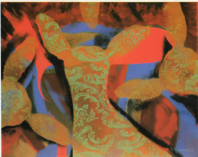
АНИМИРАЧКИ НЕПОЗНАТ ВИРУС комб.тех.

UNKNOWN ANIMATED VIRUS mixed media 82x62cm