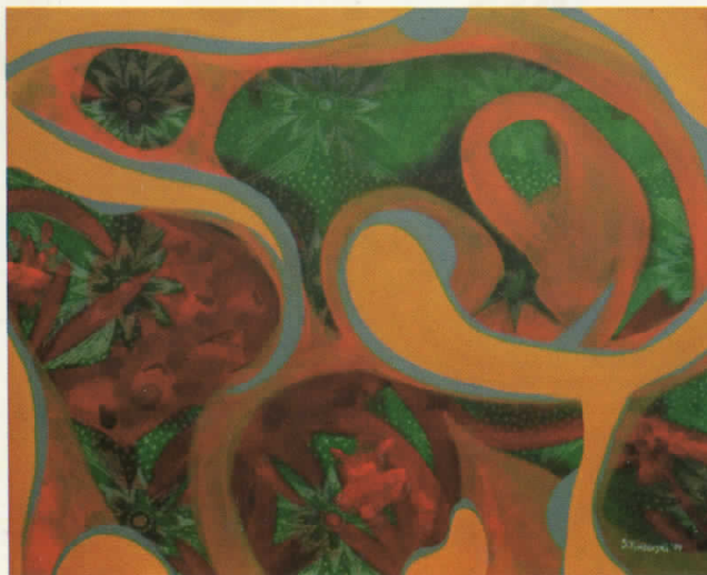
СПОКОЈ комб.тех. 80x65