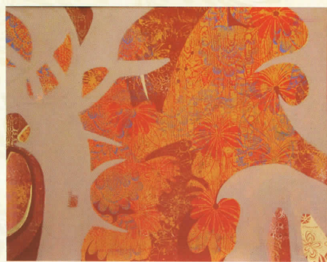
РАМНОДУШНИ комб.тех.105x81 INDIFFERENT mixed media 105x81