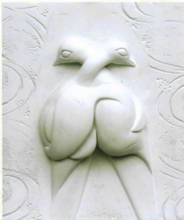
ДВЕ ТЕЛА А САМО ЕДЕН ЗАДНИК комб.тех. 42,5x35,5 TWO BODIES, ONLY ONE BUTT mixed media 42,5x35,5