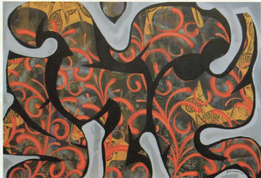
СЕРИОЗНА ВРСКА комб.тех. 100x70 SERIOUS RELATIONSHIP mixed media 100x70