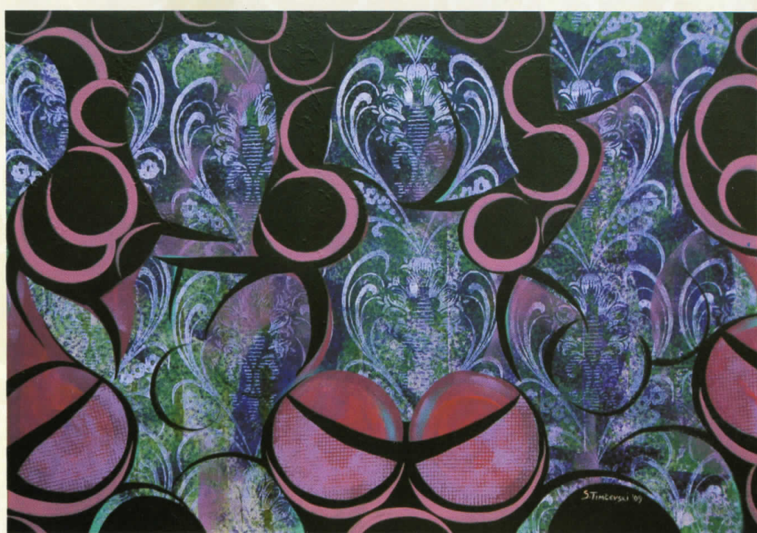
ДОЖИВУВАЊЕ ОД ПРИРОДАТА комб.тех. 70x60