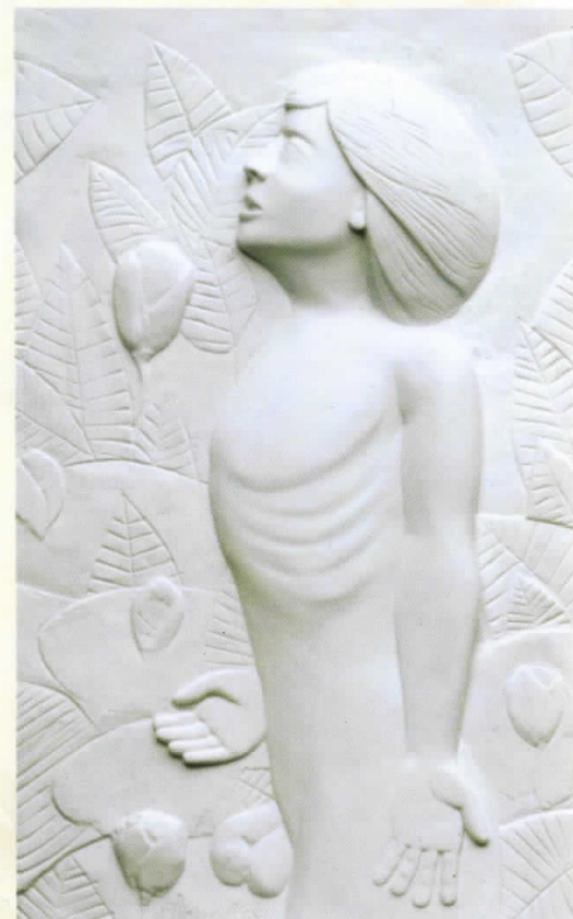
МАШКИ АКТ комб.тех. 96x60 MALE NUDE mixed media 96x60