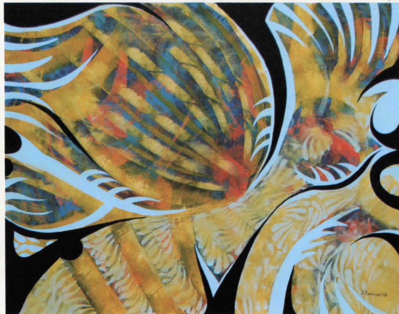
ЧУДНА ПТИЦА комб.тех. 95x75 STRANGE BIRD mixed media 95x75