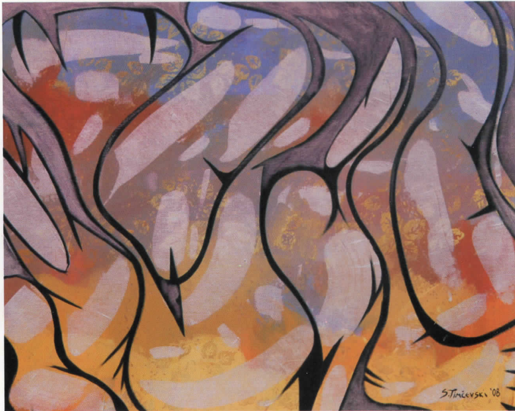
ЕСЕНСКИ ПЕЈСАЖ комб.тех. 73x60 AUTUMN LANDSCAPE mixed media 73x60