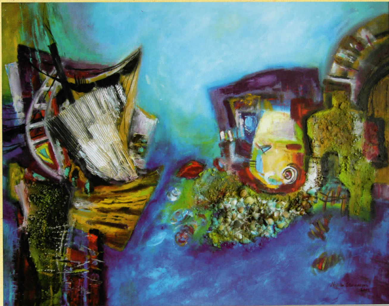
ВОЛШЕБНО ЛЕТО , масло на платно, 92 x 73 см MAGICAL SUMMER , oil on canvas