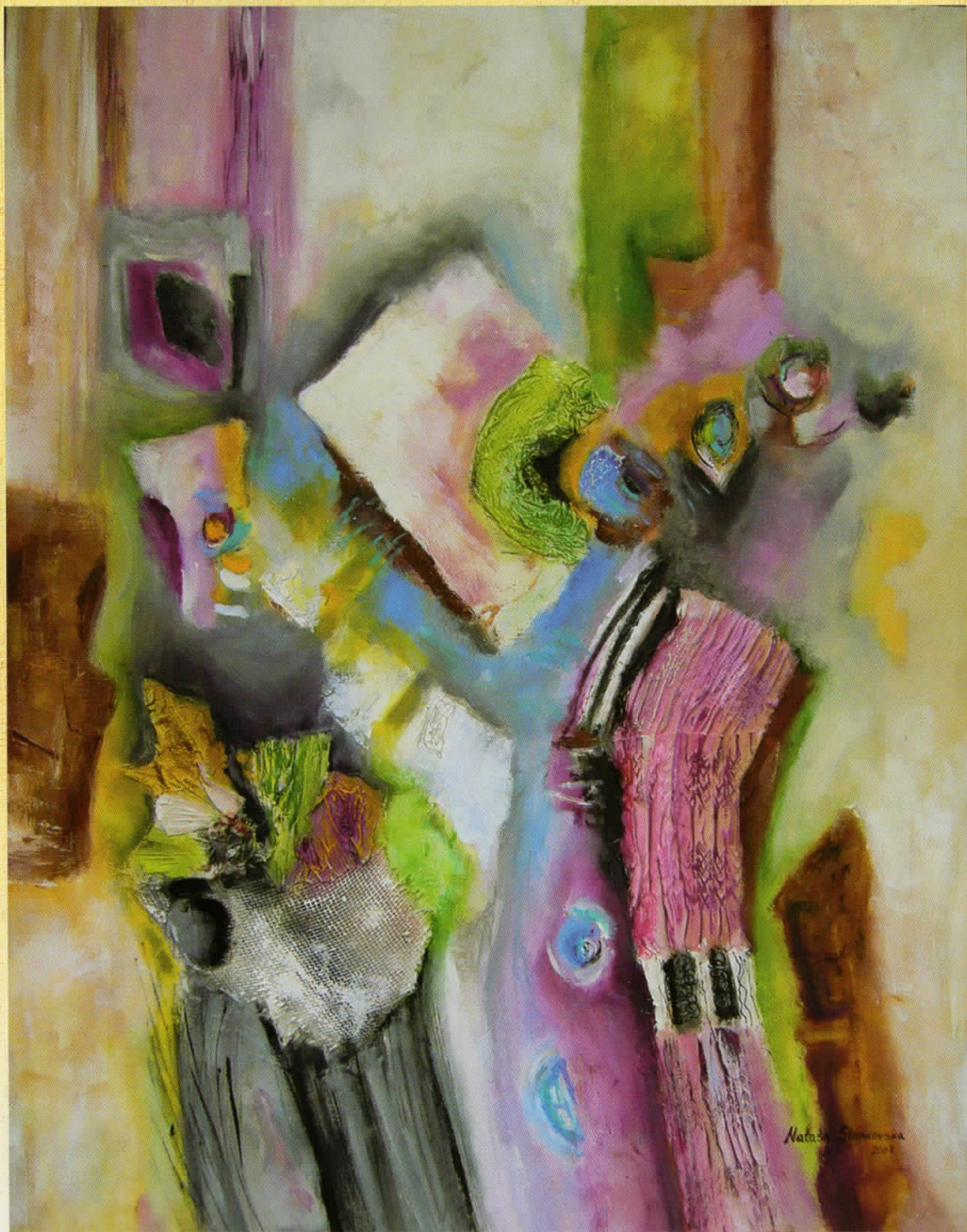
РАПСОДИЈА ВО РОЗЕ, масло на платно, 80 x 100 см PINK RHAPSODY, oil on canvas