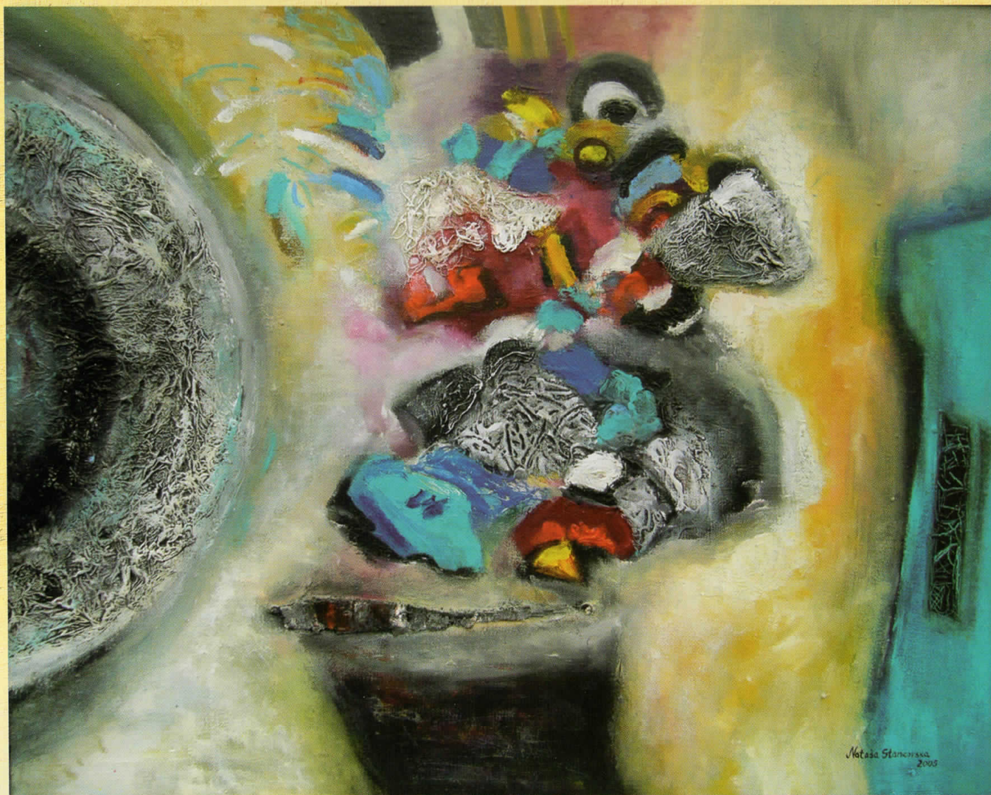
ПЛОДОВИ НА ЕСЕНТА, масло на платно, 92 x 73 см THE FRUITS OF FALL, oli on canvas