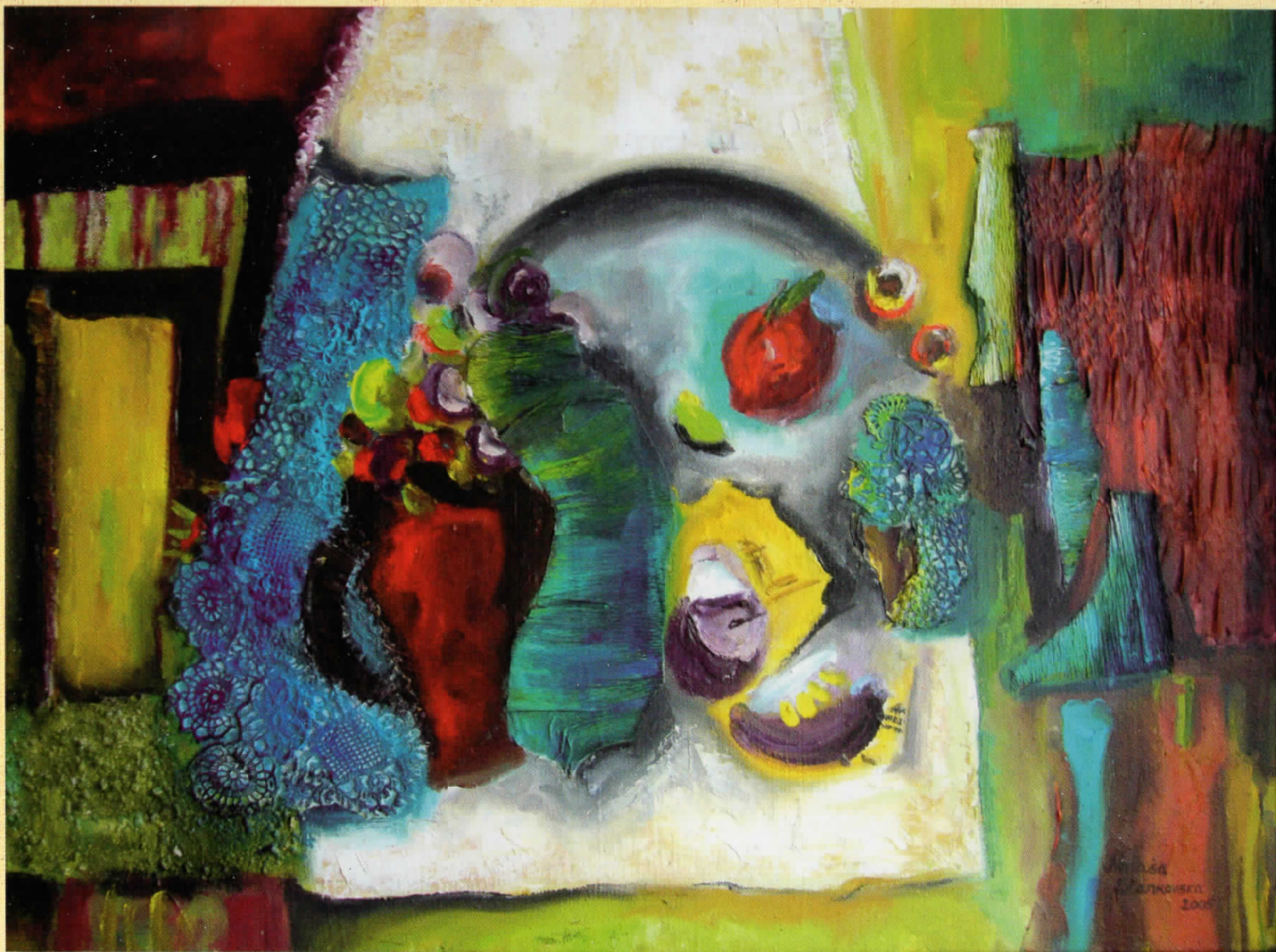
ВКУСОТ НА ОВОШЈЕТО, масло на платно, 60 x 80 см THE TASTE OF FRUIT, oil on canvas