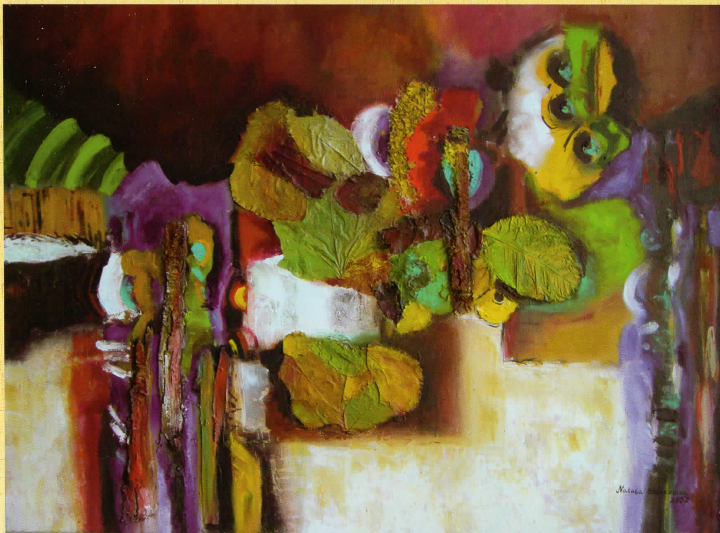
ПОЛНОЌЕН СОЊ, масло на платно, 60 x 80 см MIDNIGHTS DREAM, oil on canvas