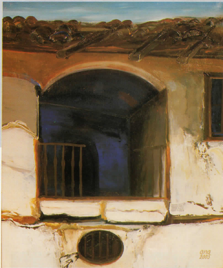
ПРАЗНИНА, масло на платно, 65x54, 2005, сопственост на Ликовната колонија, Струмица

EMPTINESS, oil on canvas, 65x 54 ,2005 owned by Strumica Art colony.