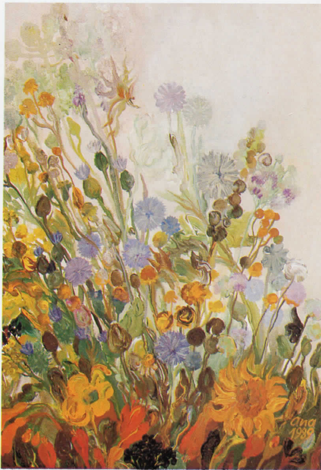
СОФИЛАРСКО ЦВЕЌЕ, масло на платно, 55,5x39,5, 1989, сопственост на Томе Босиљанов