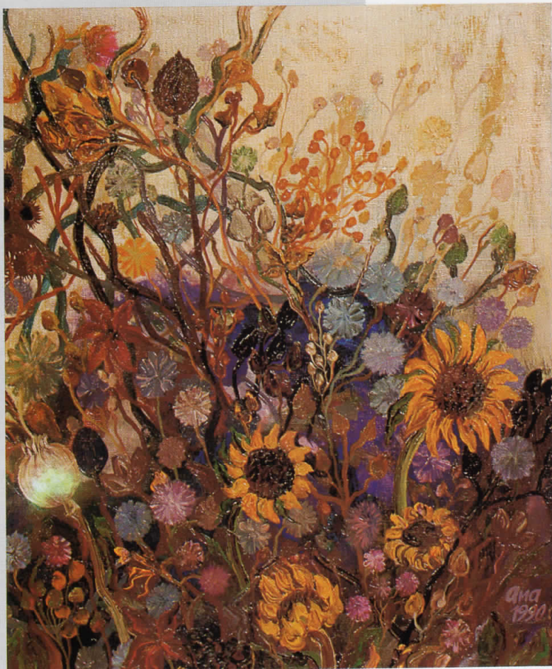
ЦВЕТОВИ, масло на платно, 60 x 50, 1990, сопственост на Саветка и Кољо Шумарови