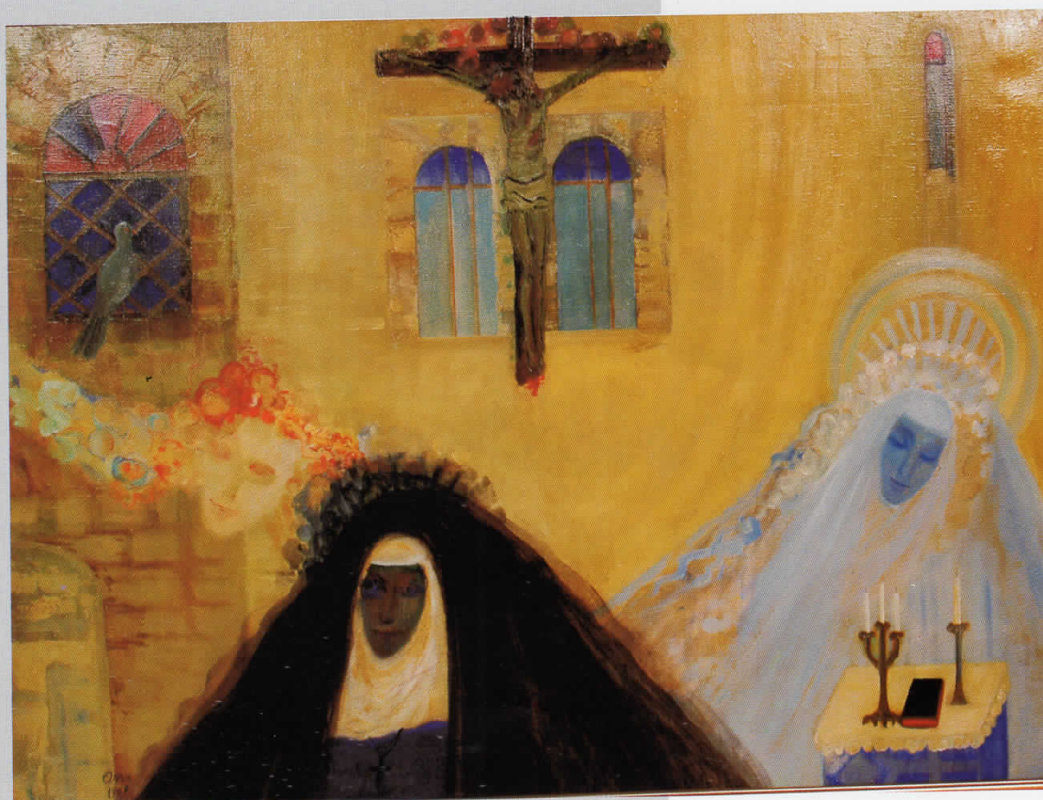
КАЛУЃЕРКА, масло на платно, 135 x 107, 1969, сопственост на Ликовната колонија, Струмица

BURNT HOUSE, oil on canvas, 120 x 160, 1968 owned by Museum of Contemporary art , Skopje.