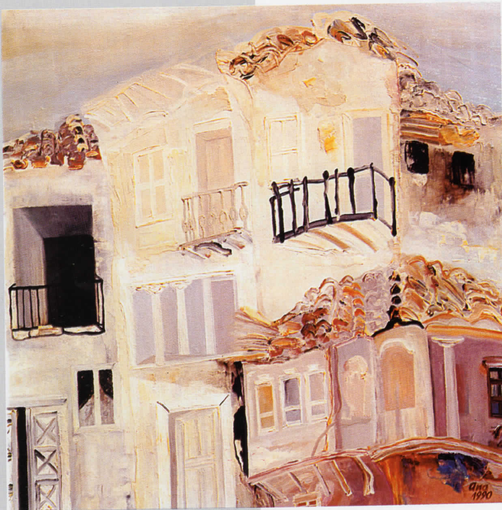
БЕЛИ СИДОВИ масло на платно, 100x100, 1990, сопственост на Ликовната колонија, Струмица

FORGOTTEN ANGLE, oil on canvas, 43 x 69, 2006, owned by the artist.