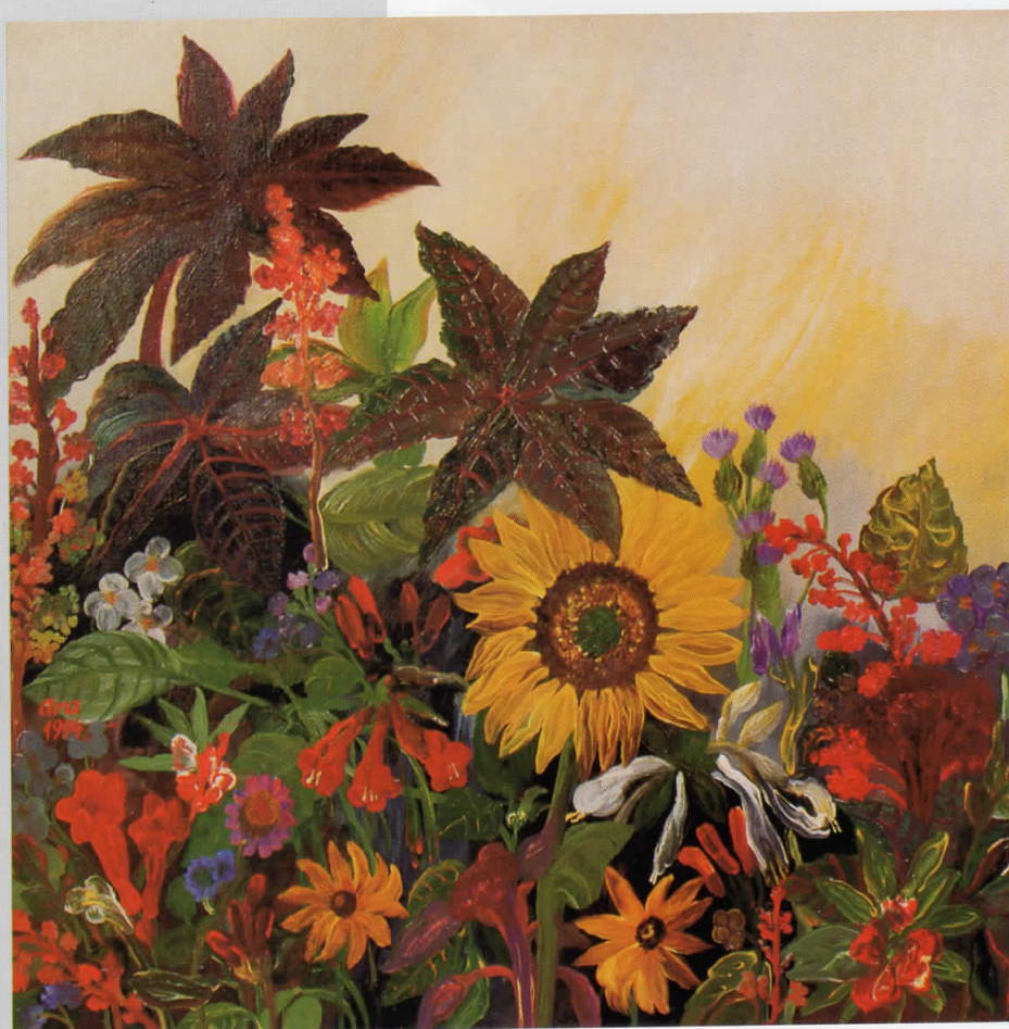
СТРУМИЧКО ЛЕТО, масло на платно, 80 x 80, 1994, сопственост на Ликовната колонија, Струмица