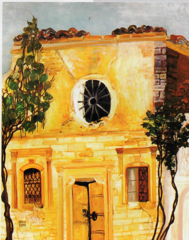
КУЌАТА НА КАМИЛАРОВИ, масло на платно, 100x80, 1994, сопственост на Ликовната колонија, Струмица

KUMANOVO FACADES, oil on canvas, 80 x 100, 1994, owned by Kumanovo Art colony.