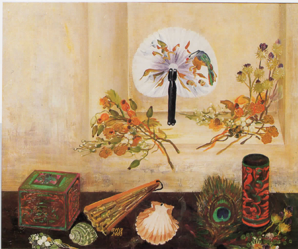
МРТВА ПРИРОДА СО ЛАДАЛО, масло на платно, 50x60, 2003, сопственост на Ликовната колонија, Струмица

STILL LIFE WITH A FAN, oil on canvas, 50 x 60, 2003, owned by Strumica Art colony.