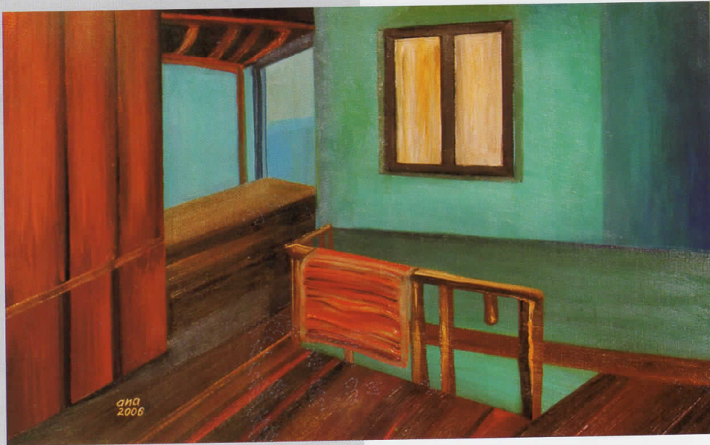
ЗАБОРАВЕН АГОЛ, масло на платно, 43x69, 2006, сопственост на авторката

FORGOTTEN ANGLE, oil on canvas, 43 x 69, 2006, owned by the artist.