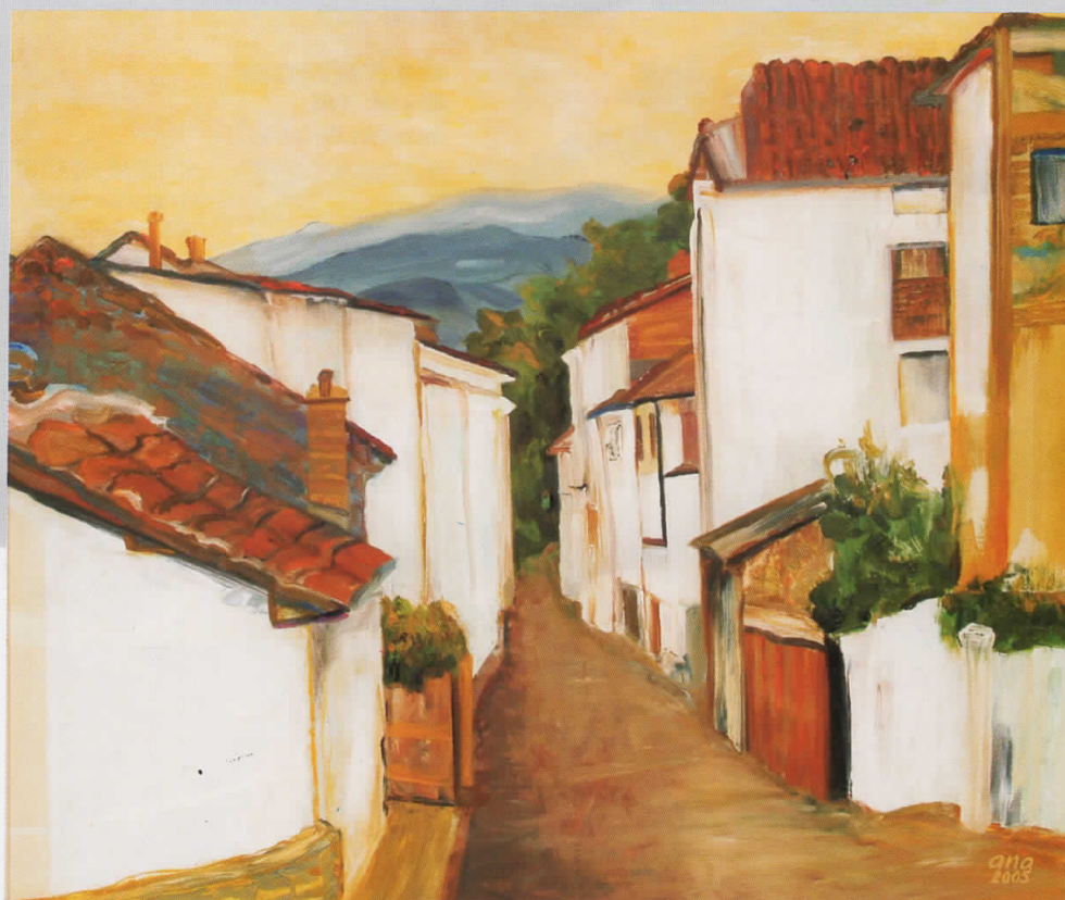
МАЛА УЛИЦА, масло на платно, 81x100, 2005, сопственост на Ликовната колонија, Струмица

STILL LIFE WITH A FAN, oil on canvas, 50 x 60, 2003, owned by Strumica Art colony.