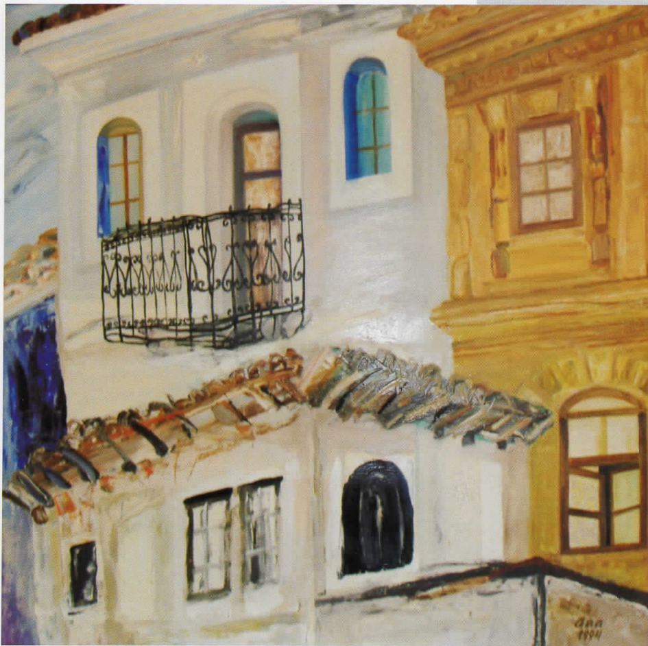
КУМАНОВСКИ ФАСАДИ, масло на платно, 80 x 100, 1994, сопственост на Ликовната колонија, Куманово

KUMANOVO FACADES, oil on canvas, 80 x 100, 1994, owned by Kumanovo Art colony.