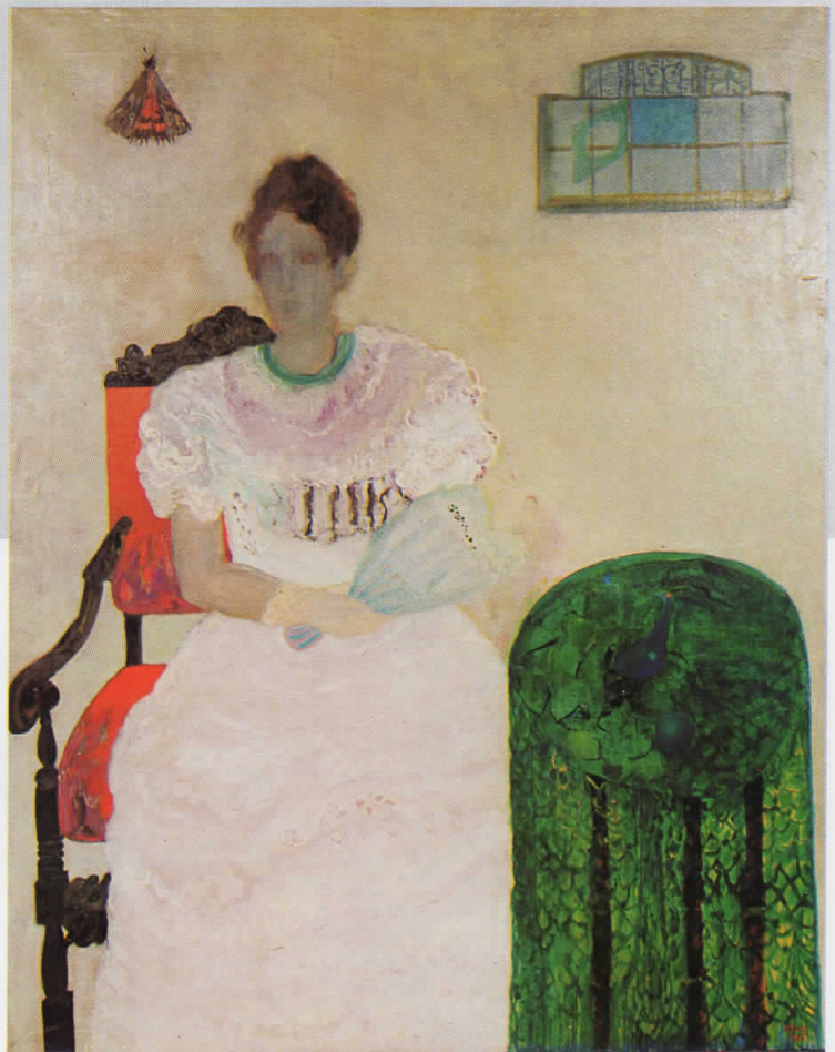
LADY WITH FAN, oil on canvas, 150 x 118, 1968, owned by Museum of Contemporary art , Skopje.