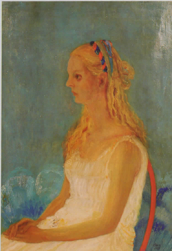
НЕНА, масло на платно, 101x79 , 1968, сопственост на авторката