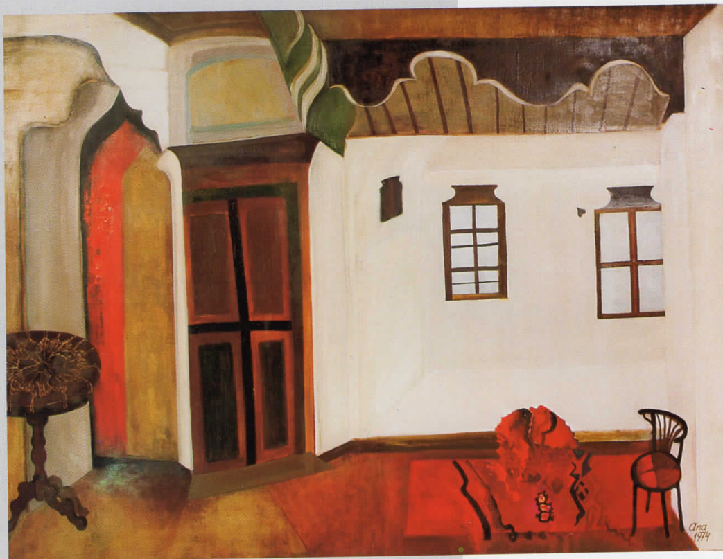
ИЗГОРЕНА КУЌА, масло на платно, 120x160, 1968 сопственост на во МСУ, Скопје

BURNT HOUSE, oil on canvas, 120 x 160, 1968 owned by Museum of Contemporary art , Skopje.