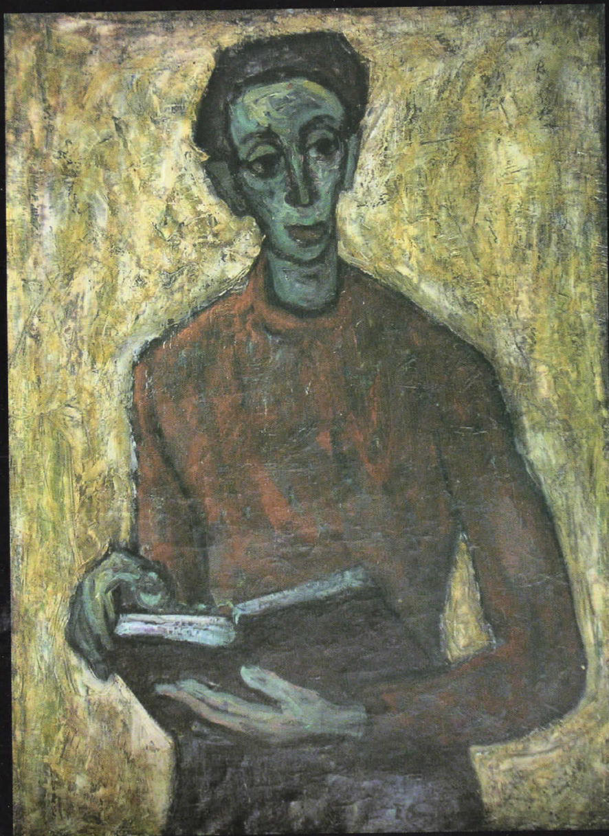
Пецо Видимче, Портрет, 1953, масло на платно, дим: 100x73см.