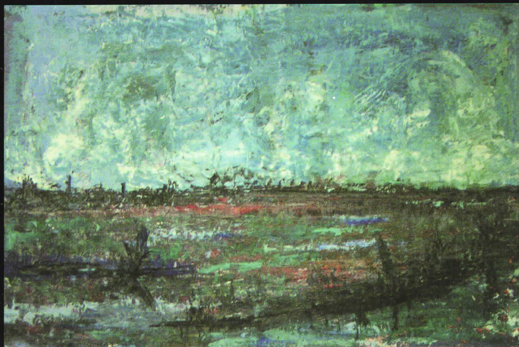
Перо Спироски, Мочуриште, 1974, масло на платно дим: 50х62см