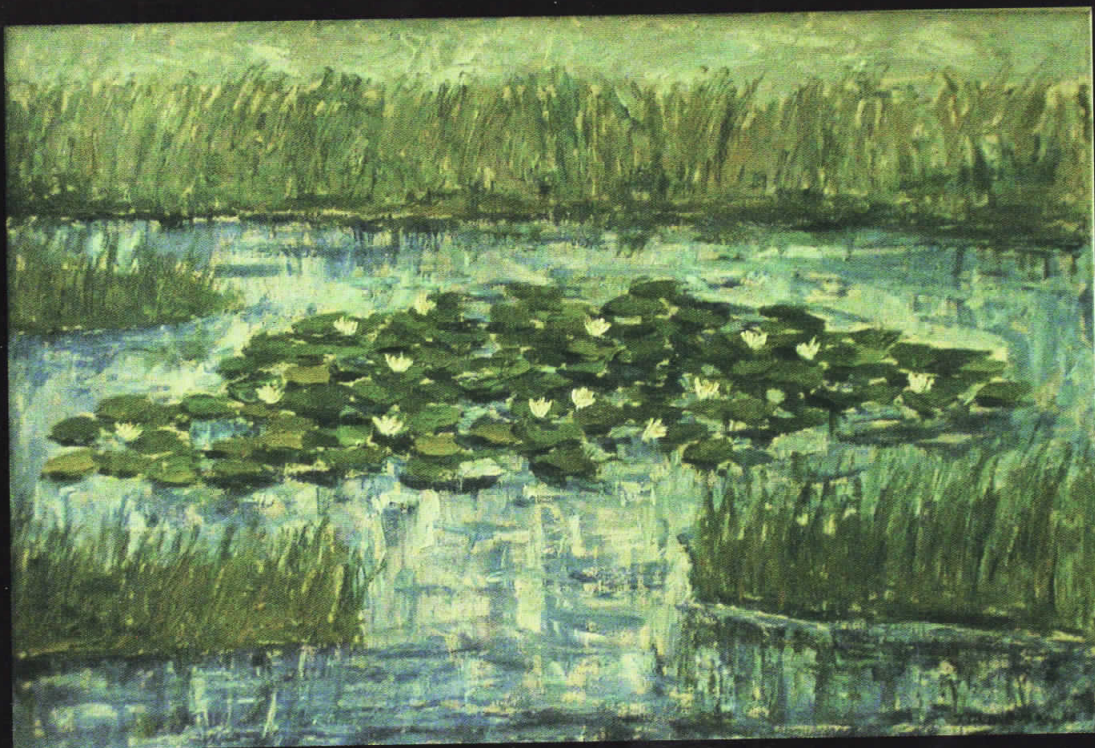
Јован Димовски, Локвани, 1956, масло на платно, дим: 64x94см.