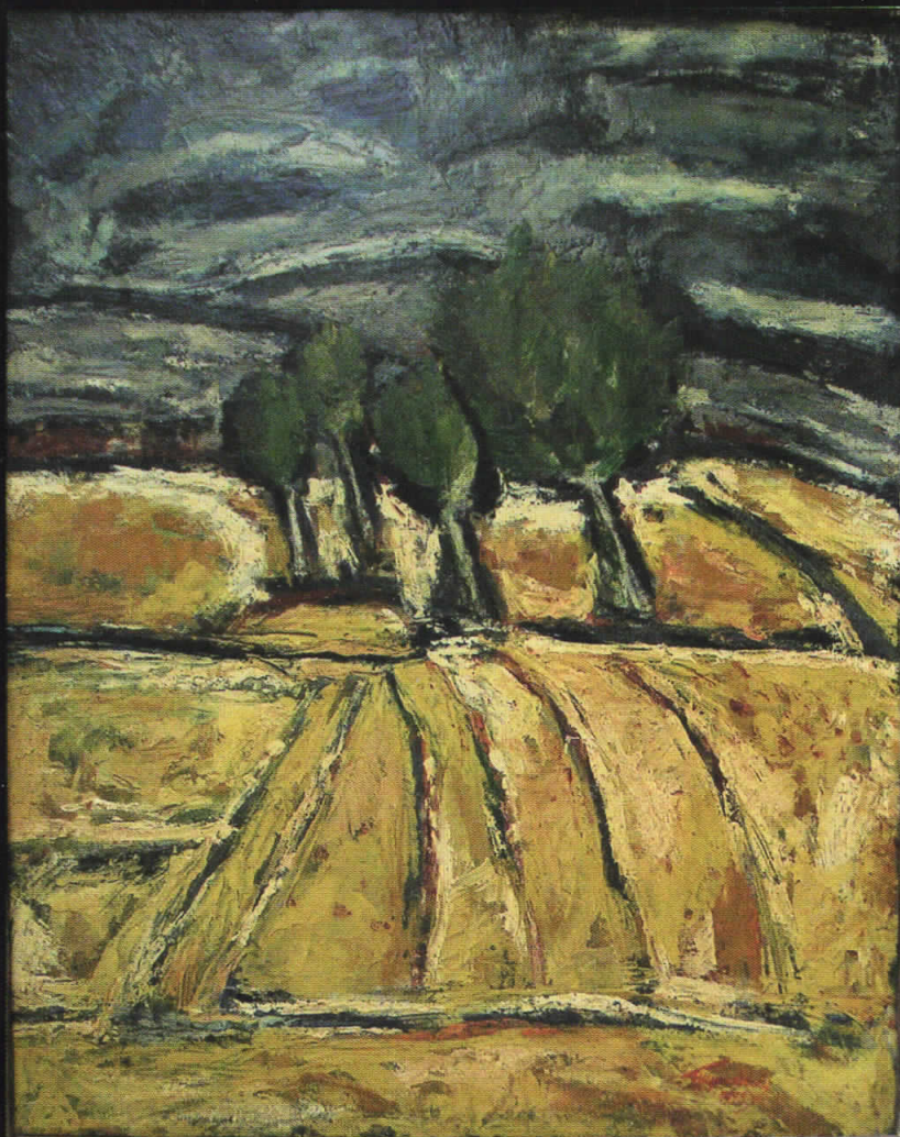
Борислав Траиковски, Пејзаж, 1973, масло на платно, дим: 100x80см.