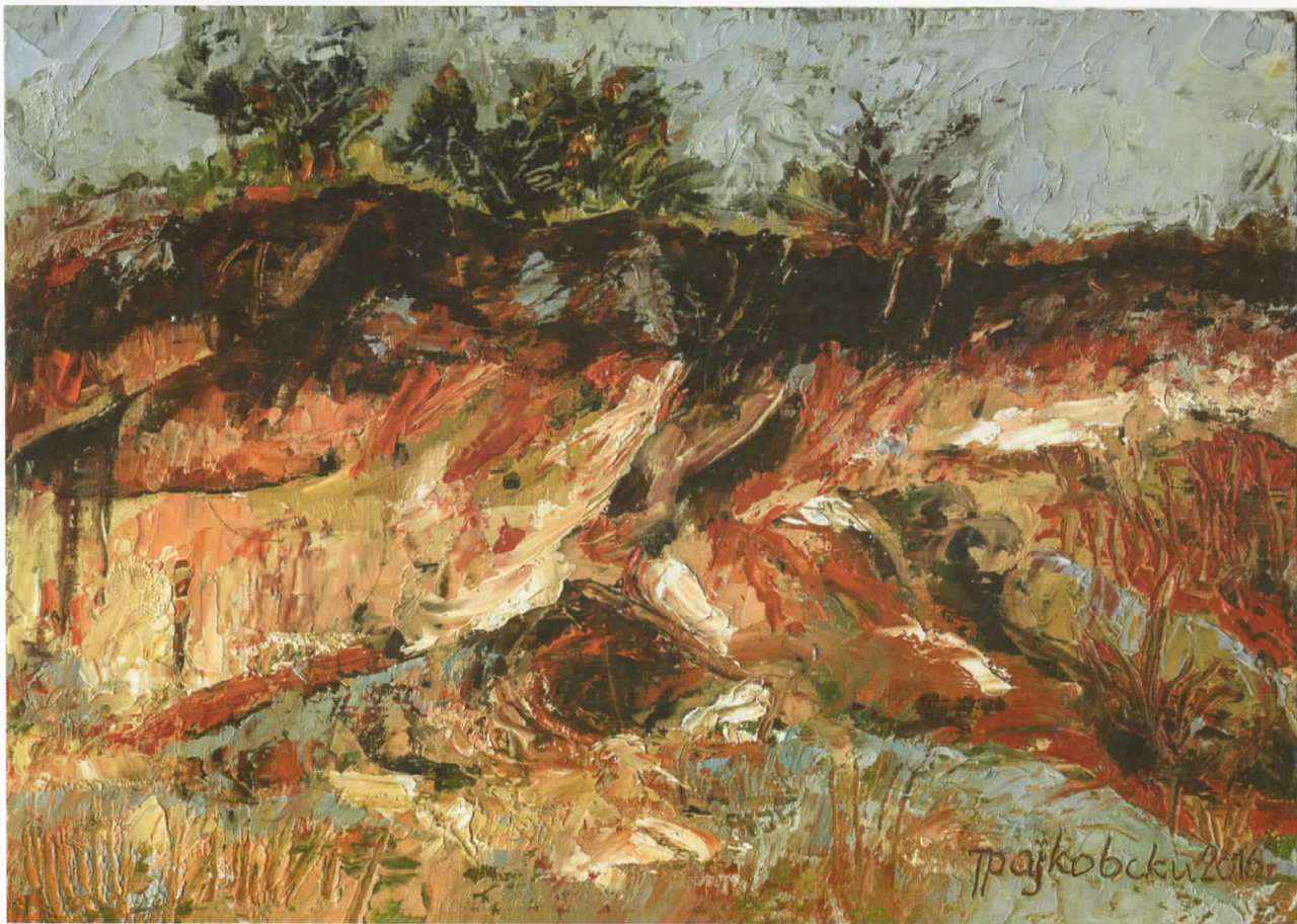
Брег, масло на картон, 23x16, 2016