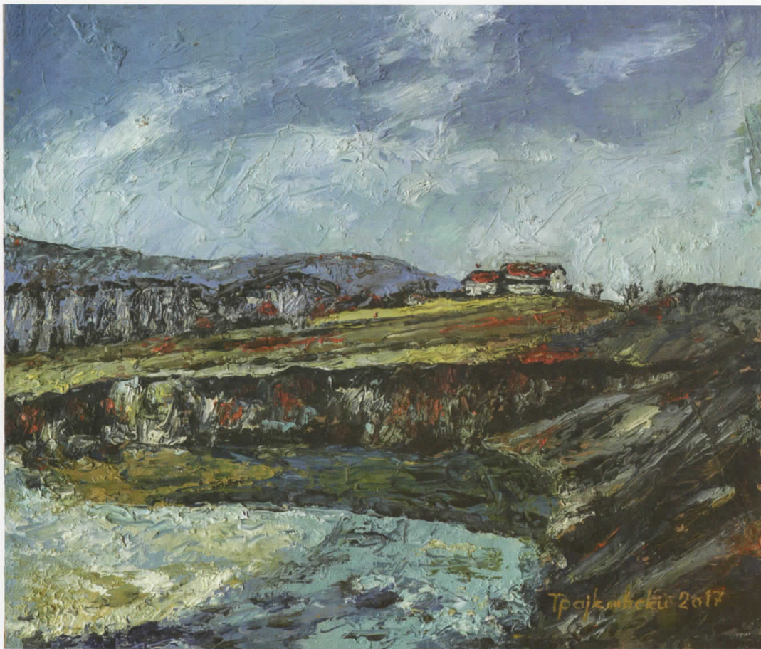
Макреш, масло на панел, 24x21, 2017