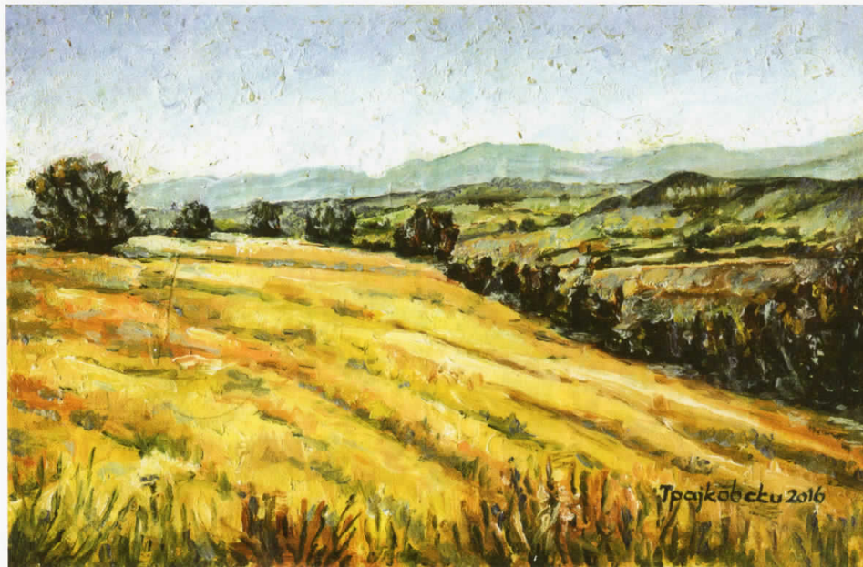
Јачинце, масло на картон, 23x15, 2016

НАЦИОНАЛНА УСТАНОВА - ЦЕНТАР ЗА КУЛТУРА "ТРАЈКО ПРОКОПИЈЕВ" - КУМАНОВО