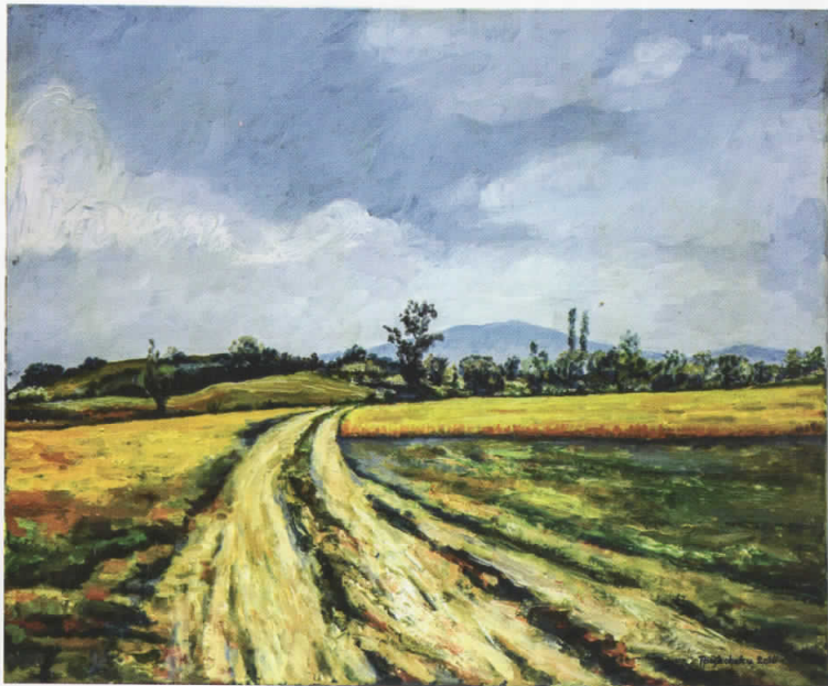
Вршнице, масло на платно, 60x50, 2016