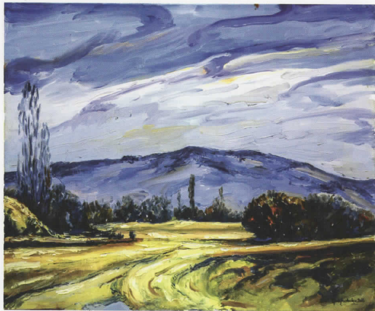
Градиште, масло на платно, 60x50, 2016