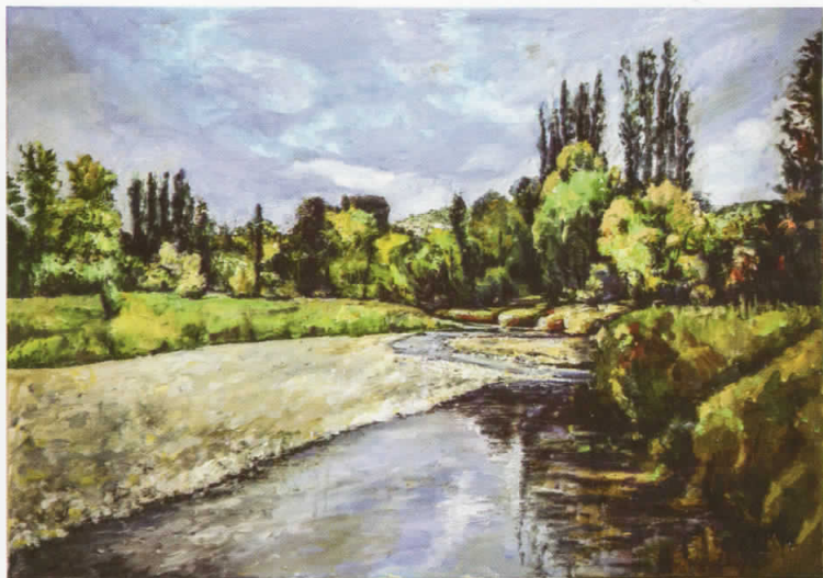
Петрошница, масло на платно, 100x70, 2018