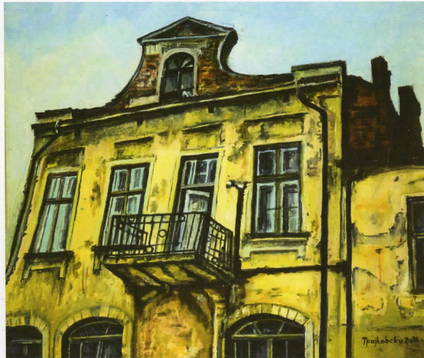
Пешеви, масло на платно, 60x50, 2018

издавач: НУЦК "Трајко Прокопиев" - Куманово за издавачој: Сашо Тодоровски орѓанизација: Роберт Цвејковски и м-р Зоран Арсовски - Бабаџа шексти: Роберт Цвејковски, фотографи: м-р Зоран Арсовски - Бабаџа дизајн, сkenови и компјутерска обработка: Саша Арсовски печатил: АРТ ПРИНТ СТУДИО - Скопје тираж: 300, година 2018