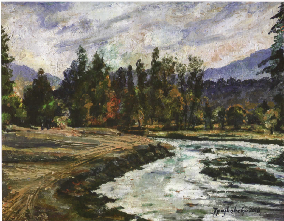
Пелинце 1, масло на панел, 28x21, 2016