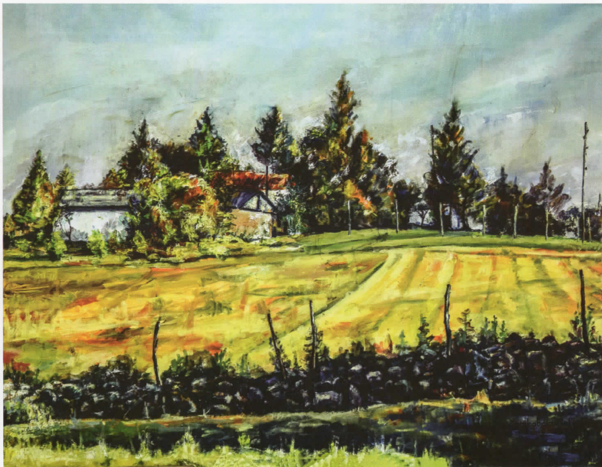
Црква, масло на платно, 90x70, 2017