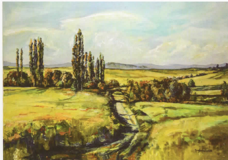
Новоселски пат, масло на платно, 100x70, 2018