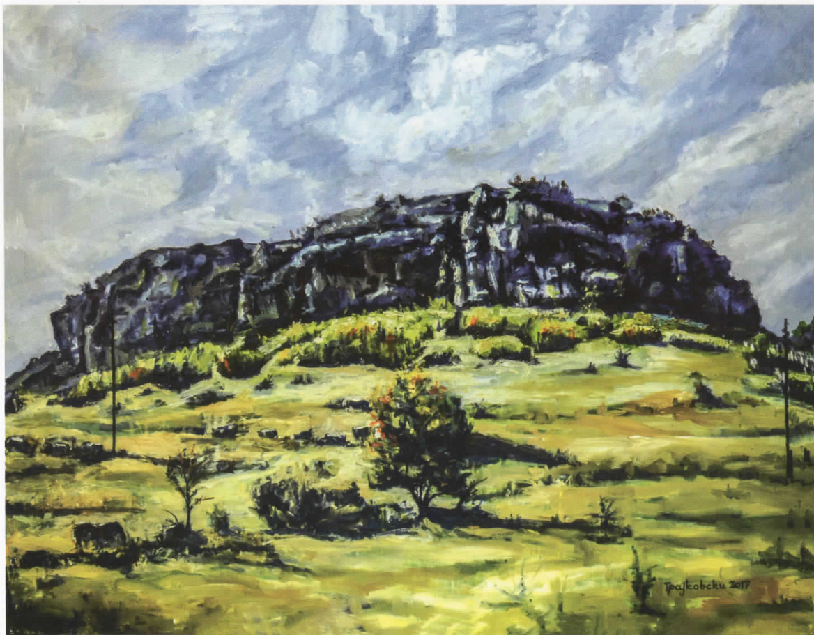
Костоперска карпа, масло на платно, 90x70, 2017