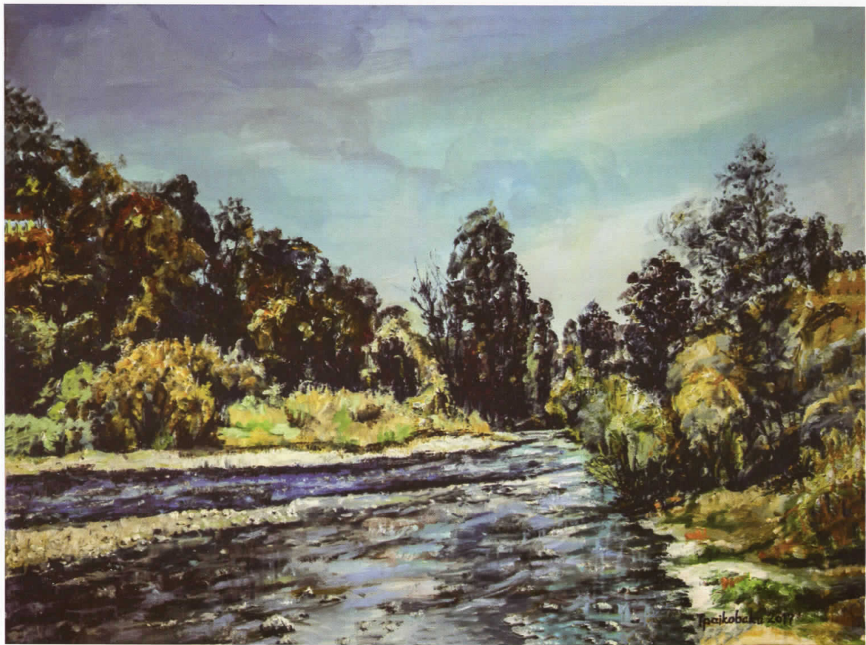
Пелинце 3, масло на платно, 60x80, 2017