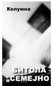
( http://www.publikum.mk/category/semejno/ )