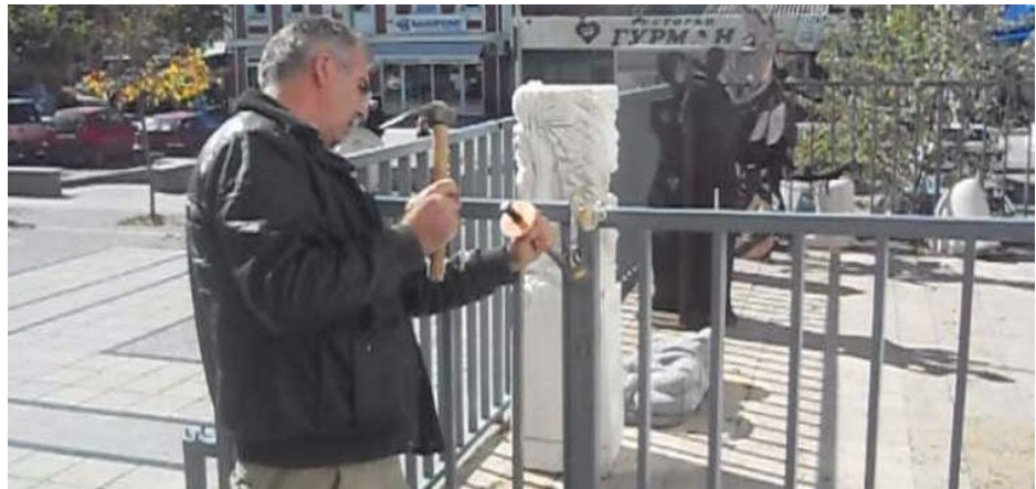
( http://www.publikum.mk/nasilno-iselen-tsentarot-za-sovremena-likovna-umetnost-od-prilep/ )