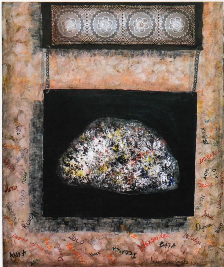
Ставена на проценка, акрил на платно, 2012