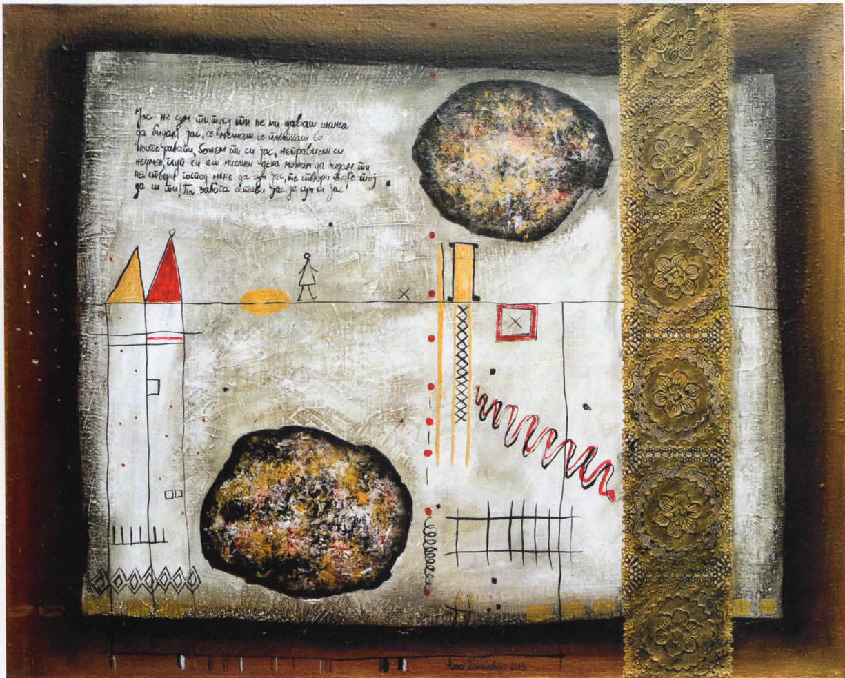
На растојание од мене, акрил на платно, 2013