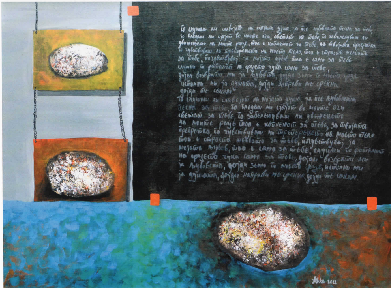
Порака, акрил на платно, 2012