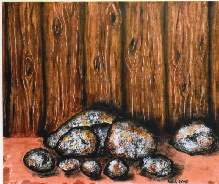
Собир, акрил на платно, 2012