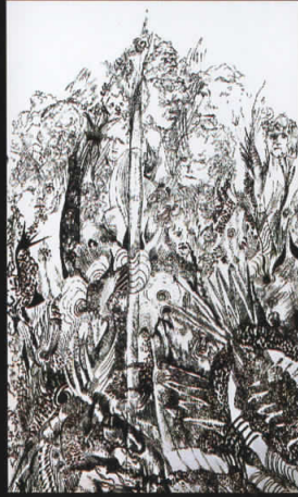
“Случаен собир” туш