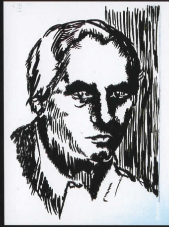
“Автопортрет 1978” туш