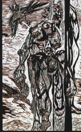
“Столб на хероитеа” линорез