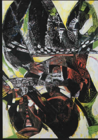
“Просторни движења” комб. тех.