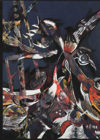
“Полно гнездо” комб. тех.