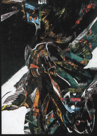
“Волшебна појава” комб. тех.