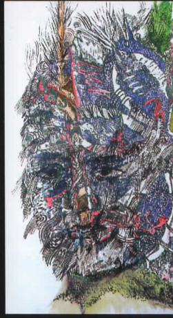
“Портрет во размисла” комб. тех.