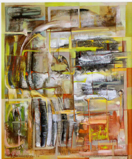
"Празникот на создавањето" - 100x81cm