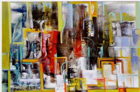
"Урбан I" - 60x91см