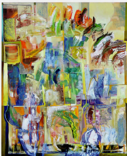
"Раѓање на утрото" - 100x81см