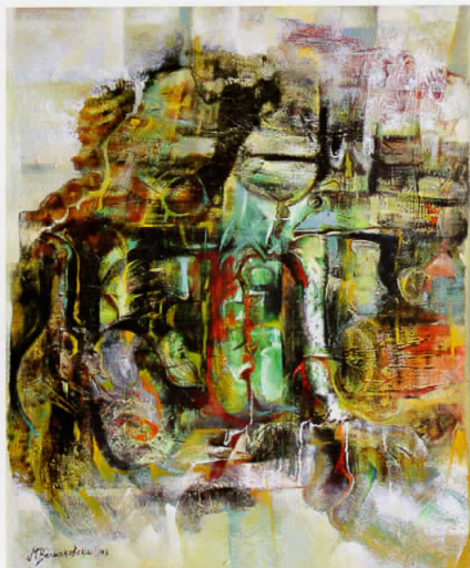
"Totem" - 73x89cm