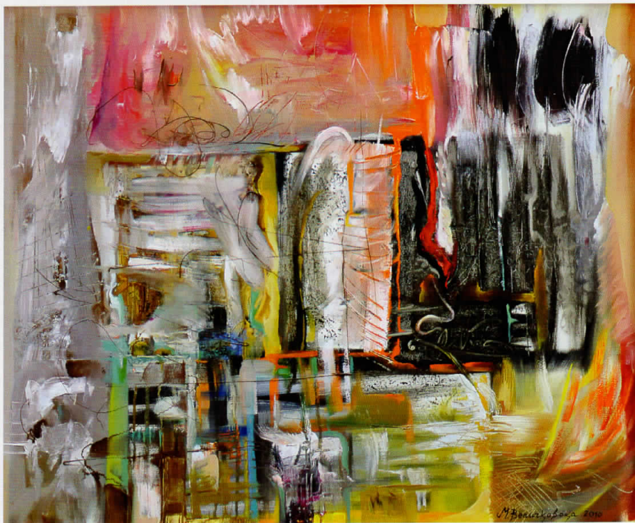
"Фосил" - масло на платно, 89x74см