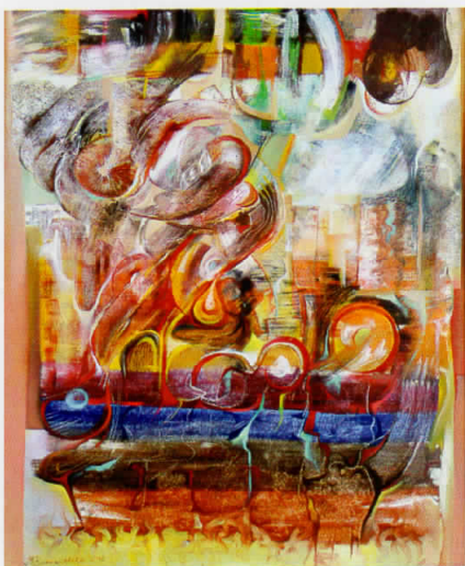
"Life" - 100x81cm