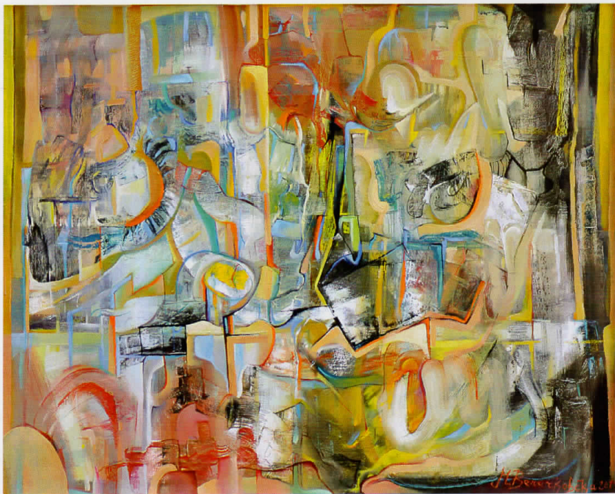
"Dreams" - 100x81cm