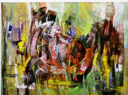
"Арка" - 61x81см