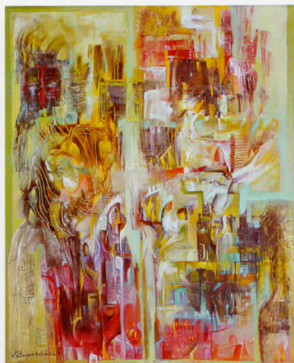
"Супериорност" - 100x81cm