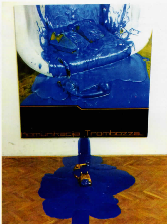
Комуникација тромбоза, 2010 airbrush, 200 x 200 цм