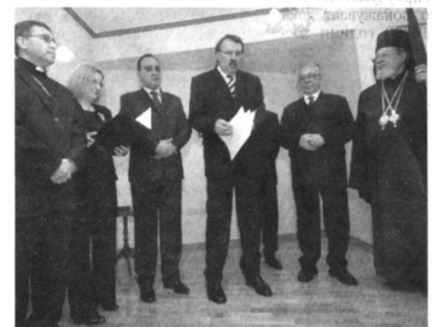
Бистата на Тарас Шевченко во паркот „Жена борец“ во центарот на Скопје (горе); од свеченоста одржана во амбасадата на Украина

лов, навраќајќи се на континуираната соработка со Академијата на Украина. Доделеното високо признание го смета за