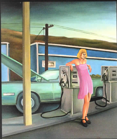
"Авантуристички доживувања" 110x90, масло на платно, 2006