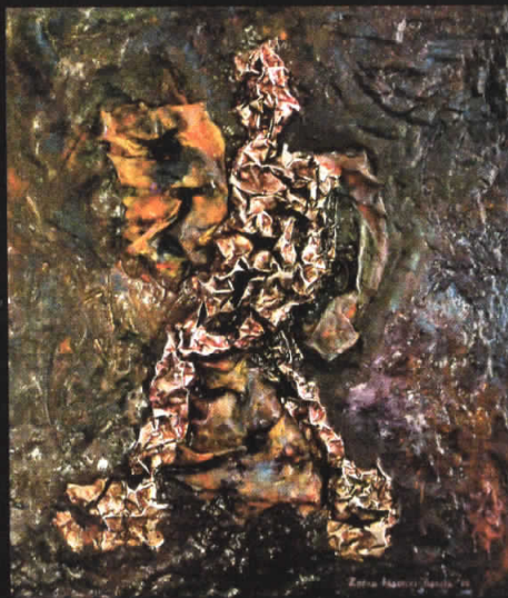
“Освојувач” 50x43, комбинирана техника, 2008