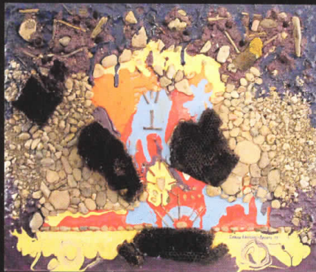
“Тврдини на спокојот” 47x55, комбинирана техника, 2009