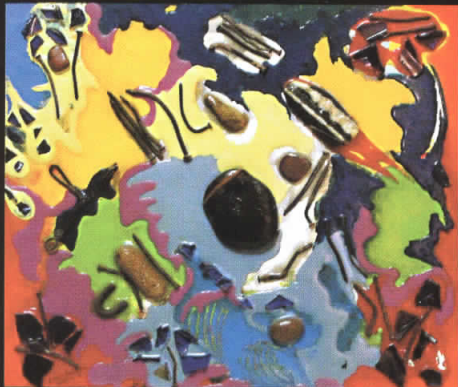
“Записи I” 40x46, комбинирана техника, 2008