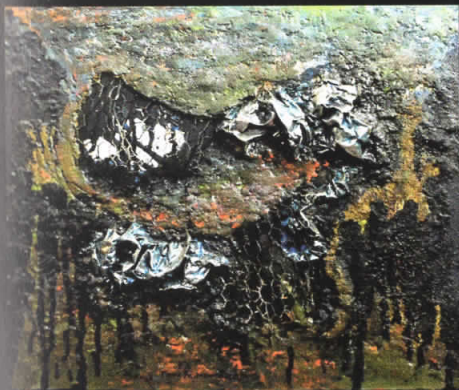
“Централа” 43x50, комбинирана техника, 2008