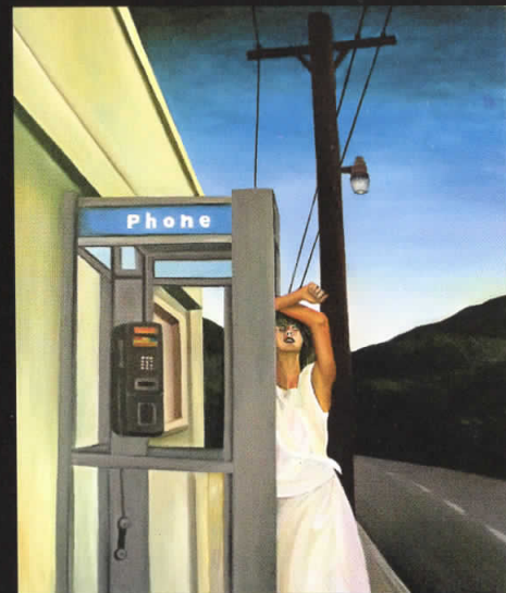
"Краток одговор" 110x90, масло на платно, 2006