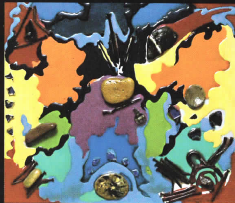
“Записи II” 40x46, комбинирана техника, 2008