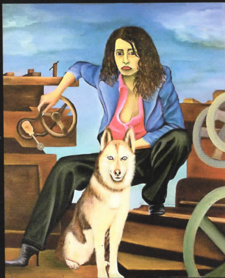
"Заедно" 110x90, масло на платно, 2006