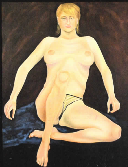
“Јуле” 110x83, масло на платно, 2005