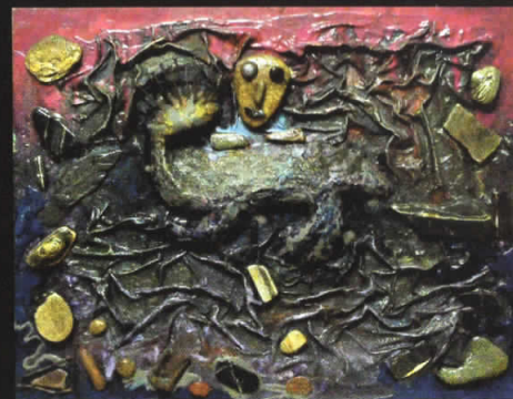
“Полноќен набљудувач” 50x63, комбинирана техника, 2008