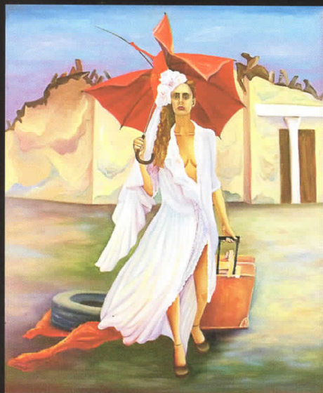
“Бегство” 110x90, масло на платно, 2007