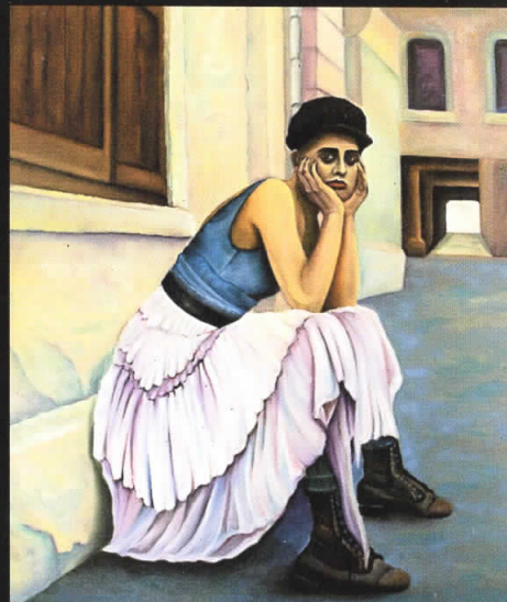
“Меланхолија во населбата” 110x90, масло на платно, 2007