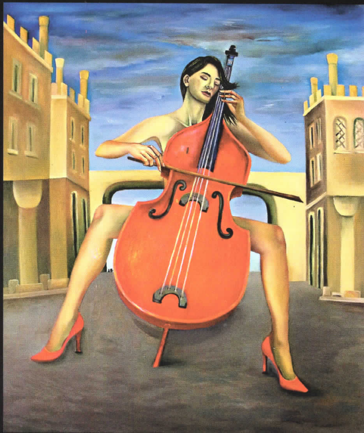
"Кругот на мистичните звуци" 110x90, масло на платно, 2007

Живее и работи во Куманово. Адреса: ул. "Димитрие Туцовиќ" бр.5, Куманово E-mail: zoranars@gmail.com