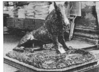
Дел од најпознатите скулптури на леарницата „Фондерија артистика Фердинандо Маринели“: Ајзенхауер во Лондон (горе лево), вепар за Градскиот совет во Фиренца (долу лево) и коњаник за фонтаната во Денвер

спомен-обележја. Според документот, трошоците за чување, заштитата и одржување на спомен-обележјата, Општината ќе ги обезбедува од својот и од државниот буџет.