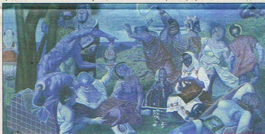
Повеќето од авторите ќе изложат дела работени во нови медиуми, но присутни се и традиционални техники