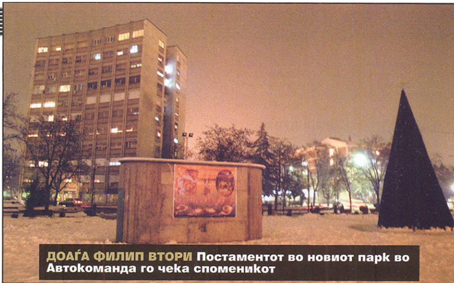
ДОАГА ФИЛИП ВТОРИ Постаментот во новиот парк во Автокоманда го чека споменикот

се прави во Фиренца иако, како што велат уметниците, тоа таму чини три до четири пати поскапо отколку во Софија, Белград или Загреб, каде најчесто досега и се носеле скулптурите на лиење. За тоа кои уметници (ке) ги изработуваат спомениците, никој не сака отворено да одговори и институциите си ја префрлаат надлежноста едни на други. Она што се зборува е дека неколку уметници победиле на отворените конкурси. Така, изработката на централната и најголема скулптура на Александар Македонски, двете скулптури на Филип и Триумфалната капија ќе ги работи млада уметничка, велат блиска до власта. Изработката на останатите скулптури во центарот на градот е доверена на уште тројца други автори.