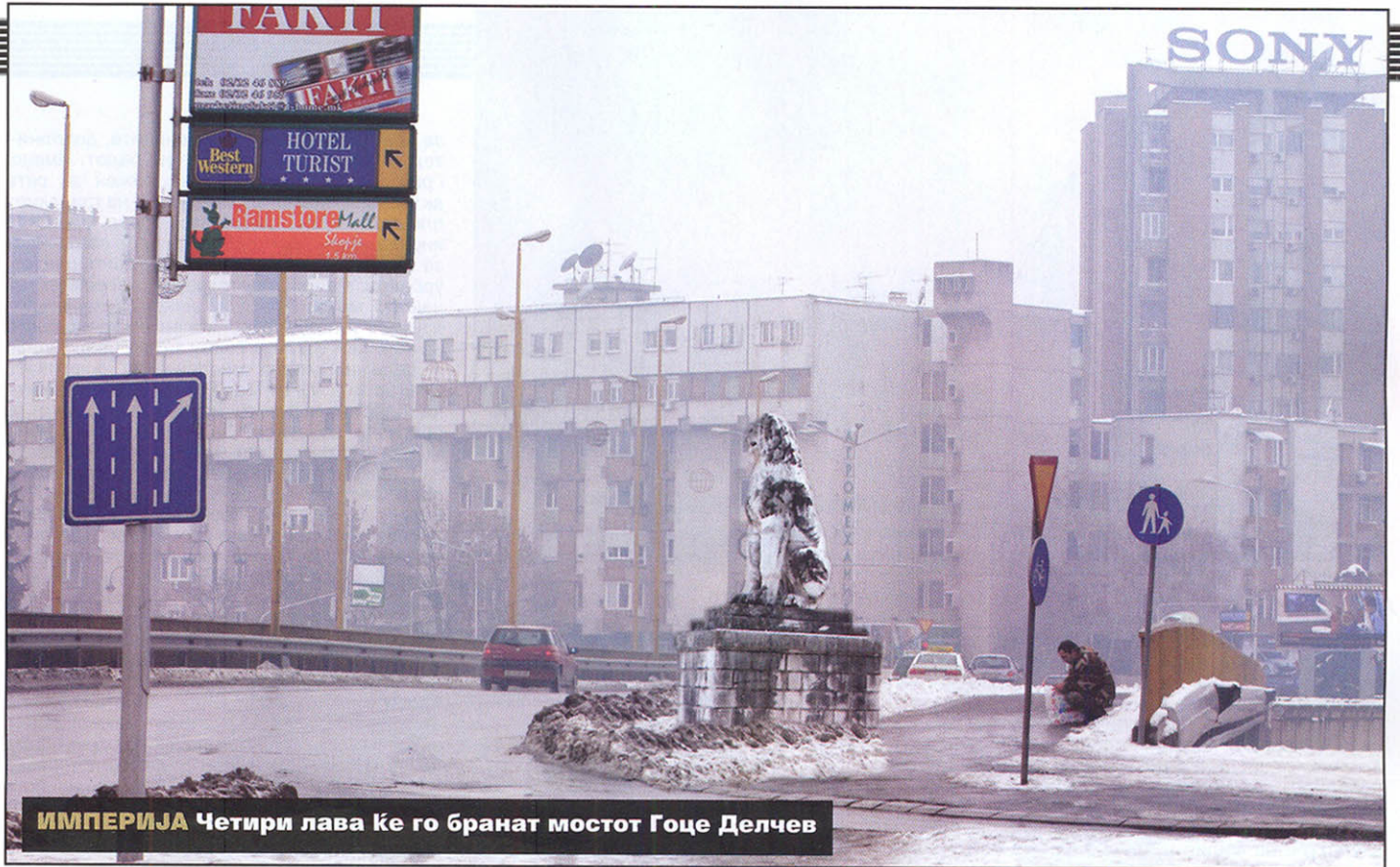
ИМПЕРИЈА Четири лава ќе го бранат мостот Гоце Делчев

вклопи во околината, особено по изградбата на домот музеј на Мајка Тереза, веднаш пред Домот на АРМ, навистина е тешко да се претпостави. Всушност, ако се имаат предвид и градителските проекти и амбиции на Владата, најавената црква на плоштадот, зградата на стариот театар преку мостот, градската куќа налик на стариот Офицерски дом итн., мостот што ќе го поврзува Трговскиот центар со Македонскиот народен театар, за кој од општината за годинава се одвоени 300.000 евра, во центарот на градот ќе се добие вистинска врваница од