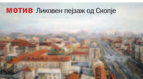
МОТИВ Ликовен пејзаж од Скопје