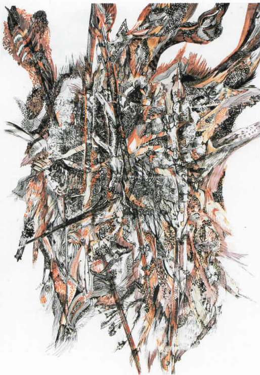
ЧУДЕН СВЕТ - ПРЕОБРАЗБА I" туш во боја