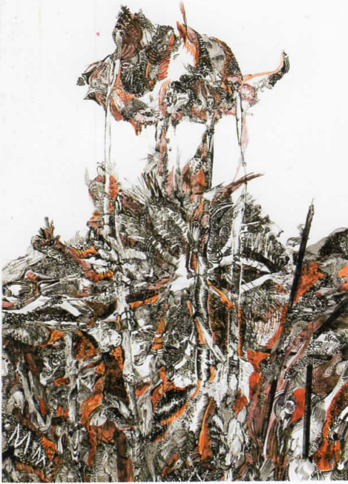
ЧУДЕН СВЕТ - ПРЕОБРАЗБА " туш во боја