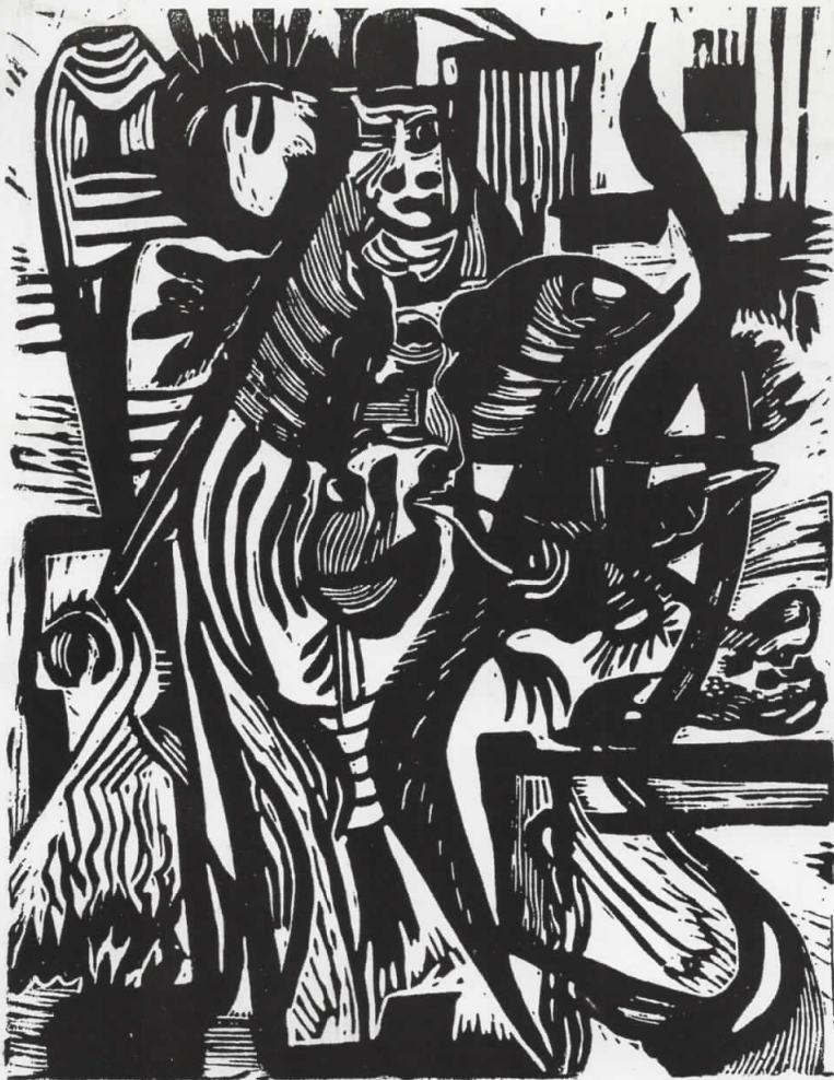
"КРИЛАТИ ЈАВАЧ" линорез