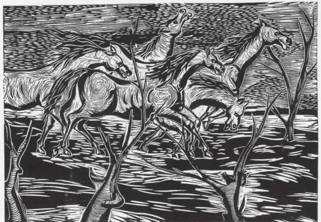
"ЖЕД" линорез гравура

Министерство за култура на Република Македонија