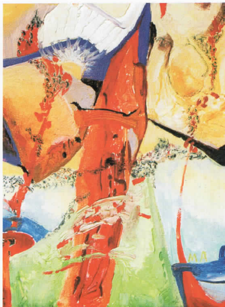
"ПРОДОР" маско на платно