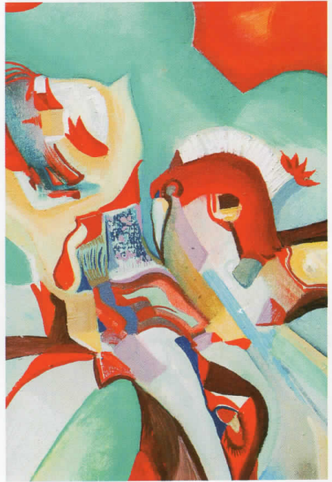
"ЛАЖНИ ПРИВИДЕНИЈА" масло на платно