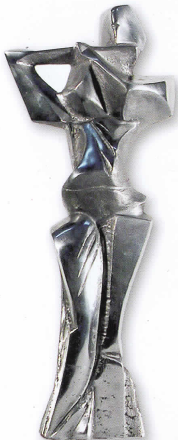
“Флејгист“ , алуминиум, 2007