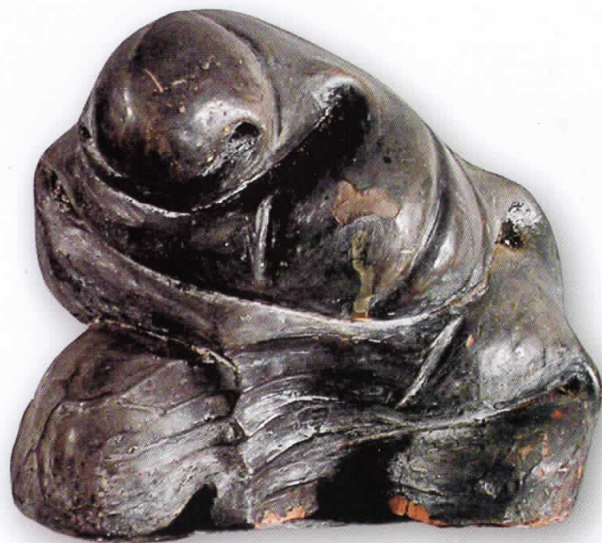
“Форма 1” , теракота, 1993