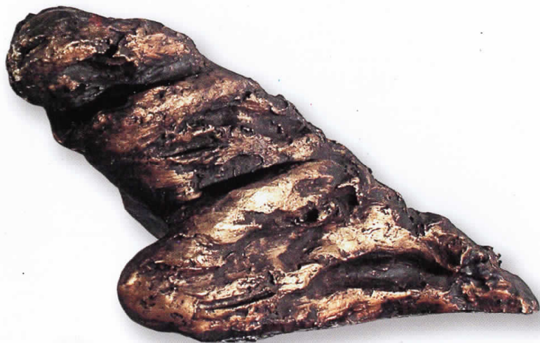
"Флексија", полиестер, 2000