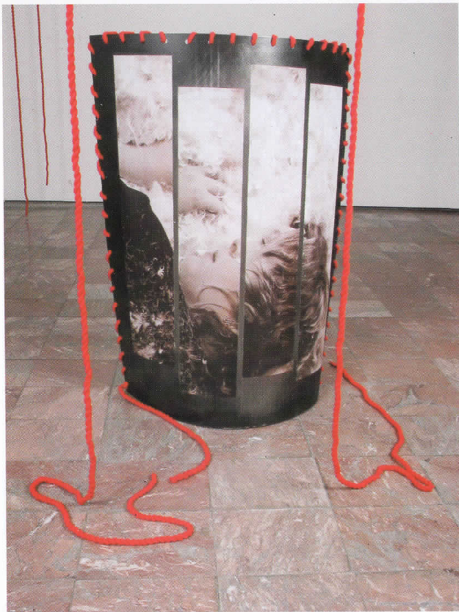
“За ритамот на полните празнини”, комбинирана техника во метал, 2005