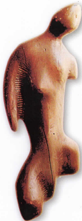
"Акт" , дрво, 1998