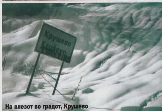
На влезот во градот, Крушево