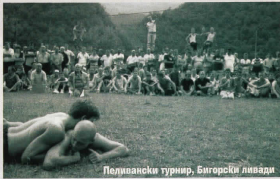
Пеливански турнир, Бигорски ливади