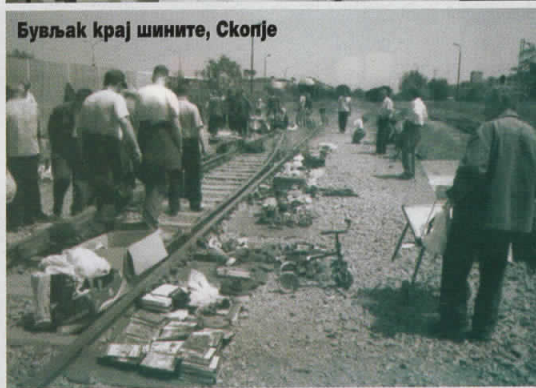
Бувлак крај шините, Скопје