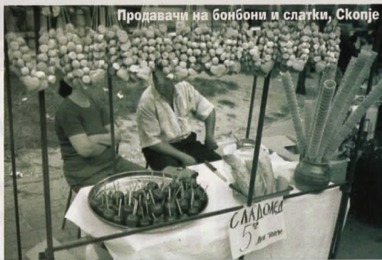
Продавачи на бонбони и слатки, Скопје

■ За време на проектот имате направено 2.00 фотографии и потрошено 100-ина филмови. Како воопшто успеавте од толку материјал да издвоите само 74 фотографии кои