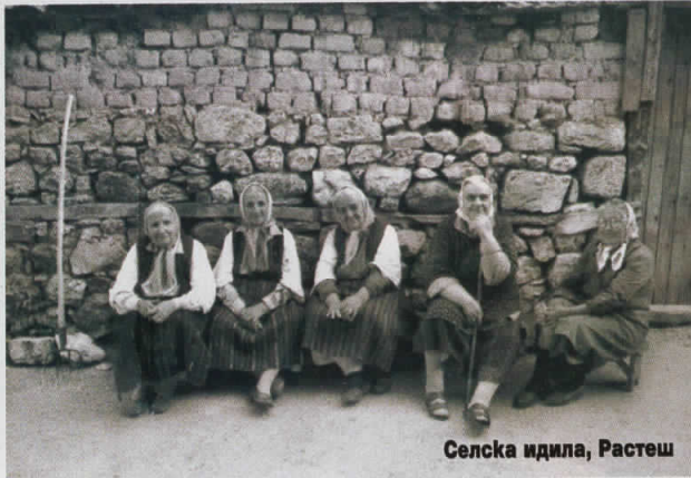
Селска идила, Растеш

■ Ја познававте ли земјава толку добро географски за да тргнете во