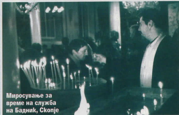
Миросување за време на служба на Бадник, Скопје

● Да, речиси секогаш. Работев во период кога во земјава беше актуелна новата територијална поделба и со тоа сите беа опседнати. Каде и да одев сите коментираа, се прашуваа што ќе се случи со нивното село, град... Но на крајот, она што се гледа е надвор од какви било дневнополитички случувања. ■ Колку како автор на документарна фотографија имавте услови и средства да се занимавате со ваков вид на уметност? Дали сè се сведува на конкурси за грантови од кои можете да добиете некакви средства за работа, или пак има и некоја друга надеж?