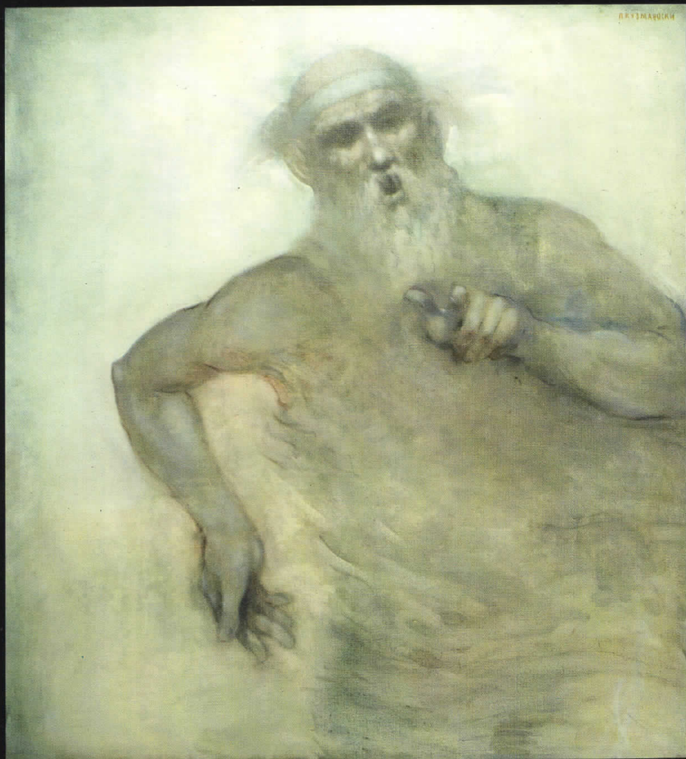
Сведок, 1990, масло на платно, 107х97