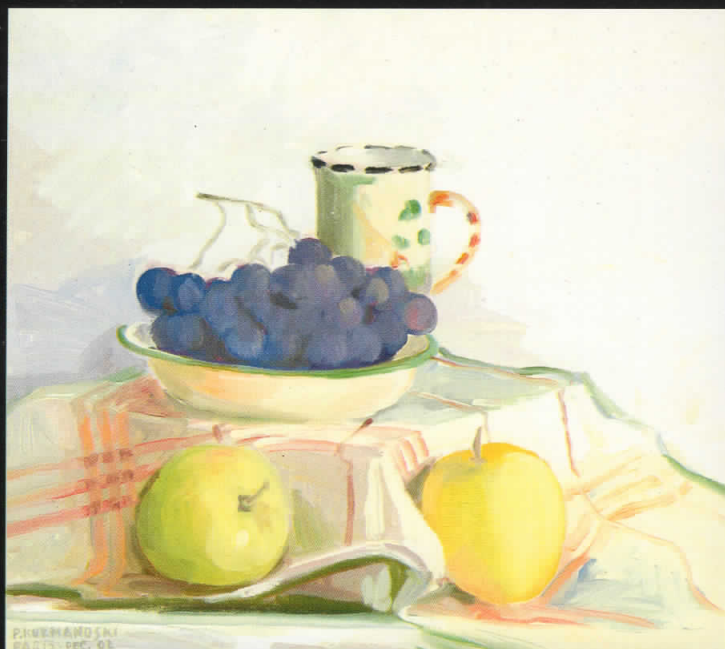
Мртва природа, 2000, масло на платно, 45x40