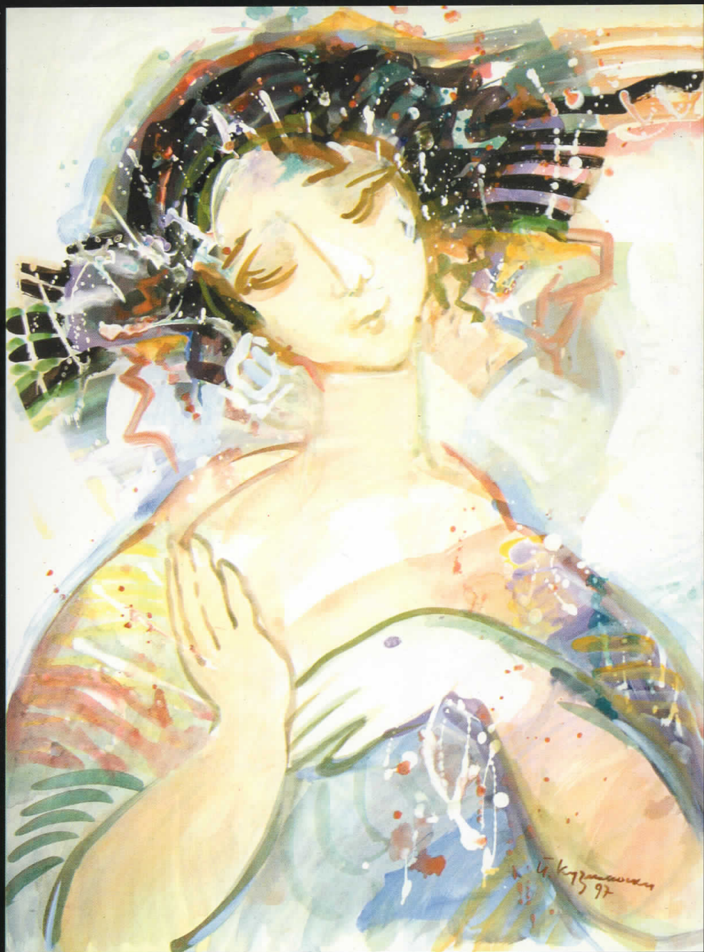
Девојка, 1997, комбинирана техника, 79x59