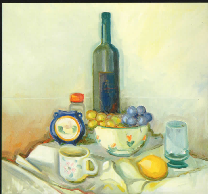
Мртва природа, 2000, масло на платно, 60x55