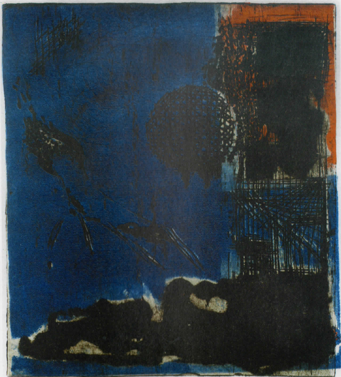
комб. техника Е.А. "КРУГ" 1982 г. S. Zvetta