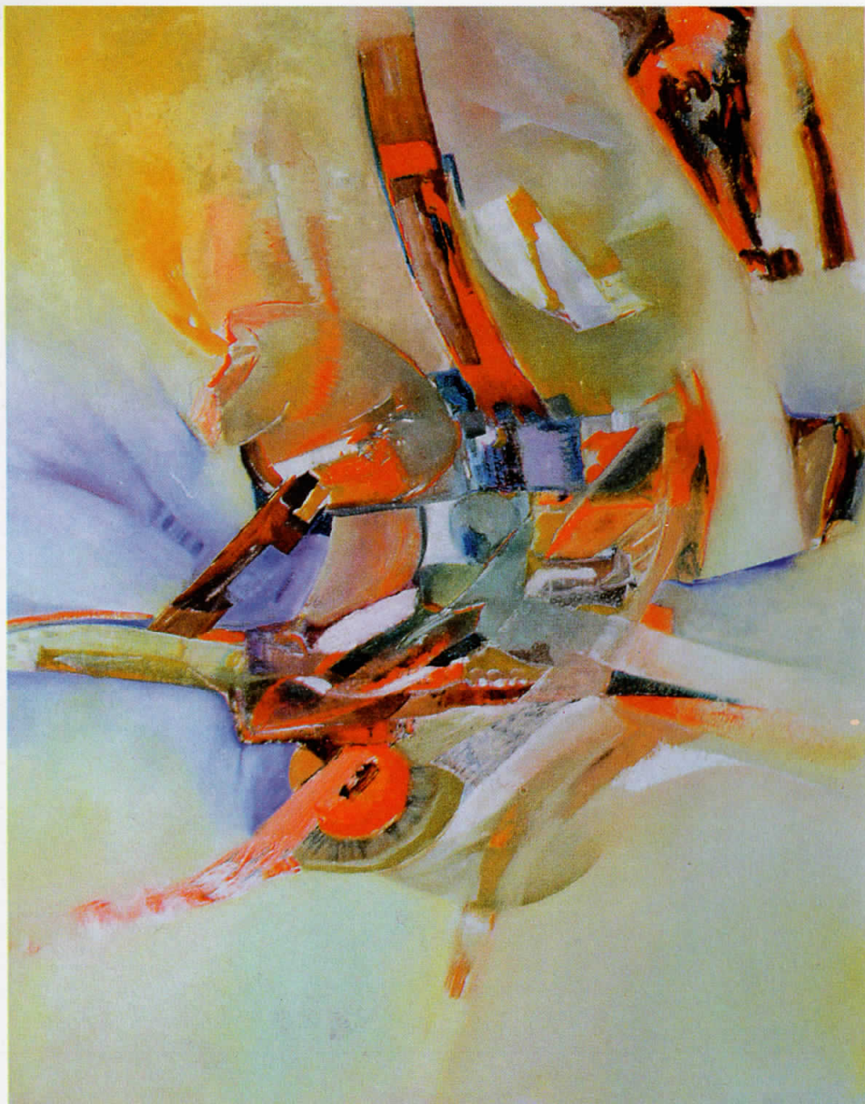
Во светот на тишината In the world of silence 86 x 100