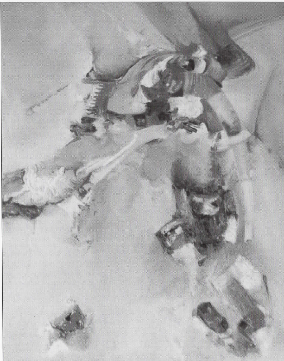
Подводно движење I Underwater movement I 53 x 61