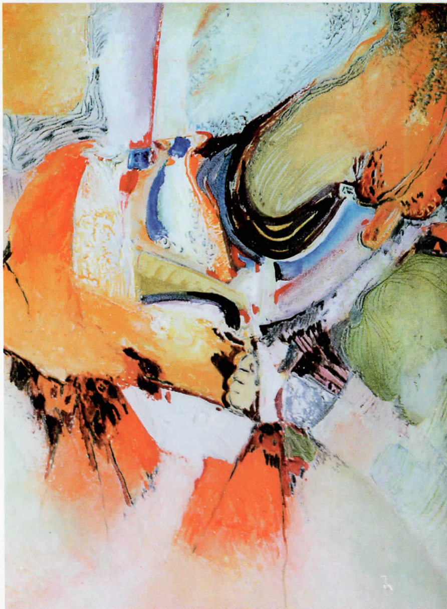
Внатрешно раслојување Inner dislayering 44 x 35