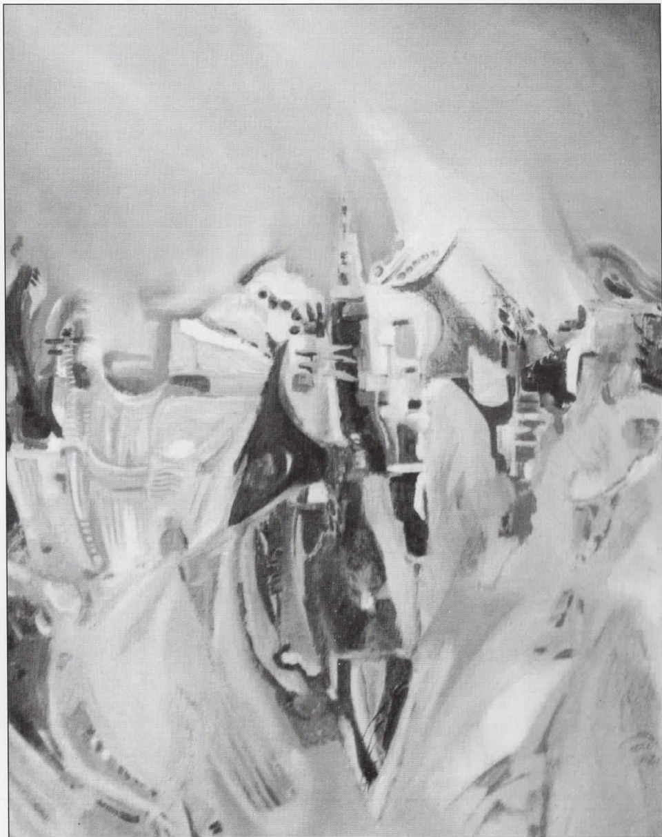
Забравено светилиште Forgotten temple 65 x 75