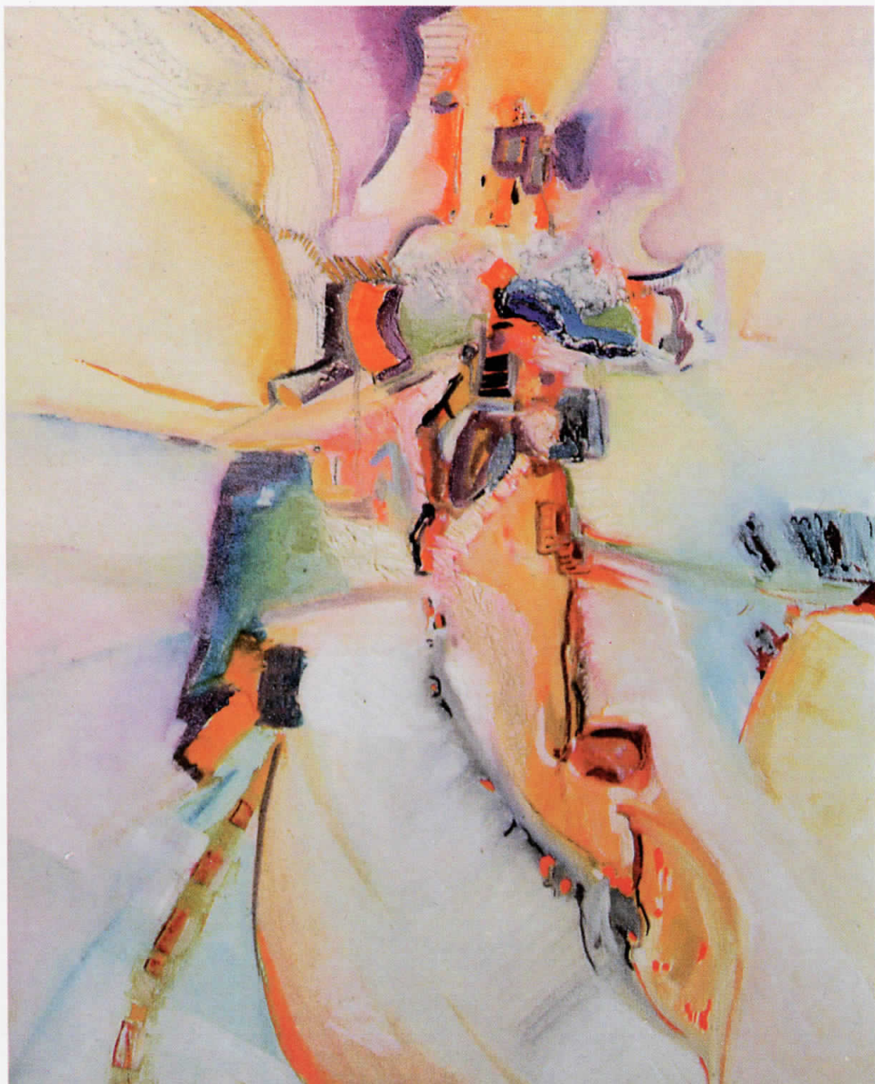
Порака на ветерот Message of the wind 54 x 63