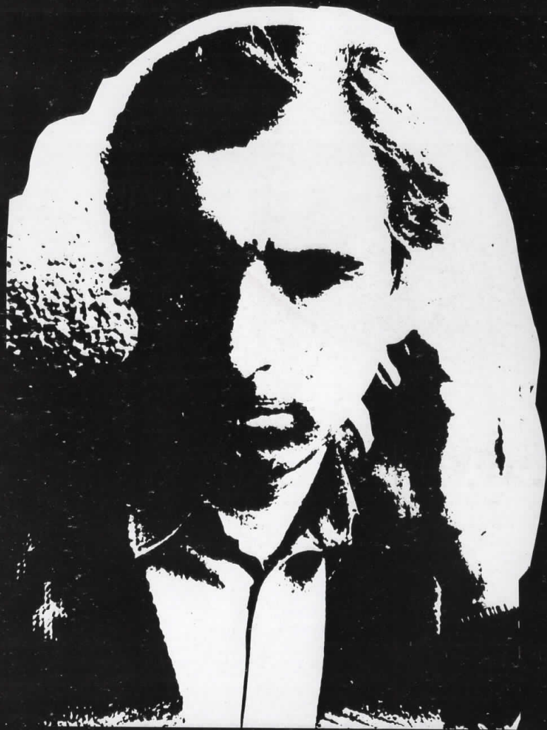
НАСЛОВНА СТРАНИЦА: „Белата шамија“, масло на лесонит, 22×25 см, 1993 COVER PAGE: