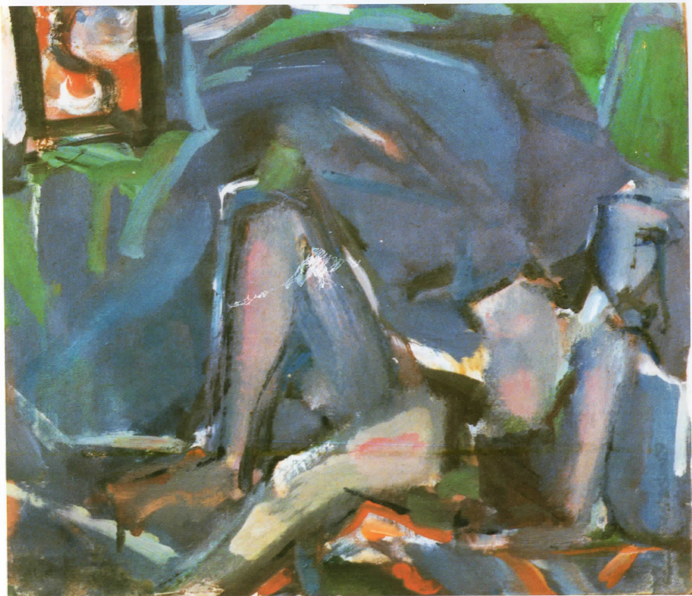
„Акт во сино“, масло на платно, 42,5×48,5 см., 1990