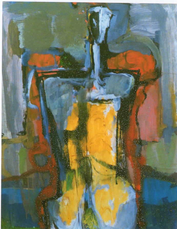
„Жолто сива фигура“, масло на картон, 55×43 см., 1993