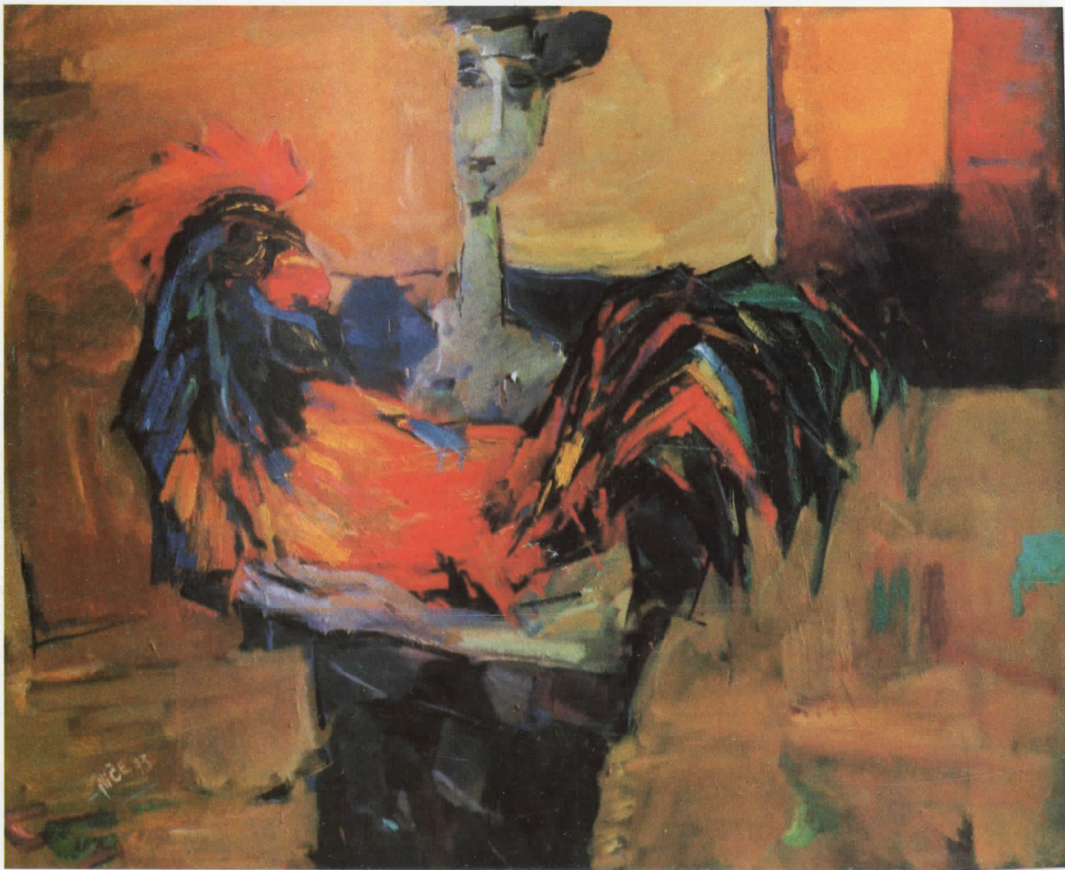
„Жена со петел“, масло на платно, 90×110 см., 1994