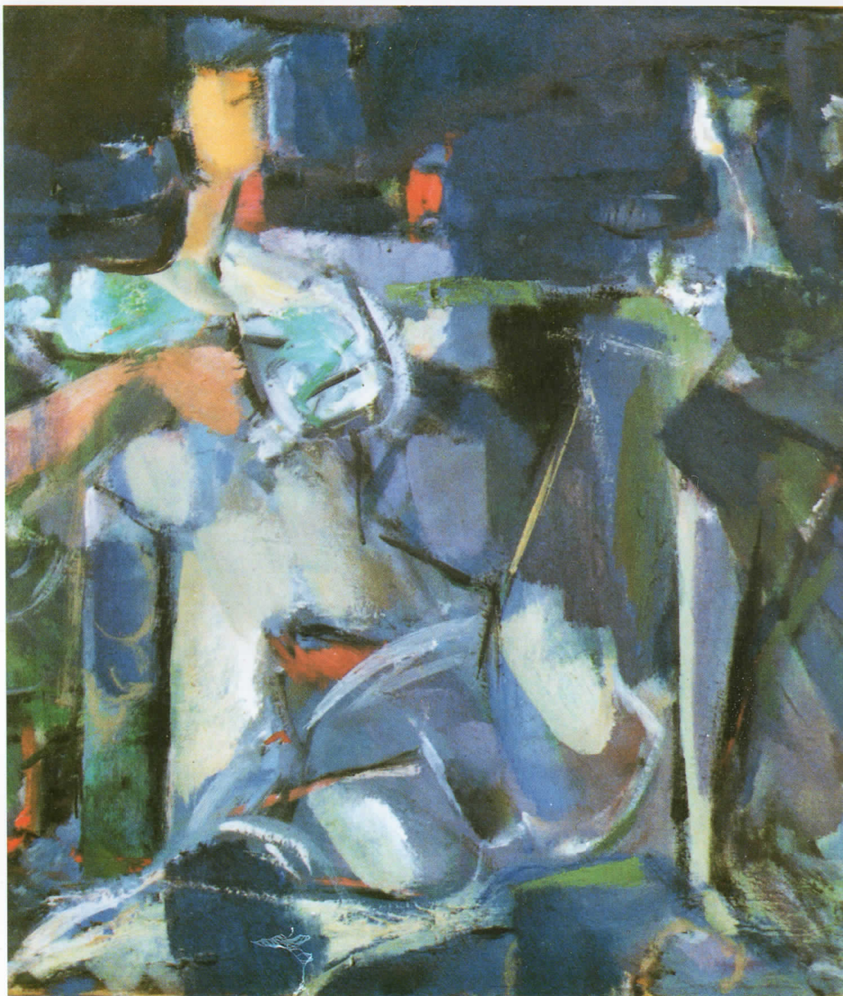
„Интимен дијалог“, масло на платно, 45×39 см., 1991