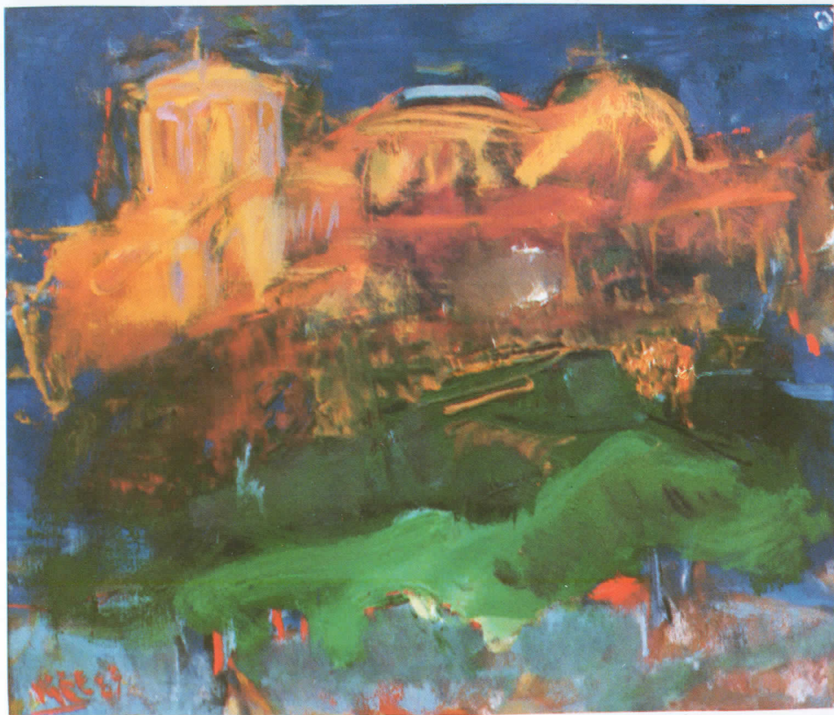
„Манастир“, масло на платно, 24×48 см., 1992