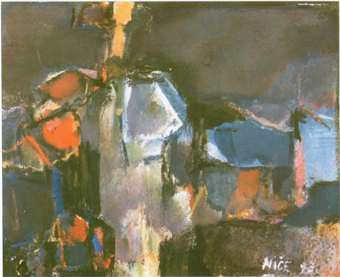
„Композиција“, масло на платно, 25×25 см., 1993