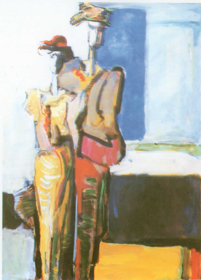
„Пријателки“, масло на платно, 66×92 см., 1993