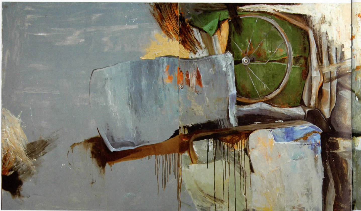
Полиптих - отфрлено тркало, 2009, масло на платно, 120x400 cm Polyptich thrown wheel, 2009, oil on canvas, 120x400 cm