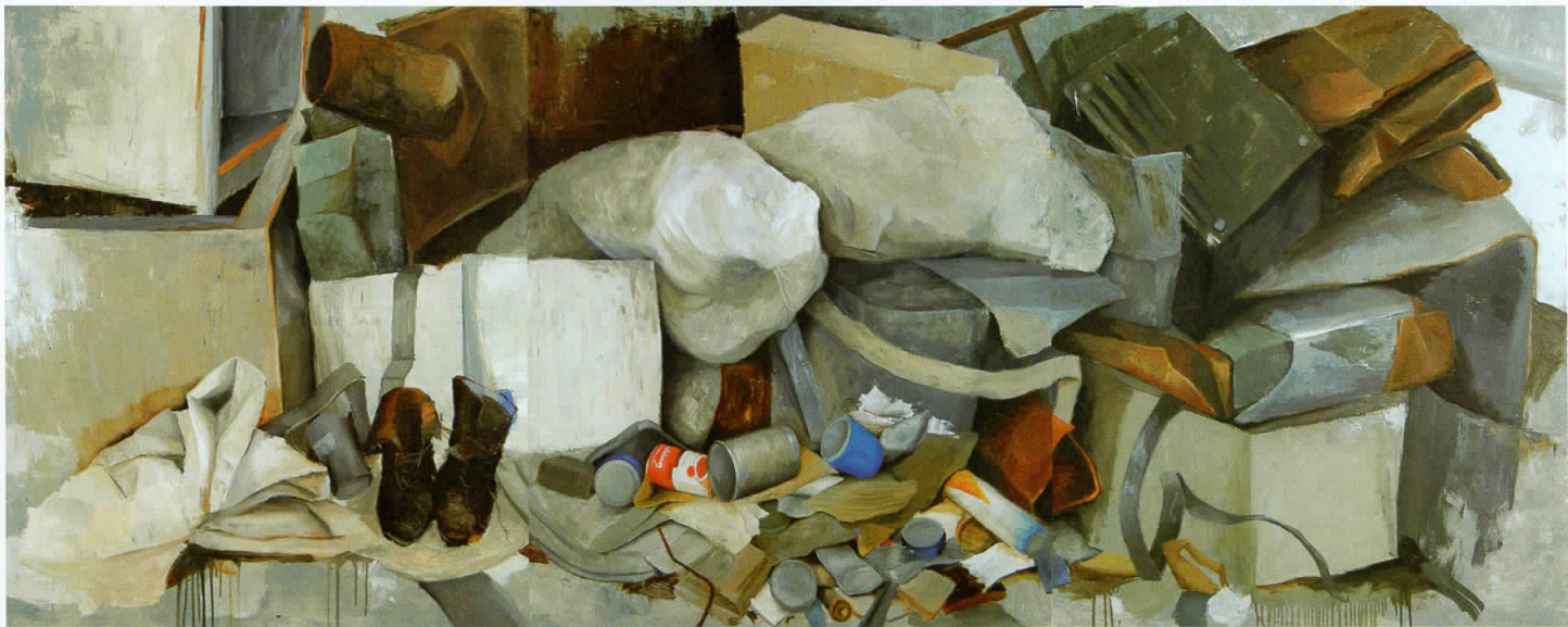
Триптих со В.Г. чевли, 2009, масло на платно, 120x300 см Tryptich with V.G. shoes, 2009, oil on canvas, 120x300 cm