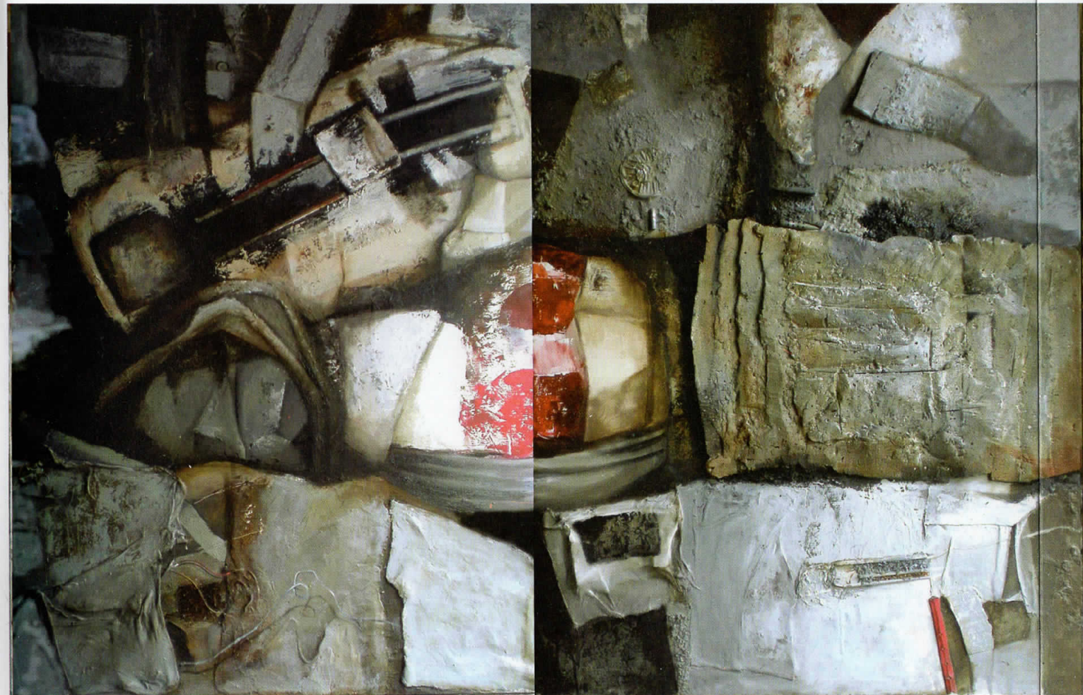
Полиптих, 2008, комбинирана техника на платно, 130x500 cm