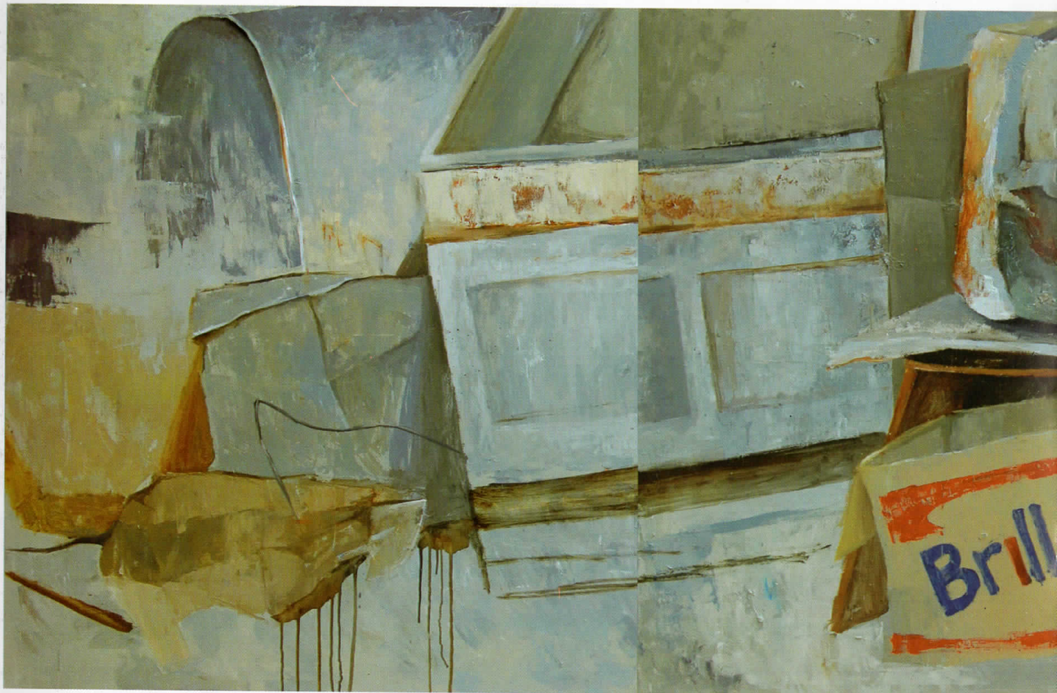
Полиптих со црвен велосипед, 2009, масло на платно, 120x500 cm Polyptych with red bicycle, 2009, oil on canvas, 120x500 cm