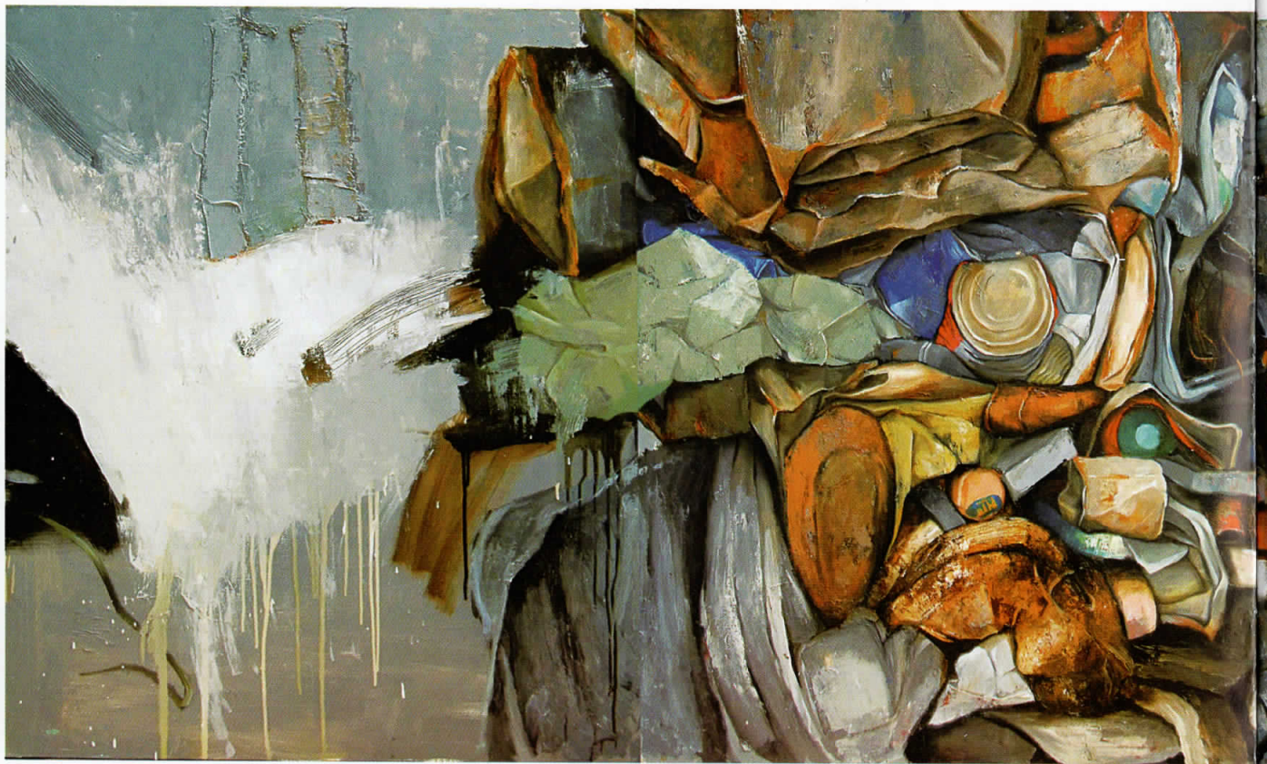
Компресии, 2009, масло на платно, 120x400 см Compressions, 2009, oil on canvas, 120x400 cm