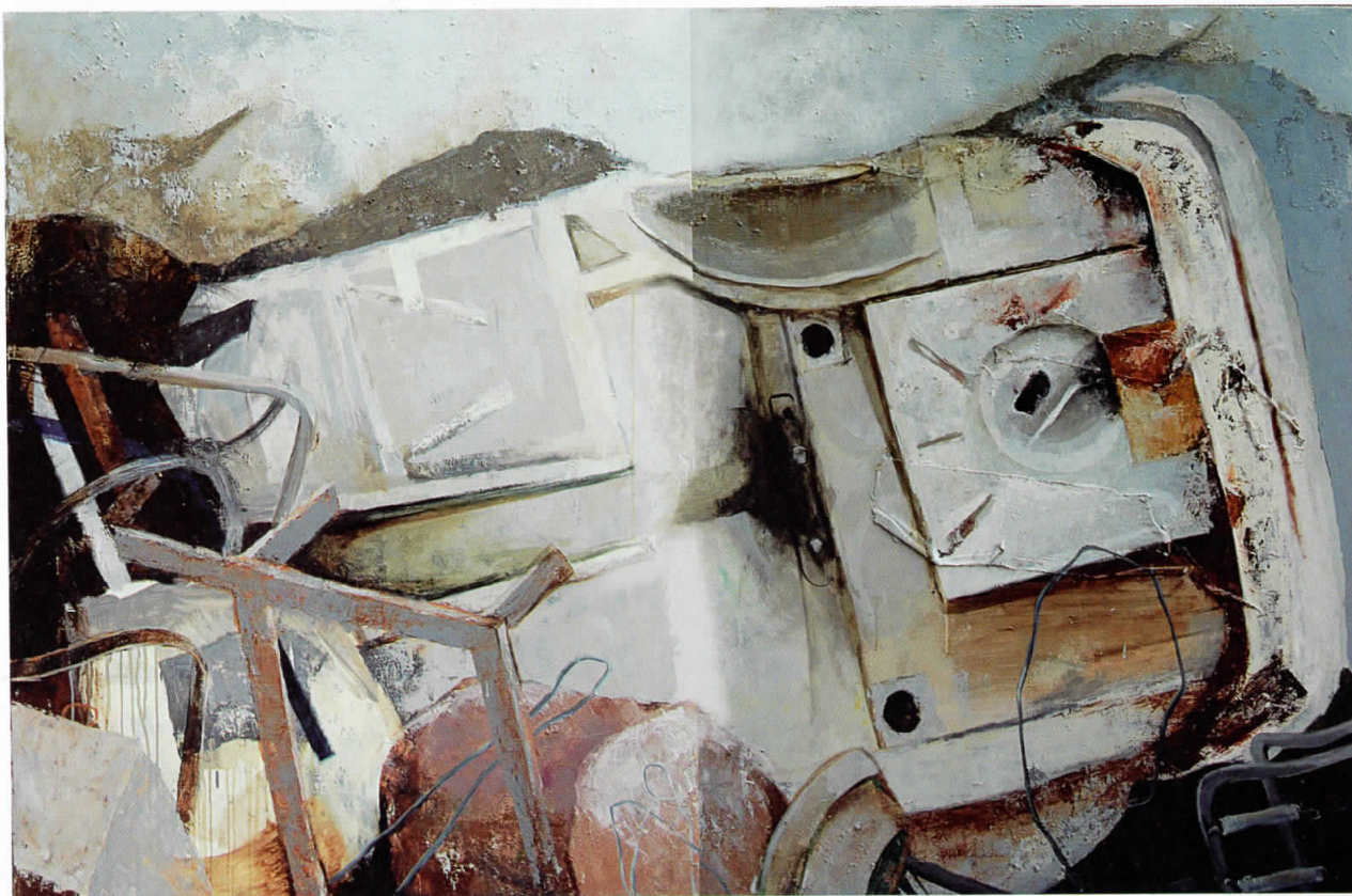
Каросерија, 2008, масло на платно, 150x200 cm Car body, 2008, oil on canvas, 150x200 cm