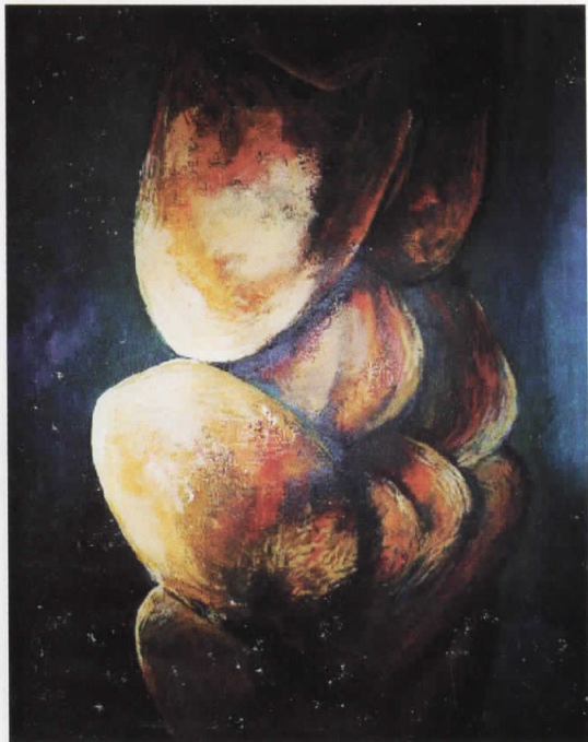
Композиција 3 акрилик на платно 60:90 см