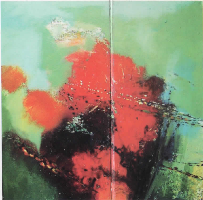
Композиција 2 акрилик на платно 50:50 см