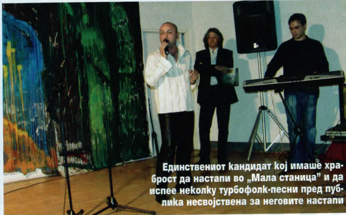
Единствениот кандидат кој имаше храброст да настапи во „Мала станица“ и да испее неколку турбофолк-песни пред публика несвојствена за неговите настапи

би сакала никој да биде камшикуван, но и другата страна е камшикувана секојдневно.