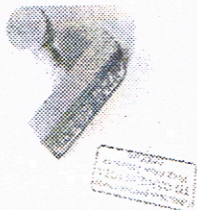
„Пикасо за Никарагва“

Посетителите беа охрабрени да ги изедат семките, а отпадоците да ги фрлаат по подот на Музејот. На тој начин, како што рече авторот, се создава конфигурацијата на ова визуелно дело, кое критички ја гледа Македонија како депонија на реално и идеолошко губре. □