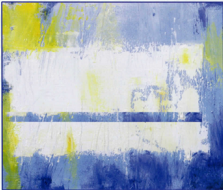
BLUE 26x26 масло на платно