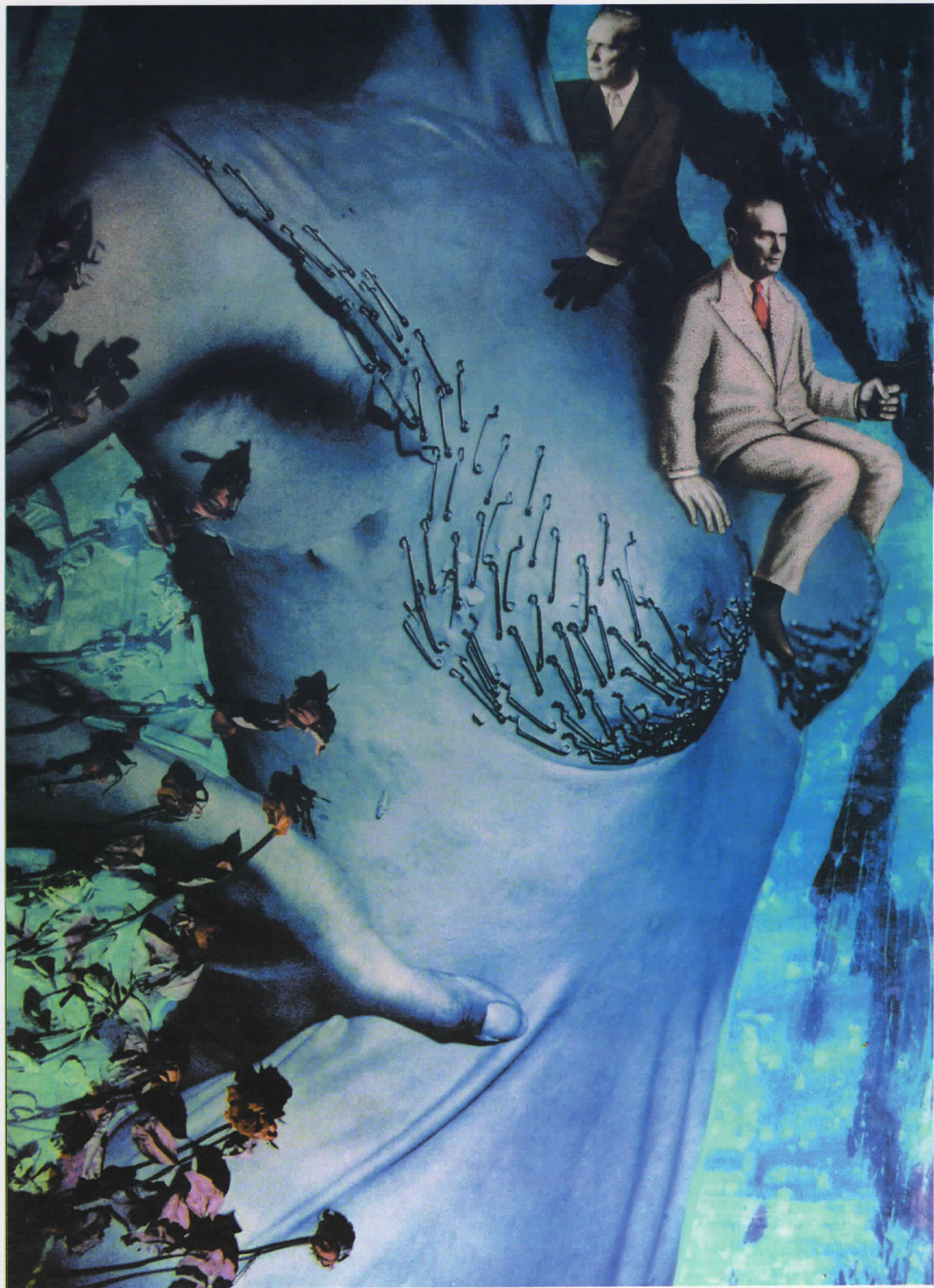
АЦО СТАНКОВСКИ, "Лун - крал на полноќта" комбинирана техника 200x150 цм.