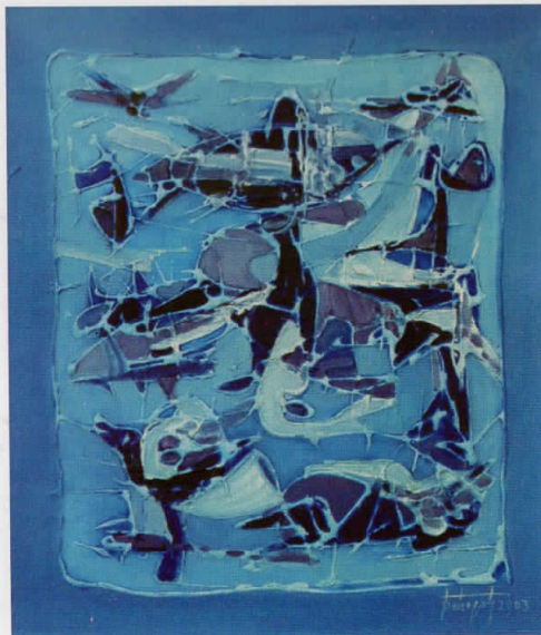
свезден свет star world