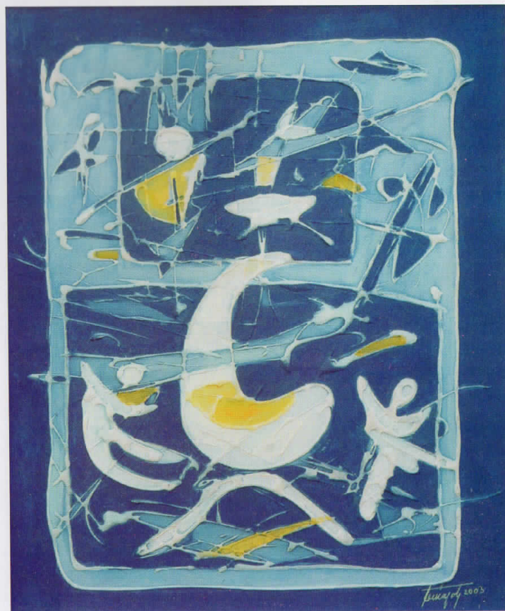
време на анималите time of the animals