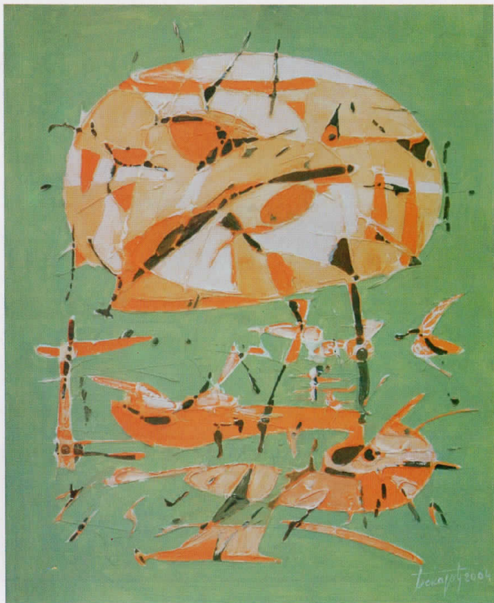
космички облик cosmic shape