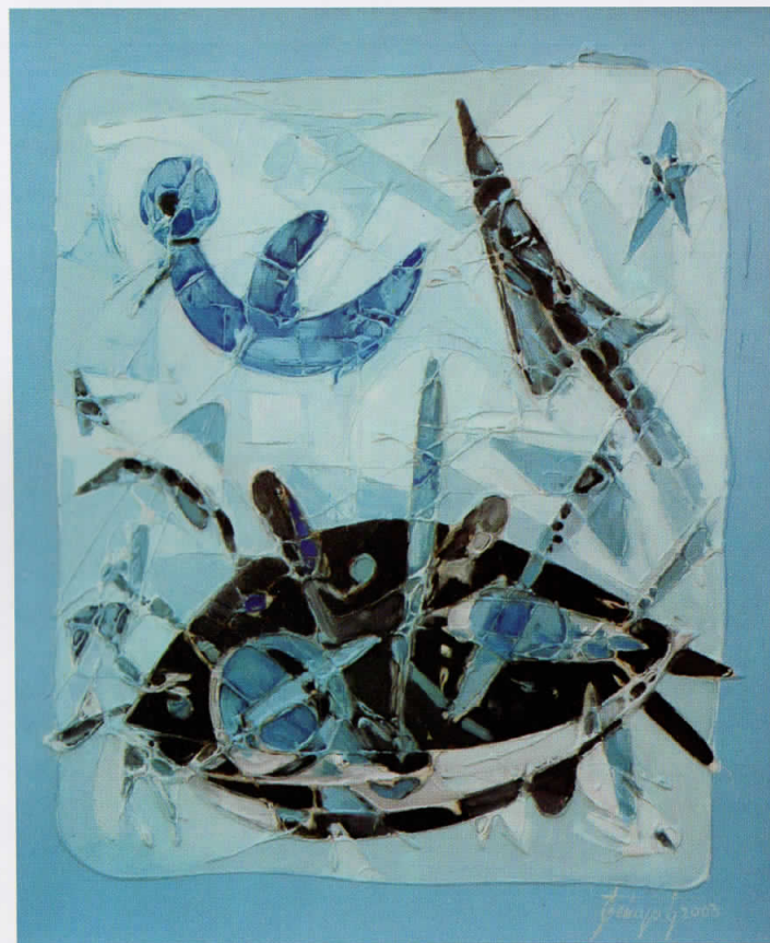
паралелни движења parallel movement