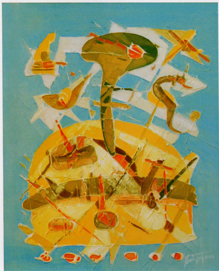
далечни нешта distant things