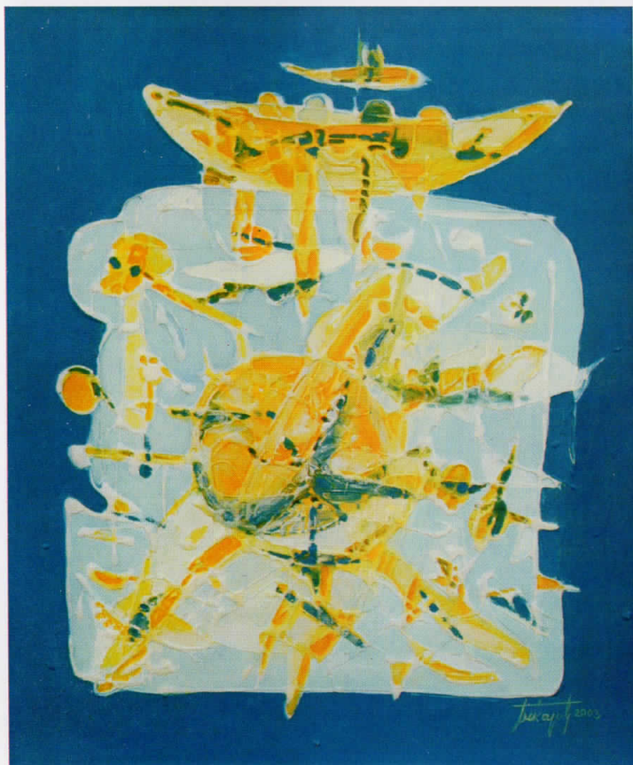
далечни галаксии distant galaxies