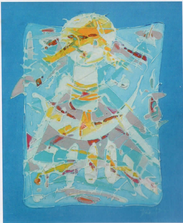
контролирано движење controlled movement