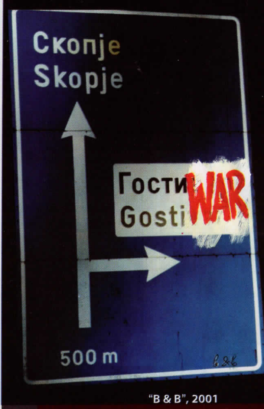
"B & B", 2001

Во твојот однос кон уметноста се има впечаток за