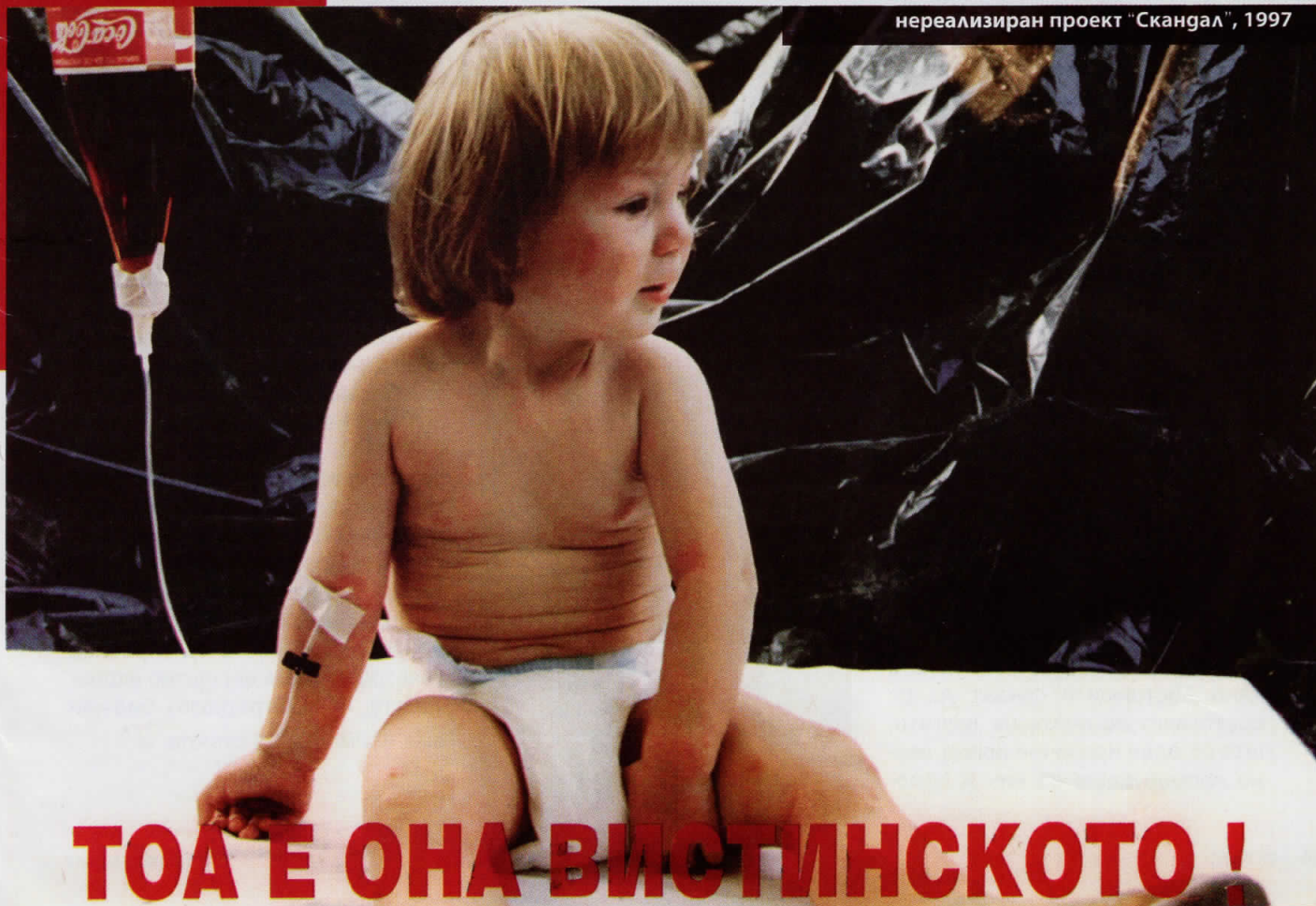
нереализиран проект "Скандал", 1997