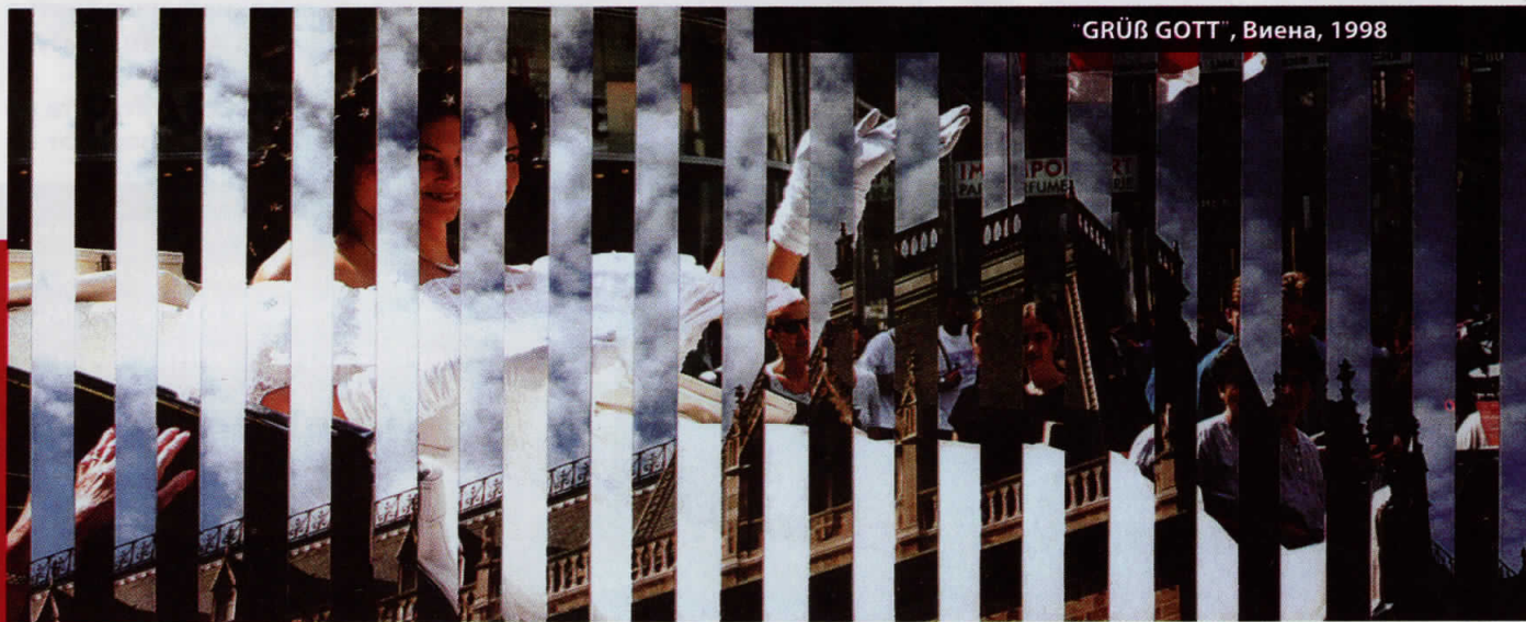
"GRÜß GOTT", Виена, 1998