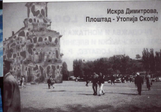
Искра Димитрова, Плоштад - Утопија Скопје