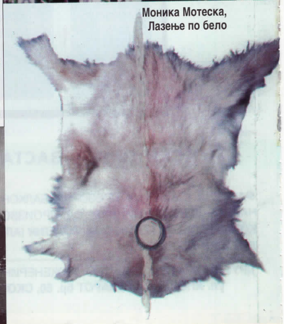
Моника Мотеска, Лазење по бело