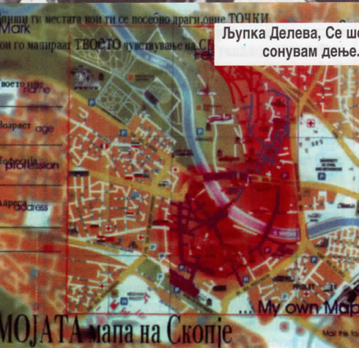
Лљпка Делева, Се шетам, гледам сонувам дење... низ градот