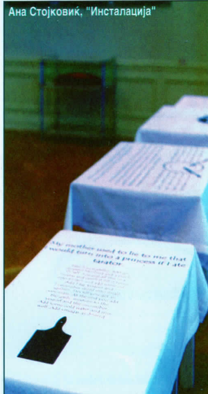
Ана Стојковик, "Инсталација"

Учесничките на изложбата "Мечтата на мојот живот" на различен и на сосема индивидуален начин и со многу успешен пристап одговорија на петте поттеми коишто кореспондираат со помалку романтичниот наслов на изложбата: "Забава"; "Звучите на куќата"; "Кујната - склад на семејните сншита"; "Добри девојки/лоши девојки" и "Танцот на архангелите/Градина на цвеќињата". Авторките од овие четири балкански земји, користејќи најразлични медиуми: фотографија, видео, објекти и инсталации, ги изразија своите размислувања преку различни аспекти: лично-емоционални, но и егзистенцијално-социјално-политички, притоа продирајќи во сферата на (само)критичноста, иронијата, егоцентризмот, меланхолијата, изолацијата,