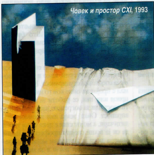
Човек и простор CXI, 1993