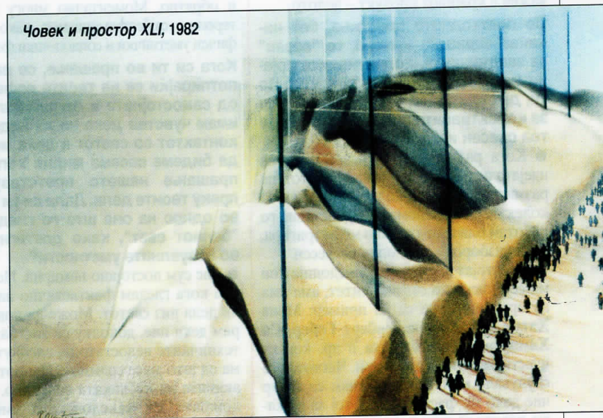
Човек и простор XLI, 1982