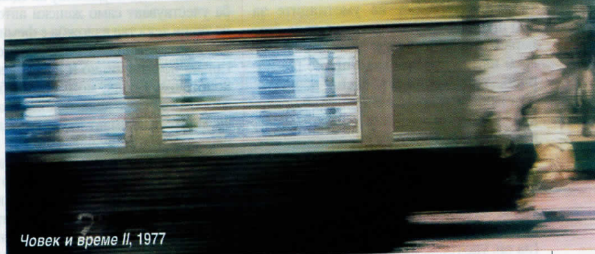
Човек и време II, 1977