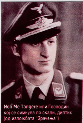
Noli Me Tangere или Господин кој се симнува по скали, диптих (од изложбата "Зрачења")